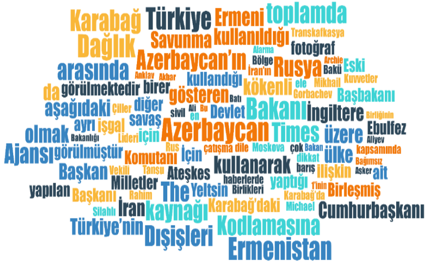
Şekil 1: Analizi Yapılan Haberlerin Kelime Bulutu

Çalışmadan elde edilen verilerin Maxquda uygulamasında kelime bulutu oluşturulmuştur. Kelime bulutu yöntemiyle The Times'ta örnekleme dahil edilerek analizi yapılan haberlerde en sık kullanılan kelimeler bir bulut görseli halinde hazırlanmıştır. Kelimenin haberde bir kere bile geçmiş olması bulut içerisine alınması için yeterli görülmüştür. Ancak konuyla alakasız olduğu düşünülen “ve, ile, ki” gibi bağlaçlar kelime bulutundan çıkarılmıştır.