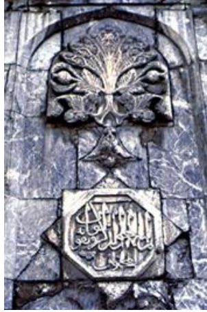
Görsel 1. Sivas Gök Medrese, Taçkapı Üzerine İşlenmiş Hayat Ağacı Motifi (URL-1).

Selçuklu Devleti'nin sembolü olan kartal genellikle dünya ağacıyla birlikte düşünülmüştür. Saraylarda, medreselerde, cami duvarlarında kabartma şeklinde işlenmiştir (Çoruhlu, 2020: 265). Sivas Gök Medrese'nin taçkapısına işlenmiş hayat ağacı ve üzerinde kuş motifi dikkat çekmektedir.