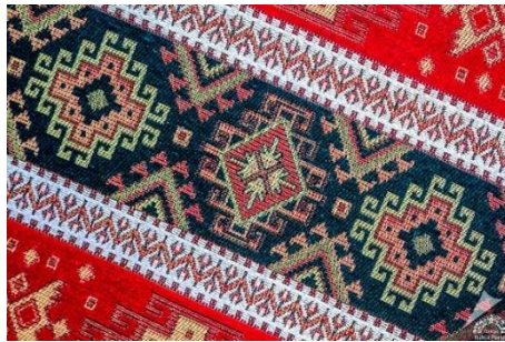
Görsel 5. Geleneksel Türk Halısı (URL-4).

Geleneksel Türk süsleme ve halı sanatında önemli bir yer tutan hayat ağacı motifi, halılara sıklıkla işlenmektedir. Servi, kayın, nar, meşe, zeytin gibi ağaçlar da dokumalarda yaygın olarak kullanılmaktadır (Tüm Cebeci, 2022: 13).