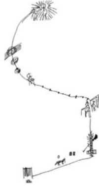
Görsel 2. Şamanların Göksel Yolculuğu (Çoruhlu, 2020: 42).

Kayın ağacı İslami motifler arasında “Tuba Ağacı” ile ilişkilendirilmektedir. Tokat’ın Niksar ilçesinde bir kayın ağacı kutsallığını sürdürmektedir. Dileği olan kişiler, dua ettikten sonra kendi kıyafetlerinden bir parça yırtarak ağaca bağlamaktadır (Ergun, 2004: 207). Sibiryaya bölgesinde yaşayan Türkler bayramlarında kayın ağacını merkeze almışlardır. Burada Kayın Bayramı kutlanmaktadır. Güney Altaylılar, kayın budaklarının uğursuzlukları önlediğine inanmaktadır. Bu yüzden çok yağmur yağdığına yıldırım çarpası ve sel baskınından korunmak için ocaklarına kayın dalı/odunu atarlar. Hırsızları bulmak için de kayın ağacına başvurulduğu görülmektedir. Kaybedilen neyse bulunması için ormanlardaki kayın ağacına gidilir, ağacın dalı bükülür ve dibinden bir avuç toprak alınır. Bu yapıldığı anda suçlu kişi aniden hastalanır ve hırsız bu şekilde ortaya çıkar (Ergun, 2004: 205). Kayın budağı, C vitamini yönünden zengindir ve “yultza” hastalığının tedavisinde, iç hastalıklarının (karın bölgesi için) tedavisinde kullanılmaktadır (Ergun, 2004: 201). Kayın ağacı çabuk kaynayan bir ağaçtır. Yeni bir ağaç parçası ile kısa zamanda bütünleşebilmektedir. Bu hususta akrabalık, dönürlük belirten terimlerinden de bahsetmek gerekir. “Kayın-ata, kayın-ana, kayın, kayınço” gibi kelimeler, ailelerin birbirlerine kısa sürede yakınlık kurması temennisi ile kullanılmıştır. Zaten kayın, dönür olarak da tanımlanmıştır (Kaşgarlı Mahmud, 2018: 12).