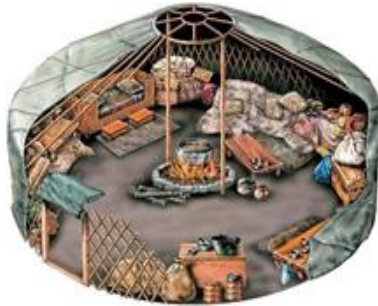
Görsel 3. Çadır/Yurt/Otağ (URL-2).

İnsanların kullandıkları çadırların, diğer adlarıyla yurtların veya otağların, daha sağlam hâle gelmesi için dış cephelerinde kayın kabuğu kullanılmaktadır. Burada kullanılan kayın ağacı, kuru olmalıdır (Ergun, 2004: 205). Kayın ağacının varlığının aile birliği ve kutsallığı üzerindeki etkisi de göz önünde bulundurulmalıdır. Çadırın ortasındaki direk, hayat ağacı olarak da bilinen göğün direği , çadırın üzerindeki çember ise Gök Tanrı'yı sembolize etmektedir (Ergun, 2004: 187).