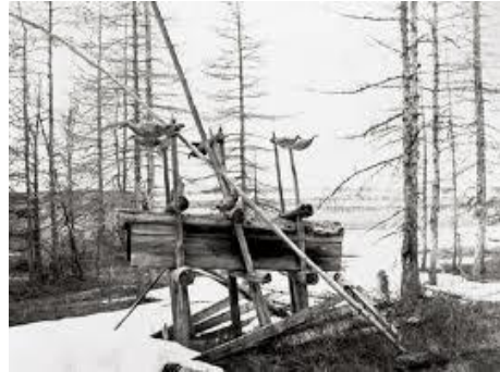
Görsel 8-9. 1700'lü Yıllarda Ağaç Sanduka İçine Gömülen Şaman Kadın, Yakutistan (URL-5); Şaman Mezarı (URL-6).