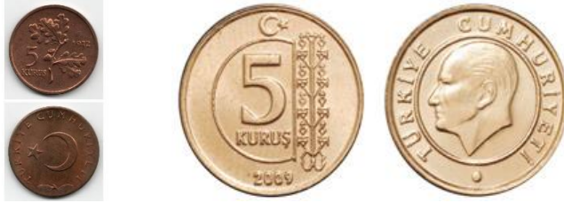
Görsel 4. Paralarda Hayat Ağacı Figürleri (URL-3).

Türkiye Cumhuriyeti'nin 1972 yılında kullandığı madeni 5 kuruş ve 2009 yılından bu yana kullanıldığı 5 kuruşluk madeni paralardaki hayat ağacı motifi dikkat çekmektedir. Bu motifin devlet geleneği hâline gelmesi ve devletin simgeleri arasında yer alması, İslamiyet öncesi Türk kültürünün ve kadim inançlarının sürdürüldüğünün açık bir örneğini oluşturmaktadır.