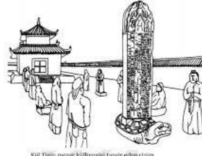
Görsel 6-7. Balbal Tasvirleri (Ögel, 1984); Kül Tigin'e Ait Mezar ve Balballar (Çoruhlu, 2011).

Katanov'un vermiş olduğu bilgilere bakıldığında Yenisey Beltirleri ölen kişinin bedenini tahta üzerinde yıkamaktadır. Bunun yeniden doğuşun gerçekleşeceği kutsal ağaca atıfta yapıldığı çok açıktır. Ritüele bakıldığında erkekler ölü için ağacı oyarak tabut yapmaktadır. Pazırık Kurganları dahil olmak üzere pek çok kurganda bu tabutlara rastlanmıştır (Çoruhlu, 2020: 194). (Görsel 9, 10) Bu gibi uygulamalar hakkında doğrulanmış bilgiler sınırlıdır. Pazırık Kurganları ve benzeri arkeolojik sitelerde ortaya çıkarılan gömü malzemeleri genellikle taştan ve başka malzemelerden yapılmıştır.