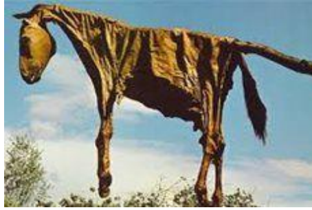
Görsel 10. Kurban Edilmiş Atın Derisinin ve Kemiklerinin Asıldığı Baydara (at kurbanında hayvanın derisinin geçirildiği sırık) (Üren, 2015).

Bazı Türk beylerinin mezarları için yüksek dağ tepeleri, kimsenin ulaşamadığı ve bilmediği yerler tercih edilmiştir. Genellikle mezarlar; atlara çığnetilmiş, üzerinden nehir geçirilmiş ya da Dede Korkut'un cesedi gibi suya bırakılarak yok edilmiştir. Yüksek rütbeli kişilerin direkler üzerine, bir tabuta konulduğu bilinmektedir (Çoruhlu, 2020: 198).