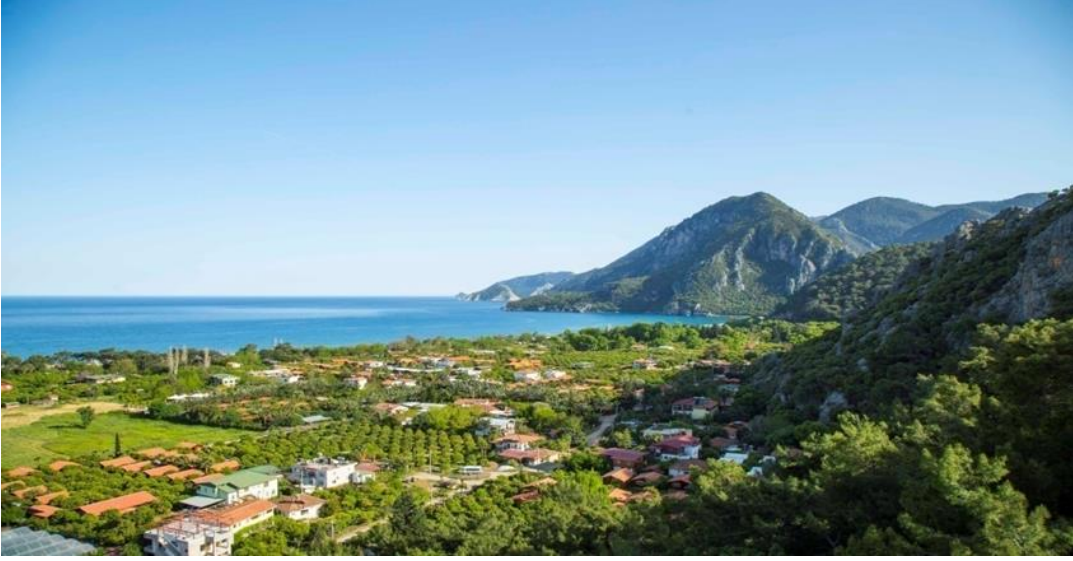
Fotograf 2: Çıralı Kıyı Kesimi