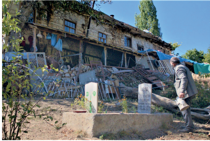
Fotoğraf 1: Ahmet'in Yařadığı Ev ve Evin Önünde Eři Zeynep'in Mezarı