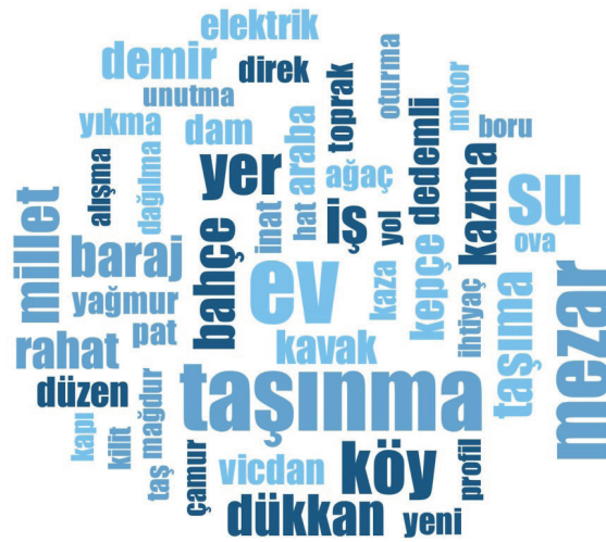
Şekil 3: Kelime Bulutu

Filmde “ millet ” kelimesi (f=7) daha çok taşınma sürecinde kullanılmıştır (Tablo 2). Filmde geçen “ millet alışsın oraya, orada da kurulur düzen ” ve “ millet başladı mı taşınmaya? ” şeklindeki ifadeler taşınmaya karar vermede biraz da köy sakinlerine göre hareket edildiğini göstermektedir. Türkiye’de yer değiştirmiş birçok yerleşmede de benzer bir eğilim görülmektedir. Bu konuda kararın oluşmasında genellikle yerleşmelerdeki kanaat önderlerinin ve hatta bir veya birkaç şahsın önemli rolü olmaktadır. Ayrıca görerek faydasına inandığı konularda halkımızın teşebbüs gücü oldukça yüksek durumdadır (Ceylan, 2022). Filmde geçen diğer kelimeler bir bütün halinde değerlendirildiğinde; yer değiştirme nedenini açıklayan “baraj” kelimesinin, fonksiyonel özelliklere vurgu yapan “bahçe”, “dükkan”, “iş”, “demir” ve “profil” kelimelerinin ve alt yapı faaliyetlerine vurgu yapan “elektrik” ve “hat” kelimelerinin nispeten sık bir şekilde tekrarlandığı görülmüştür. Filmde ayrıca konumu ifade eden “yol” ve “ova”, kabullenmeyi ifade eden “alışma”, “düzen” ve “rahat”, süreci anlatan “yıkma”, “kazma” ve “keççe” gibi kelimelerin de sıklıkla kullanıldığı dikkati çekmiştir. Son olarak duygu durumunu ifade eden “vicdan” ve “inat” sözcükleri de kelime bulutunda yer almıştır.