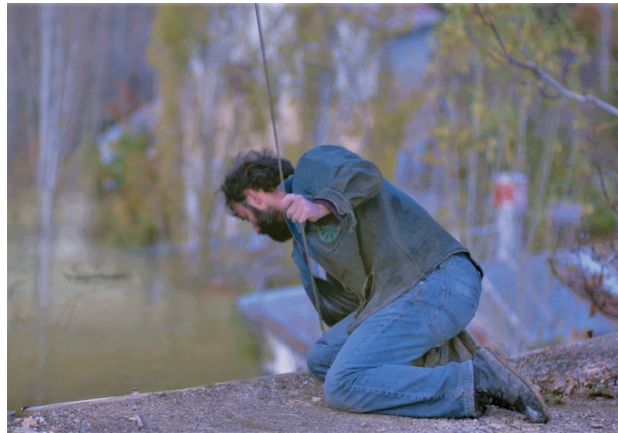
Fotoğraf 2: Filmde řükrü Evinin Damına Bir Demir Çubuk Yerleřtirirken

řükrü: Dama dikecem. Valla dama dikecem. Ya buralar suyun altında kaldı mı güzel olmaz mı?