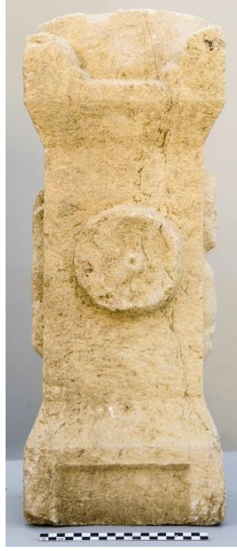
Resim 3: Sol Yüz