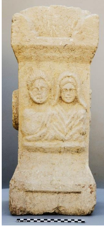
Resim 1: Ön Yüz