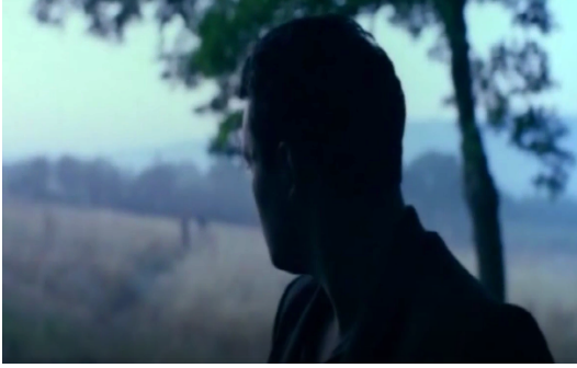
Görsel 11. Mayıs Sıkıntısı. (1999). 1'. 59"