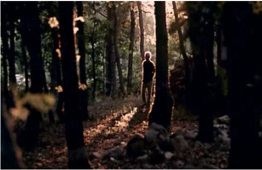
Görsel 9. Mayıs Sıkıntısı. (1999). 1'. 15"