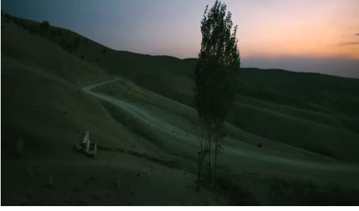
Görsel 20. Bir Zamanlar Anadolu'da. (2011). 4'. 31"