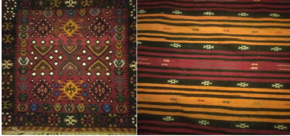
Şekil 2. Gömürgen Dokumaları (Koca, 2021)

Kayseri ve yöresi Selçuklulardan beri devam edegelen bir dokuma kültürüne sahiptir. Kayseri’de özellikle Bünyan, Tomarza, Sarız, Yahyalı, Develi, İncesu, Gömürgen gibi yerleşim alanlarının geçmiş dönemlerde önemli birer dokuma merkezi olduğu görülmektedir. Özellikle Gömürgen ve Sarız kilimleriyle ünlü yerleşim merkezleridir. Diğerleri ise daha çok halılarıyla tanınır. Ancak, her birinin kendine özgü bir dokuma geleneği vardır (Deniz, 1999: 670).