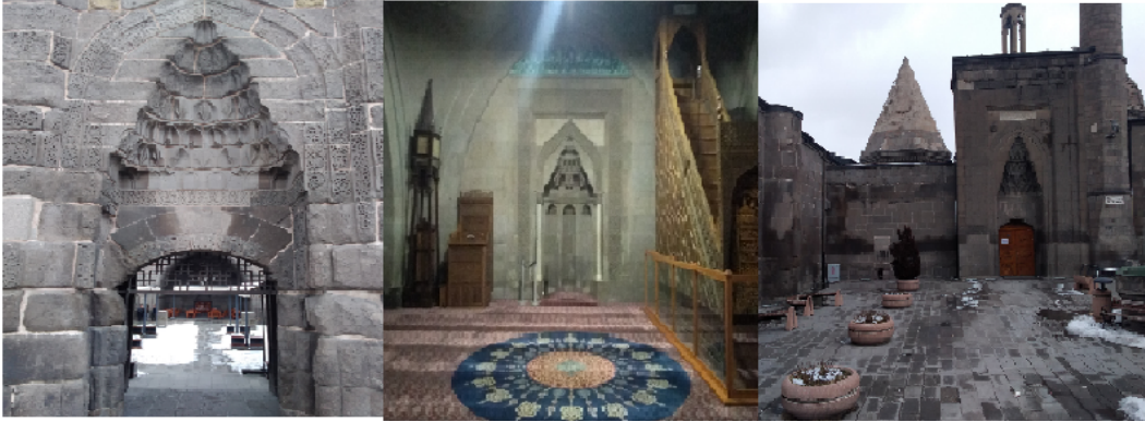
Şekil 1. Hunat Külliyesi

Kayseri merkezde ve kalenin doğusunda yer alan külliye Gıyaseddin Keyhüsrev'in annesi Mahperi Hatun tarafından 1237-1238'de yaptırılmıştır. Medrese'nin avlusu açık ve dört yandan revaklı olup tek katlıdır. Medreseden külliye de bulunan türbe ye giriş bulunmaktadır Caminin batı taç kapısında arslan figürü ikonografı bakımından önem taşımaktadır (Boy, 2017: 65; Şahin, 2010: 485).