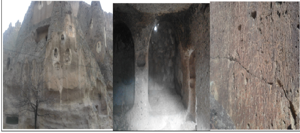
Şekil 4. Soğanlı Destinasyonunda Kaya Yerleşmeleri ve Yazıları

Selçuklu eserleri yapıları, Soğanlı, Koramaz Vadisi ve Kültepe gibi yerler ön plana çıkmaktadır (K8, memur).