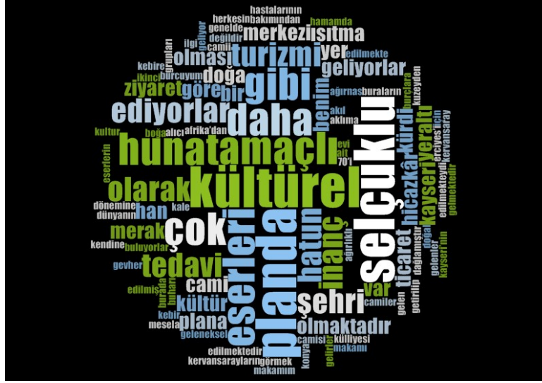
Şekil 3. Görüşmelerde Nvivo ile En Çok Çıkan Kelimeler

Alanda en önemli kültür turizm çekim alanlarını Selçuklu Dönemine ait yapıtlar oluşturmaktadır. Çalışmada Nvivo 10 programında yapılan görüşmelerde kültürel turizmde Selçuklu, Hunat, turizm ve cami gibi kelimelerin daha çok tekrarlanması bunu destekler niteliktedir (Şekil 3). Selçuklu devletinin önemli merkezleri arasında yer alan Kayseri’de bu döneme ait eserler şehrin birçok yerinde görülmektedir. Özellikle Hunat Hatun, Gevher Nesibe, kümbetler ve kervansaraylar yerli ve yabancı ziyaretçilerin ilgilerini çekmektedir. Özellikle Gevher Nesibe bir zamanlar uyguladığı geleneksel tedavi yöntemleri ile ziyaretçilerin uğrak noktalarının başında yer almaktadır.