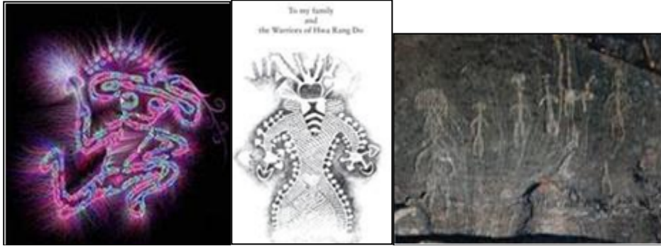
Şekil 8. M.Ö.3500 Tassilli (Bahnhof, 2023) Şekil 9. M.Ö.4000 Tasilli (Stamets, 2000) Şekil 10. Pegtymel. Chukato, Rusya (Ioffe, 2020)

Ayrıca arkeolojik kazılarda, mantar formunda çeşitli eşyalara, (Şekil 11) altın ve farklı metallerden yapılmış takılara rastlanılmıştır (İreç, 2020: 280). Bu bulgular, sanatçıların mantar formunu sıklıkla kullandığını göstermektedir. Mağara duvarlarına resimler çizilmiş, rölyefler kazınmış, mantar üzerine mitolojiler üretilmiş, metal paraların üzerinde (Şekil 12), süs eşyalarında, seramik kaplarda mantar yapılardan ve imgelerden yararlanılmıştır. Prehistorik dönem sanatçısı, mantarı estetik bir form olarak keşfetmiş, heyecan duymuş ve eserlerine yansıtmıştır.