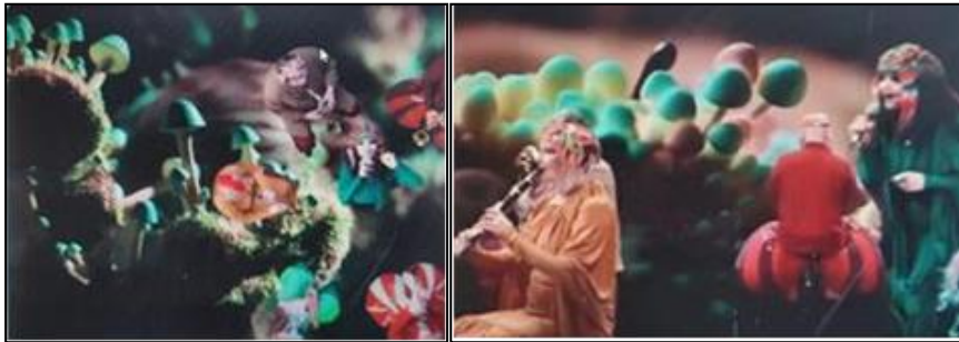
Şekil 30. Björk, Fossora (Björk, 2023)

Popüler müziğin ikonlarından Björk, 2022'de çıkardığı "Fossora" adlı albümünde mantarlardan ilham almıştır. Sanatçı albümünü mantarlara adanmıştır. Albümün hit şarkısı olan "Fossora" klibinde birçok farklı mantar görüntüsüne yer veren sanatçı, (Şekil 30) mantarları özel ve eğlenceli bulduğunu ifade etmiş, verdiği bir röportajda mantarlara olan bu ilgisini dile getirmiştir (Pitchfork, 2022).