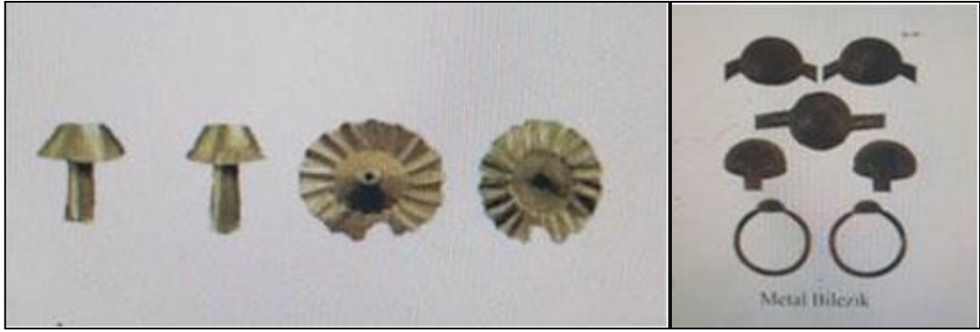
Şekil 11. İzmir, Panaztepe mezar odalarında bulunan altın ve metalden mantar formunda takılar (İreç, 2020)

Ayrıca arkeolojik kazılarda, mantar formunda çeşitli eşyalara, (Şekil 11) altın ve farklı metallerden yapılmış takılara rastlanılmıştır (İreç, 2020: 280). Bu bulgular, sanatçıların mantar formunu sıklıkla kullandığını göstermektedir. Mağara duvarlarına resimler çizilmiş, rölyefler kazınmış, mantar üzerine mitolojiler üretilmiş, metal paraların üzerinde (Şekil 12), süs eşyalarında, seramik kaplarda mantar yapılardan ve imgelerden yararlanılmıştır. Prehistorik dönem sanatçısı, mantarı estetik bir form olarak keşfetmiş, heyecan duymuş ve eserlerine yansıtmıştır.