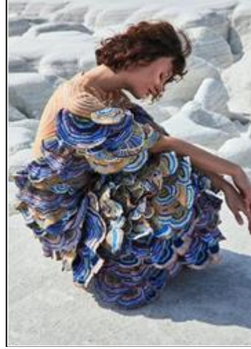
Şekil 32. Raul Mishra, 2021 İlkbahar H.Couture (Jain, 2021)