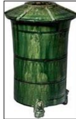
Şekil 19. M.Ö. 200- M.S. 200, Tahıl Kabı (Bempechat, 2020: 96)

Şekil 20 ve 21'de görülen seramik kaplarda da mantar formları açık biçimde görülmektedir. Şekil 20'de gördüğümüz seramik kap mantar şeklinde başlık takan bir insan portresi şeklindedir. Arkeologlar tarafından Maya kültürüne, Şekil 21'te yer alan pişmiş toprak kabın ise Taiono'lara (günümüzde Dominik Cumhuriyeti) ait olduğu ve mantar tanrısı olarak kabul edildiği düşünülmektedir.