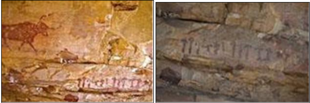
Şekil 5. M.Ö.4000 Villar Del Humo, Selva Pascuala duvar resimleri (Ancient Psychedelia, 2019a)

Etnomikoloji; mantarların kültürel değerlerini, kültürlerin mantarlarla olan ilişkilerini inceleyen bilim dalıdır. Mantarlar, büyük bir kültürün parçalarıdır, binlerce yıldır insan hayatında önemli bir yere sahiptir ve insanların mantarlarla olan ilişkisi ekonomiden, gastronomiye, sanata kadar birçok farklı alanda kendini gösterir (Erdem, 2018: 12-30). Sanat tarihinin ilk örnekleri olarak kabul edebileceğimiz mağara resimlerinin bazılarında mantar betimlemeleriyle karşılaşırız. Şekil 5'te görülen duvar resminde mantarlar net bir şekilde görülmektedir. Bu resimde, halüsinojen özellikler taşıdığı düşünülen yan yana dizilmiş 13 adet mantar betimlenmiştir. Bu örnekler İspanya Selva Pascuala mağarasında yer almaktadır. Mantarların yalnızca o bölgede yetişen, tek halüsinojenik tür olan " Psilocybe Hispanica " olduğu varsayılmaktadır.