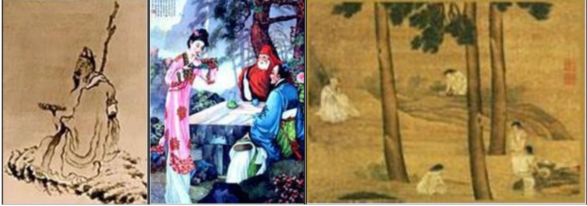
Şekil 15. Chen Hongshou (Muskat, 2024)

illüstrasyonları ile tanınmaktadır. Şekil 16'da ise Çin mitolojisinde güzellik ve ölümsüzlük tanrıçası olan Magu arkadaşlarına Reishi mantarı ikram ederken betimlenmiştir. Eser anonimdir. Şekil 17'de görülen Çin sanatına ait olan Li Shida tarafından yapılan "Oturup Çam Rüzgârını Dinleme" isimli eser, ölümsüzlükle bağdaştırılan Reishi mantarını toplamayı konu edinmiştir. Eserde iki ağaç arasında görülen figür Reishi mantarı toplamaktadır. Çin sanatında Reishi mantarını konu edinen çok sayıda eser yer almaktadır.