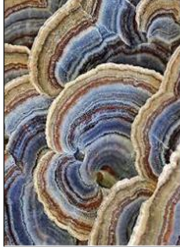
Şekil 31. Hindi Kuyruğu Mantarı (Fantastic Fungi, 2024)

Popüler kültür içinde yer verebileceğimiz bir diğer sanatçı Hintli moda tasarımcısı Raul Mishra'dır. Mishra Paris'te düzenlenen "Couture Spring 2021" için hazırlamış olduğu koleksiyonunu mantarlar üzerine kurgulamıştır. Tasarımcı izlemiş olduğu "Gezegenimizde Bir Hayat" isimli belgeselin bir ağaç kabuğundan filizlenen mantarı konu aldığı bölümden etkilenmiş ve bu koleksiyonu oluşturmuştur (Goize, 2021). Koleksiyonu oluşturan parçalar Hindi Kuyruğu (Turkey Tail) isimli mantardan esinlenerek tasarlanmıştır. Şekil 32'de görülen elbise koleksiyonunun en gözde parçalarından biridir. Elbiseyi oluşturan her parça ipek ve tül kumaşların elde işlenmesi ile üretilmiştir. Elbise tasarımıyla mantarın görsel güzelliğini yansıtmaktadır.