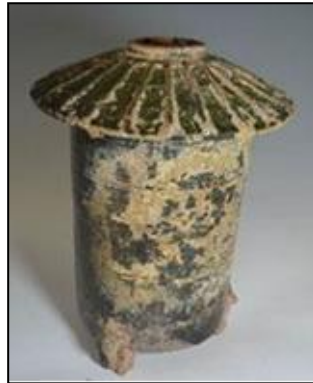
Şekil 18. M.Ö. 206- M.S. 220, Tahıl Kabı (Ancient Psychedelia, 2019c)

Şekil 18 ve 19'da görülen pişmiş topraktan yapılmış olan eserlerde mantar formunu açıkça görebiliriz. Sırlı seramik parçaların Çin kültürüne ait olduğu ve tahıl saklamakta kullanıldığı tespit edilmiştir.