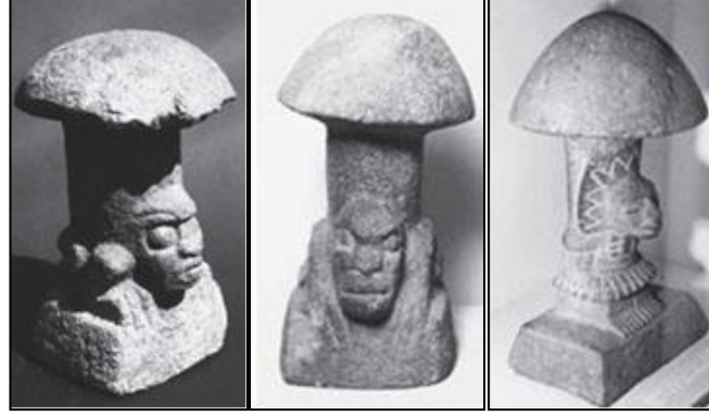
Şekil 14. Maya mantar taşlarından örnekler, M.Ö 3000 (Stamets, 2000)

Mantarların birçok farklı amaçla insan var olduğundan bu yana kullanıldığı tahmin edilmektedir. Mağaralarda bulunan resimler, tapınaklardaki duvar rölyefleri, mantar formunda taştan oyulmuş heykeller, mantarlara verilen önemin, duyulan saygının belgeleridir (Bempechat, 2020: 96). Bu buluntulardan en ünlüsü Mayalar tarafından yapıldığı düşünülen ve Guatemala'da bulunan mantar şeklinde oyulmuş taşlardır (Şekil 14). Kamanalijuyu Guatemala'da bulunmuş bu mantar grubunun Maya Uygarlığı'na ait olduğu ve dini törenlerde kullanıldığı ifade edilmektedir (Stamets, 2000: 3).