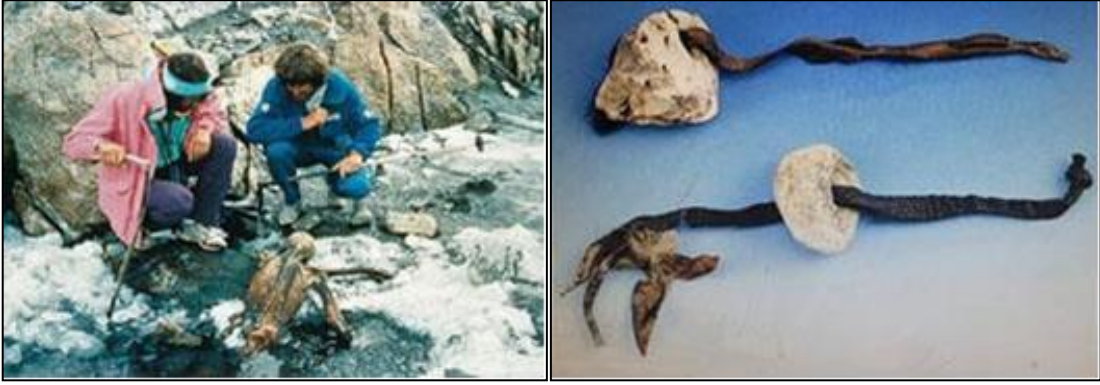
Şekil 6. Buz Adam Otzi, Alp Dağları (Ertuğrul, 2014)