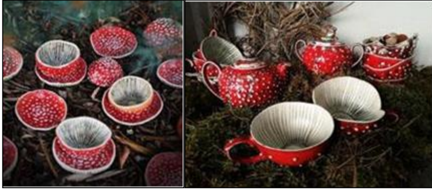
Şekil 25. M.Wondersmith çay takımı (Snootyfoxfashion, 2024)

Sadece Amanita Muscaria değil, diğer türler de sanatçıların ilgi odağıdır. Farklı türlerde mantarların form ve renklerini eserlerine taşıyan Fransız sanatçı Stephan Kilgast doğa duyarlılığına sahip çağdaş sanatçılardandır. Kullanılmış, çöpe atılmış atık malzemelerden faydalanan sanatçıyı heyecanlandıran ve çalışmalarında öne çıkardığı formlar mantar formlarıdır (Şekil 26-27). Sanatçı doğaya karşı hassasiyetini şu sözlerle dile getirmiştir.