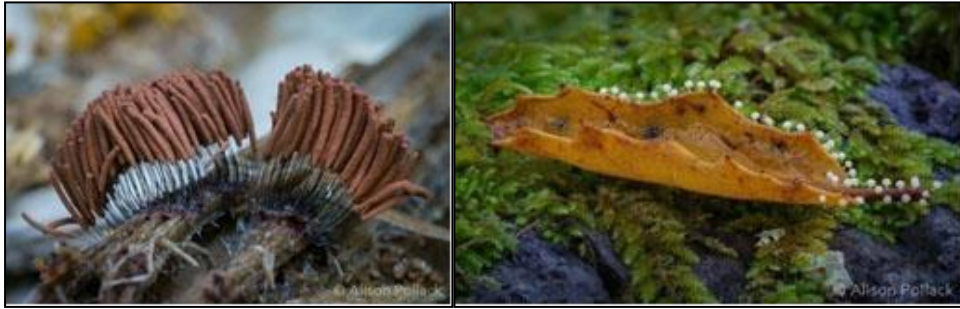
Şekil 28. Alison Pollack, Stemonitis (Marin_mushrooms, 2023)

Pollack'ın fotoğrafları gözle görülmesi mümkün olmayan, mikroskobik özellikler taşıyan mikro mantarların her ayrıntısını izleyiciye sunmaktadır (Şekil 28-29). Pollack amacının insanların normal şartlarda görmesi mümkün olmayan mantar yapılarını görmelerini, fark etmelerini sağlamak olduğunu dile getirmiştir (Madeline Island School of the Arts, 2022).