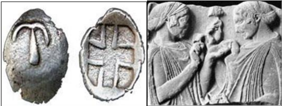
Şekil 12. M.Ö. 480-380, gümüş paralar (Ancient Psychedelia, 2019b)

Şekil 13'te Demeter ve Persephone olduğu düşünülen iki mitolojik figür ellerinde Psilocybe Semilanceata olduğu tahmin edilen, halüsinojenik özellikler taşıyan bir mantar ile tasvir edilmiştir. 56,5 cm yüksekliğe ve 67 cm genişliğe sahip bu rölyef Elenius Tapınağı'nda bulunmuştur, Louvre Müzesi'nde sergilenmektedir.