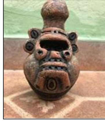
Şekil 21. Seramik kap, Taino, Mantar Tanrısı (Ancient Psychedelia, 2019d)

Prehistorik dönem ve antik dönem sanatlarında mantar formundan esinlenen, mantar formlarını betimleyen eserlerden örnekler daha da çoğaltılabilir.