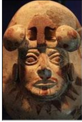
Şekil 20. Seramik kap, MS 100-600 (Makra, 2015)