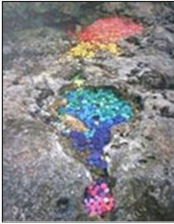
Şekil 1. Alejandro Duran, Akıntı, 2010 (Brown, 2014)

Alejandro Duran'ın "Akıntı" isimli çalışması (Şekil 1), Joseph Beuys'un "7000 Meşesi" (Şekil 2), Mel Chin'in "Canlanma Alanı" (Şekil 3) isimli çalışması, doğa üzerinde gerçekleştirilen ve doğanın ev sahipliği yaptığı çalışmalardır. Hans Haacke'nin "Ot Büyür" ve Vaghn Bellin'in "Yeşil Köy" (Şekil 4) isimli çalışmaları ise galeri içerisinde doğayı ve izleyiciyi dahil ettikleri örneklerdir.