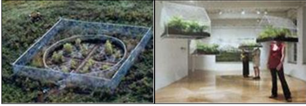
Şekil 3. Mel Chin, Canlanma Alanı, (Chin, t.y.)