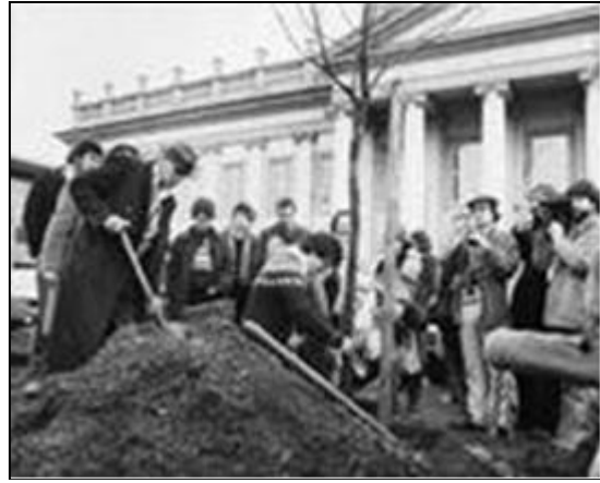
Şekil 2. Josep Beuys, 7000 Meşe, 1982 (AWA Tree Consultants, 2019)