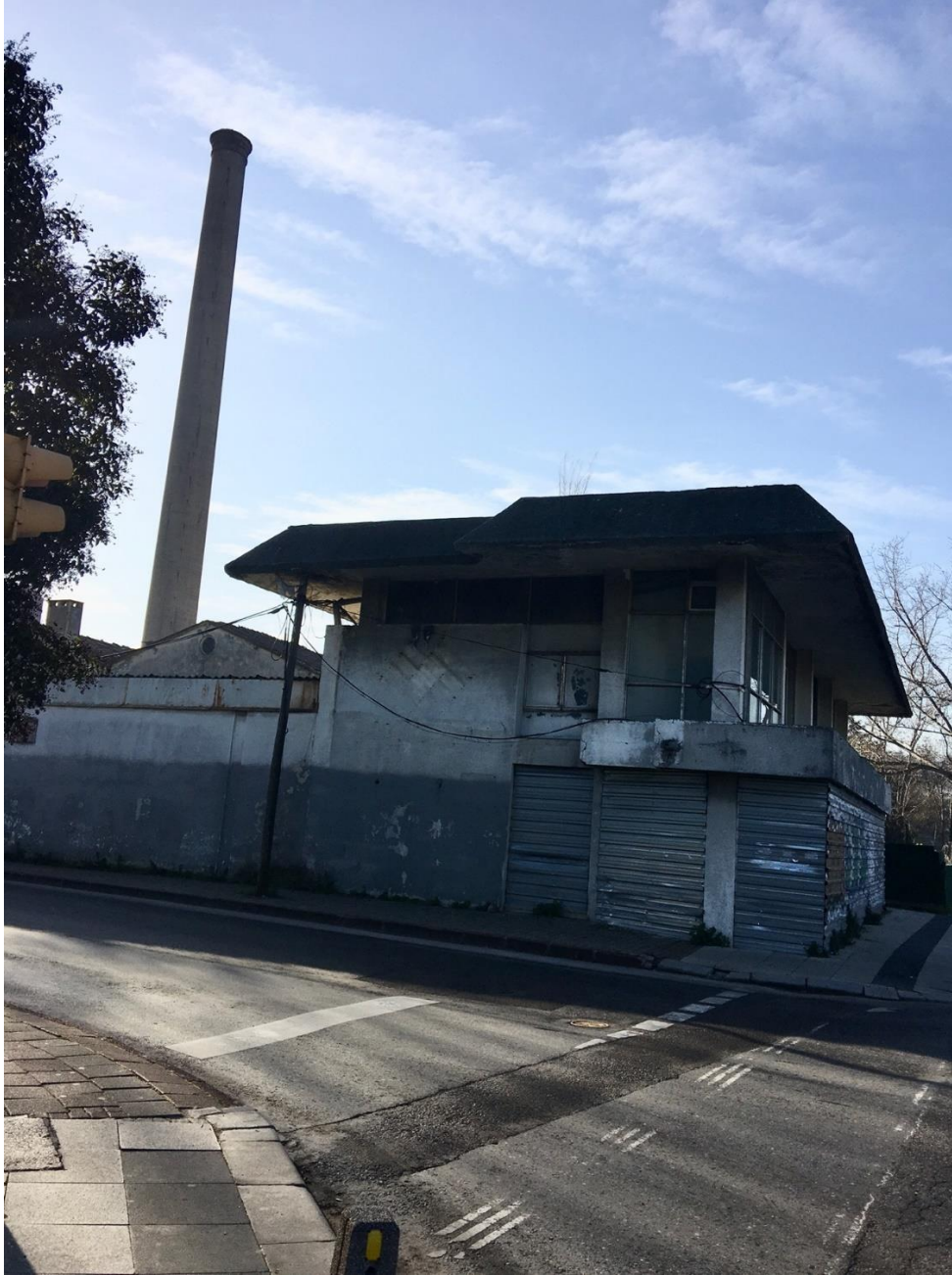
Bugünkü haliyle Paşabahçe Cam Fabrikası.

Türkiye'nin nitelikli iş gücü odaklı ekonomi tarihinin bir parçasıdır. Özetle, Paşabahçe Cam Fabrikası, kuruluşundan kapanışına değin uzanan yılların ekonomiden sanata, tasarımdan emek tarihine uzanan bir'den çok alanda hafıza katmanları olan bir palimpsest gibidir. Bugün bakıldığında ise, bir palimpsest gibi pek çok hafıza katmanlarına sahip olan Paşabahçe Cam Fabrikası'nın yıkıma terk edildiği görülmektedir. Basında tesis arazisinde var olan yapıların yıkılıp yerine otel yapılacağına ilişkin doğrulanma şansı olmayan sansasyonel bilgiler yer almaktadır. Başta Mimarlar Odası olmak üzere buranın kültür mirası olarak tescillenmesi talepleri karşısında da herhangi bir kurumdan açıklama gelmemiş, girişimde bulunulmamıştır.