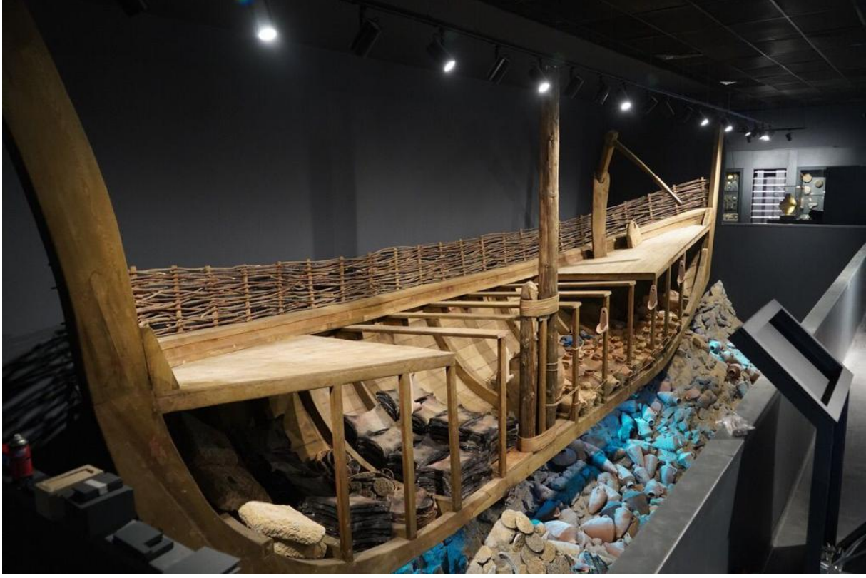
Bodrum Sualtı Müzesi Serçe Limanı Batığı https://muze.gov.tr/muze-detay?DistId=BSA&SectionId=BSA05 (Erişim: 10.04.2024)