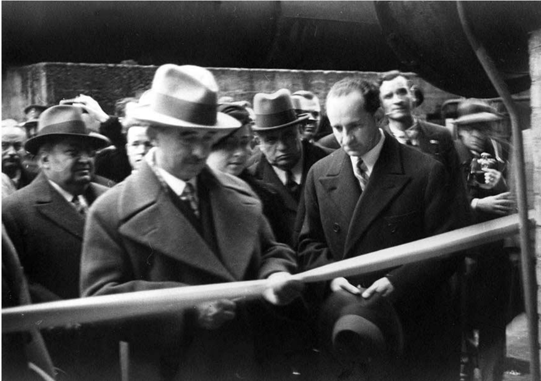
İsmet İnönü Paşabahçe Cam Fabrikasının açılışını yapıyor

Paşabahçe Cam Fabrikası Beykoz'un Paşabahçe semtinde 29 Kasım 1935 tarihinde Başbakan İsmet İnönü tarafından hizmete açılır.