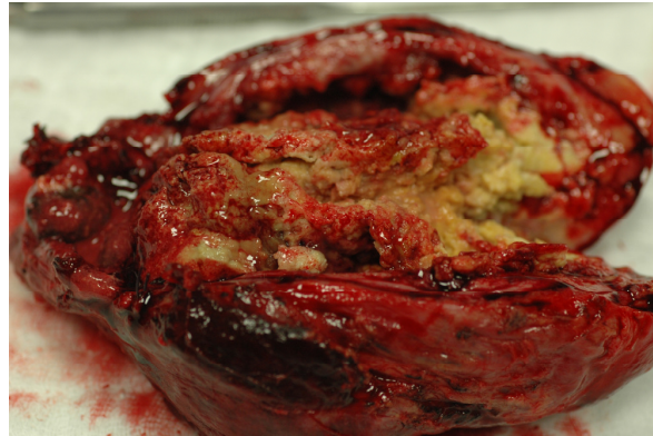
Şekil 3. Longitüdinale olarak safra kesesinin açılmış hali. Safra çamuru ve kalınlaşmış safra kesesi duvarı görülmekte.