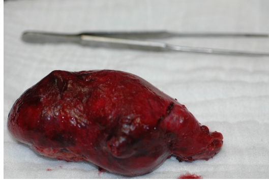
Şekil 1. Safra kesesinin kolesistektomi yapılmadan önceki intraoperatif gözlemi. Safra kesesinin çevre dokulara invaze olmadığı görülmekte.

nekleme sonucu endometritis olarak rapor edildi. Bu bulgularla, pelvik kitle ön tanısıyla operasyon kararı verildi. Laparotomik gözlemede her iki overde preoperatif dönemde saptanmış olan kiteller teyit edildi. Bunun dışında diğer iç genitaler normal olarak değerlendirildi. Tip 1 histerektomi ve bilateral salpingo-ooforektomi yapıldı. İntraoperatif patoloji konsültasyon sonucu primeri belli olmayan metastatik adenokarsinom olarak rapor edildi. Batın eksplorasyonunda safra kesesinin sert, fiks olduğu saptandı. Di-