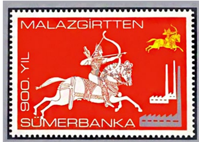
Görsel 6. Sümerbank-Malazgirt Zaferi 900. Yıl başlıklı tebrik kartı 10x15 cm.

Görsel 6'da Sümerbank-Malazgirt Zaferi 900. Yıl başlığıyla tasarlanan ve emisyon programı içerisinde görünmeyen bir adet tebrik kartına yer verilmiştir (Fotokart, t.y). Yatay bir forma sahip olan bu tasarımda illüstratif bir biçimde Malazgirt Zaferinin 900. Yılı anısına bastırılan 2.50 ETL bedeli pulun ekslibrisi çalışma alanına yerleştirilmiştir. Tasarımın yaklaşık \frac{1}{3} 'ü tipografik unsurlarla çevrelenmiştir. Yazı ve rakamlardaki vurguyu arttırma için kırmızı zemin rengi üzerine beyaz yazı stilinde yıl dönümünü vurgulayan ifadeler yazılarak al bayrak vurgusu yapılmıştır. Yine tasarımdaki tarihî öneme atıfta bulunmak için arka plandaki atlı asker figürü altın sarısı renk tonu ile betimlenmiştir. Puldaki görsel betimlemeler aynı kalmak koşuluyla tasarımın üst kısmına büyük harflerle Malazgirt'ten ifadesi, alt kısmına Sümerbank'a ibaresi, sol kısmına aşağıdan yukarıya doğru 900. yıl ifadesi, sağına ise ikisi beyaz diğeri gri renk tonunda olmak üzere üç adet fabrika illüstrasyonu konumlandırılmıştır. Yine siyah zemin rengi üzerine tasvir edilen pul için puldan bağımsız bir biçimde gri renkte bir marj alanı oluşturulmuştur.