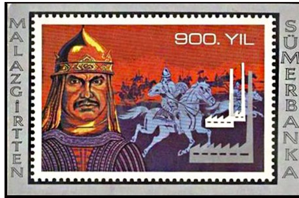
Görsel 5. Malazgirt Zaferi'nin 900. Yılı ve Alparslan başlıklı tebrik kartı 52x36 mm.

Görsel 5'te Malazgirt Zaferinin 900. Yılı ve Alparslan başlığıyla tasarlanan ve emisyon programı içerisinde görünmeyen bir adet tebrik kartına yer verilmiştir (Bit Mezat, 2024). Yatay bir forma sahip olan bu tasarımda illüstratif bir biçimde Malazgirt Zaferinin 900. Yılı anısına bastırılan 1.00 ETL bedeli pulun ekslibrisi çalışma alanına yerleştirilmiştir. Puldaki görsel betimlemeler aynı kalmak koşuluyla tasarımın sağ üst kısmına 900. yıl ifadesi hemen altına ise ikisi beyaz diğeri gri renk tonunda olmak üzere üç adet fabrika illüstrasyonu konumlandırılmıştır. Pulun üzerine anma yıl dönümünü belirten sadece bir adet tipografik unsur yerleştirilmiş ve kompozisyonun bütünü illüstrasyonla anlatılmaya çalışılmıştır. Ayrıca siyah zemin rengi üzerine tasvir edilen pul için puldan bağımsız bir biçimde gri renkte bir marj alanı oluşturulmuştur. Oluşturulan marjın sol kısmına yukarıdan aşağıya doğru büyük harflerle Malazgirt'ten ifadesi yazılmışken sağ kısmına yine yukarıdan aşağıya doğru Sümerbank'a ifadesi yazılmıştır.