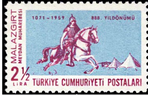
Görsel 1. Malazgirt Meydan Muharebesi'nin 888. Yıl Dönümü başlıklı anma pulu 41x26 mm.