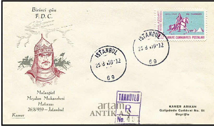
Görsel 2. Malazgirt Meydan Muharebesi'nin 888. Yıl Dönümü başlıklı ilk gün zarfı 41x26 mm.