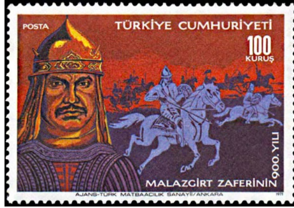
Görsel 3. Malazgirt Zaferi'nin 900. Yılı başlıklı anma pulu 52x36 mm.

konumlandırılmıştır. Pulun basım tarihi ve basımevi bilgisine ise alt kısımda kalan marj alanında yer verilmiştir.