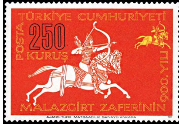
Görsel 4. Malazgirt Zaferi'nin 900. Yılı başlıklı anma pulu 52x36 mm.

Görsel 5'te Malazgirt Zaferinin 900. Yılı ve Alparslan başlığıyla tasarlanan ve emisyon programı içerisinde görünmeyen bir adet tebrik kartına yer verilmiştir (Bit Mezat, 2024). Yatay bir forma sahip olan bu tasarımda illüstratif bir biçimde Malazgirt Zaferinin 900. Yılı anısına bastırılan 1.00 ETL bedeli pulun ekslibrisi çalışma alanına yerleştirilmiştir. Puldaki görsel betimlemeler aynı kalmak koşuluyla tasarımın sağ üst kısmına 900. yıl ifadesi hemen altına ise ikisi beyaz diğeri gri renk tonunda olmak üzere üç adet fabrika illüstrasyonu konumlandırılmıştır. Pulun üzerine anma yıl dönümünü belirten sadece bir adet tipografik unsur yerleştirilmiş ve kompozisyonun bütünü illüstrasyonla anlatılmaya çalışılmıştır. Ayrıca siyah zemin rengi üzerine tasvir edilen pul için puldan bağımsız bir biçimde gri renkte bir marj alanı oluşturulmuştur. Oluşturulan marjın sol kısmına yukarıdan aşağıya doğru büyük harflerle Malazgirt'ten ifadesi yazılmışken sağ kısmına yine yukarıdan aşağıya doğru Sümerbank'a ifadesi yazılmıştır.