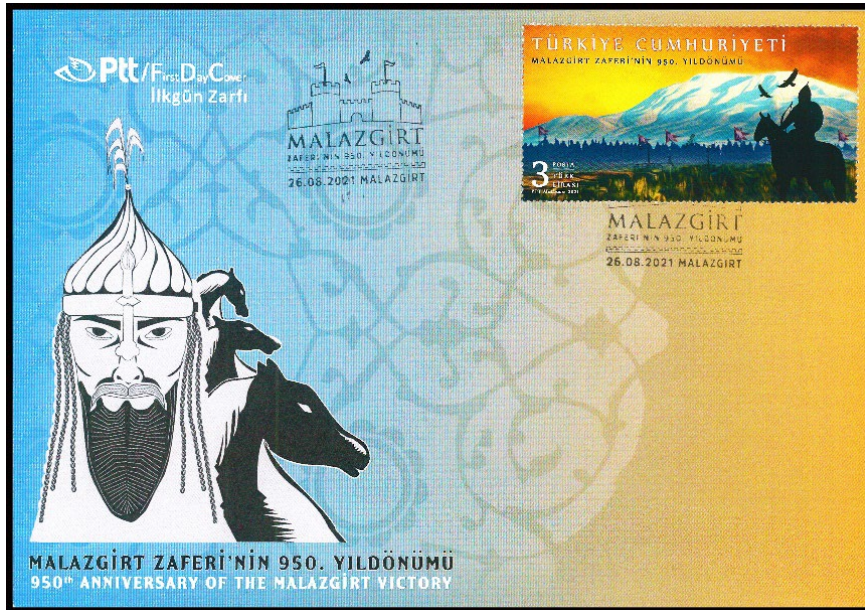
Görsel 9. Malazgirt Zaferi'nin 950. Yıl Dönümü başlıklı ilk gün zarfı 200x140 mm.

ikiye bölünmesiyle ortaya çıkan on iki kollu yıldız motifinin Anadolu Selçuklu dönemi ile Beylikler Dönemi'ndeki mimarî eserin birçoğunda ve bunların parçalarında yaygın olarak kullanıldığı bilinmektedir. Buna göre geometrik motiflerin devamlılık, sınırsızlık, sonsuzluk gibi anlamları bulunmakla birlikte bu motiflerin İslamiyet'in kabulüyle birlikte İslam sanatında Allah'ı ifade etmek için kullanıldığı düşünülmektedir (Sönmeztürk, İşbilir ve Göçer, 2022: 50-57). Benzer soyutlamaların figürün sakal ve miğfer saçaklarına uygulandığı da görülmektedir. Bu tasarımda formun solundaki beyaz zemin üzerine Sultan Alparslan betimlemesi yerleştirilmiş ve Malazgirt Meydan Muharebesi sırasında önemli işlerde kullanılan atlar figürün hemen arkasına sıralanmıştır. Sultan Alparslan'ın portresini ön plana çıkarmak için arka fondaki atlara siyah renk uygulanmıştır. Sultan Alparslan figürünün üst kısmına tasarımın ilk gün zarfı olduğunu belirten ifadenin Türkçe ve İngilizce karşılıkları yerleştirilmişken alt kısmına anma yıl dönümü ifadesinin Türkçe ve İngilizce karşılıkları yerleştirilmiştir. Görüldüğü üzere hem ilk gün zarfının hem de anma pulunun üzeri içeriğe uygun olarak üretilen kale temalı bir filatelik damga ile mühürlenmiştir.