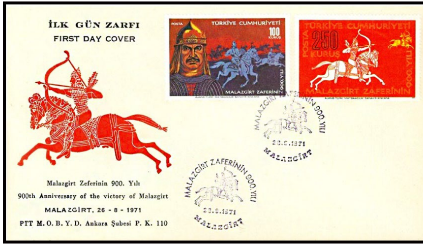
Görsel 7. Malazgirt Zaferinin 900. Yılı başlıklı ilk gün zarfı.

olduğu ve elindeki ok ile belirli bir hedefe odaklandığı görülmektedir. Bu figürün üstüne tasarımın ilk gün zarfı olduğunu belirten ifadenin Türkçe ve İngilizce karşılıkları konumlandırılmışken alt kısmına illüstratif olarak tasarımın amacı, tarihi ve künye bilgileri konumlandırılmıştır. İlgili tarihte yayımlanmış diğer çalışmalardan farklı olan bu tasarım PTT Meslek Okulları Birliği Yardımlaşma Derneği Ankara Şubesi adına hazırlatılarak dolaşıma sunulmuştur. Görüldüğü üzere hem ilk gün zarfının hem de anma pullarının üzeri Selçuklu askeri figürlü filatelik bir damga ile mühürlenmiştir.