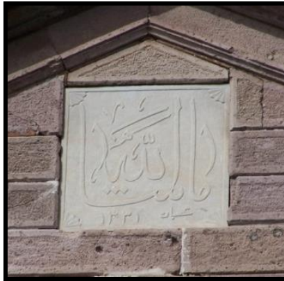
Resim 15: Kemahlı Han'ın nazarlığı.

İzmir'deki Maşallah nazarlıklarının bir grubunu da dikdörtgen panolular oluşturmaktadır. Çoğunlukla taş malzeme üzerinde kabartma tekniği ile oluşturulan bu nazarlıkların alçı malzemeli örnekleride mevcuttur. Bu grupta genellikle "ما شاء الله" ibaresinin "ماشا" ve "الله" olarak bölündüğü, "ماشا" yazımı sırasında "پس" harfinin kuyruğunun uzatılarak "ا" harfine bağlandığı, bu aradaki uzantının üzerine de "الله" kelimesinin yerleştirildiği görülmektedir. Dikdörtgen panolu nazarlıkların saptanan tüm örneklerinde binanın inşa tarihine ilişkin rakamların yazıldığı görülmüştür. Kemahlı Han'ın üçgen alınlığı ortasında bulunan kitabede (Resim 15) 1331/1912-13, Kemeraltı Kentsel Sit Alanı'ndaki konutlardan birinde (Resim 16) 1319/1901-2, diğesinde ise (Resim 17) 1287/1870-71 tarihleri okunmaktadır. Dikdörtgen formlu panolara hareketlilik kazandırmak amacıyla levhaların ince bir silme ile kuşatılarak köşelerinin iç kısmında çeşitli stilize bitkisel öğelerin kullanıldığı dikkati çekmektedir. Kemeraltı Kentsel Sit Alanı içerisindeki bir konutun alçı nazarlık panosunda ise "ما" harflerinin içine gelecek şekilde "شا" harfleri istiflenmiş, "الله" kelimesi harflerin uzantıları arasında oluşan boşluğa yerleştirilmiştir. Harfler arasında ve panonun çerçevesi arasında oluşan boş yüzeyler ise lale, gül gibi çeşitli çiçeklerle hareketlendirilerek panonun etrafını çevreleyen stilize akant yapraklarına uyumu sağlanmıştır.