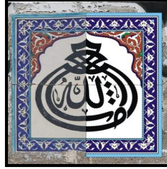
Resim 11: "Maşallah" ibaresinin dört karoda yer aldığı nazarlık örneği.

Damla formulu Maşallah nazarlıklarımadeni ürünlerde de örneklerini vermiştir. İkiçeşmelik 773 Sokak'taki bir konutun bahçesindeki kamelya üzerinden sarkıtılan damla formulu bir nazarlık dikkati çekmektedir (Resim 12, Şekil 1). Dökme demir tekniği ile yapılan nazarlıkta yer yer çivi/vida kullanılması, önde yer alan yazılı bölüm ile arkadaki damla şekilli süslemesiz demir plakanın vidalanarak birleştirildiğini göstermektedir. "ماشاءالله" ibaresindeki "م" ve "پش" harflerinin uzantıları ile oluşturulan damla formu içerisine diğer harflerin istiflenmiş olduğu nazarlığın alt kısmına 1314/1896-97 tarihi işlenmiştir. Dökme demir tekniği ile yapılan bu nazarlık için hazırlanan kalıpla daha birçok örnek üretildiği akla gelsede, bunların paslanması, çabuk yer değiştirilebilen öğeler olması gibi sebepler büyük bir kısmının günümüze ulaşamamasına neden olmuştur. Kaldı ki araştırma yapılan tarihlerde fotoğrafı çekilen bu Maşallah nazarlığı bir sonraki araştırmamız sırasında yerinde görülemedi.