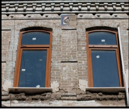
Resim 1: İki pencere arasındaki nazarlık.