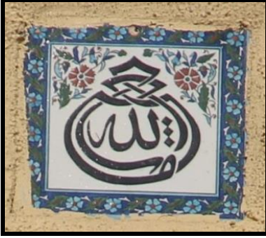
Resim 10: "Maşallah" ibaresinin tek karoda yer aldığı nazarlık örneği.