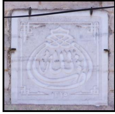
Resim 7: Kemeraltı'nda bir konutta nazarlık.

Damla formu nazarlıklar sıva ya da alçı malzeme üzerine kalem işi tekniğinde de örneklerini vermiştir. Sıvanın yağmur, rüzgar gibi doğa olaylarından olumsuz etkilenmesi ya da kullanıcıların istekleri doğrultusunda üzerinin farklı renklerle boyanması sonucu kalem işi teknikli nazarlıkların büyük bir kısmı günümüze ulaşamamıştır. Genellikle Namazgâh, Pazaryeri, Tilkilik gibi Türk yerleşimlerinin yoğun olduğu alanlardaki konutların dış cephelerinde yer verilen bu teknikli nazarlıklarda siyah, kırmızı, krem gibi renkler hâkimdir. Arap harfleri ile yazılan "Maşallah" ibaresi çoğunlukla siyah renk ile verilmekte, damla motifinin içi ise çoğunlukla beyaza boyanmaktadır. Renkler ne olursa olsun damla formunun oluşturulmasında "م" ve "پس" harflerinin uzantıları ya Mirkelamoğlu Hanı (XVIII. yüzyıl son çeyreği) (Ersoy 1991: 35) saçığının içbükey kavisi üzerindeki gibi tek (Resim 8) ya da Namazgâh'taki bir konutun alçı madalyonu üzerinde olduğu gibi iç içe geçmiş iki damla formu kullanılmaktadır (Resim 9).