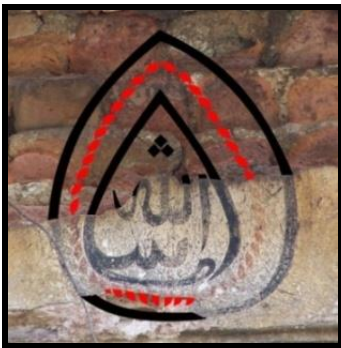
Resim 8: Mirkelamoğlu Hanı saçak altındaki nazarlık.

Damla formu nazarlıklar sıva ya da alçı malzeme üzerine kalem işi tekniğinde de örneklerini vermiştir. Sıvanın yağmur, rüzgar gibi doğa olaylarından olumsuz etkilenmesi ya da kullanıcıların istekleri doğrultusunda üzerinin farklı renklerle boyanması sonucu kalem işi teknikli nazarlıkların büyük bir kısmı günümüze ulaşamamıştır. Genellikle Namazgâh, Pazaryeri, Tilkilik gibi Türk yerleşimlerinin yoğun olduğu alanlardaki konutların dış cephelerinde yer verilen bu teknikli nazarlıklarda siyah, kırmızı, krem gibi renkler hâkimdir. Arap harfleri ile yazılan "Maşallah" ibaresi çoğunlukla siyah renk ile verilmekte, damla motifinin içi ise çoğunlukla beyaza boyanmaktadır. Renkler ne olursa olsun damla formunun oluşturulmasında "م" ve "پس" harflerinin uzantıları ya Mirkelamoğlu Hanı (XVIII. yüzyıl son çeyreği) (Ersoy 1991: 35) saçığının içbükey kavisi üzerindeki gibi tek (Resim 8) ya da Namazgâh'taki bir konutun alçı madalyonu üzerinde olduğu gibi iç içe geçmiş iki damla formu kullanılmaktadır (Resim 9).