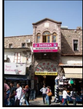
Resim 2: Kemahlı Han'ın üçgen alınlığındaki nazarlık.