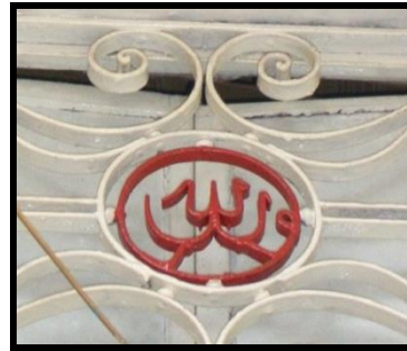
Resim 14: Yuvarlak formlu, metal malzemeli nazarlık örnekleri.