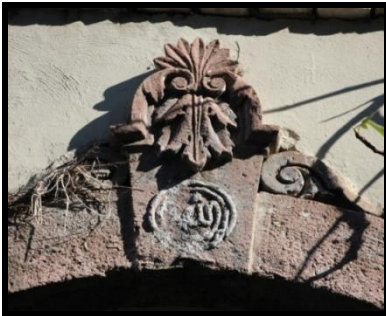
Resim 13: Yuvarlak formlu, taş malzemeli nazarlık örnekleri.

Maşallah nazarlıklarında kullanılan diğer bir form da dairedir . Bu formdaki nazarlıkların örnekleri taş (Resim 13) ve metal malzemelerde (Resim 14) saptanmıştır. Yuvarlak formlu nazarlıklarda da genel düzenleme damla formlu olanlarla benzerdir. Bu formda da "ماشاءالله" ibaresindeki "م" ve "ش" harflerinin uzantıları ya iç içe geçmiş ya tek ya da iki daire oluşturmuş, geriye kalan harfler bu formun içine istiflenmiştir. Taş üzerinde kabartma tekniği kullanılarak hazırlanan yuvarlak formlu nazarlıkların saptanabilen tüm örnekleri yapılara girişi sağlayan yuvarlak kemerli açıklıkların ortasında kullanılmıştır. Metal malzeme ile yuvarlak form verilerek yapılan nazarlık örneğine ise Kemeraltı Kentsel Sit Alanı içerisindeki bir konutta rastlanılmıştır. Kapı üstü aydınlık penceresinin "C" ve "S" kıvrımlarıyla süslenmiş ferforje parmaklığı ortasında yer verilen bu nazarlıkta dövme demir tekniği ile şekillendirilen harfler birbirlerine kaynak yapılarak bağlanmıştır. Parmaklığın ortasında küçük bir madalyon varmış izlenimi yaratan bu nazarlık kırmızı renkle boyanarak dikkat çekici bir görünüme kavuşmuştur.