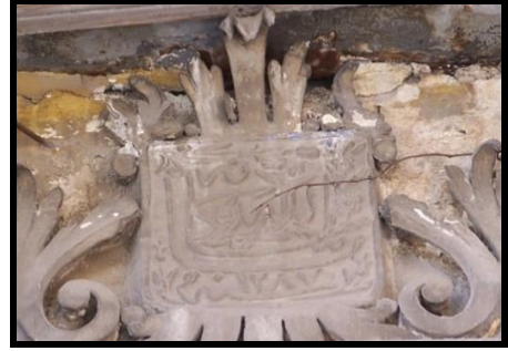
Resim 16-17: Kemeraltı Kentsel Sit Alanındaki konutlardan dikkörtgen formlu nazarlık örnekleri.

Kayseri Şeyh İbrahim Tennuri Çeşmesi (1482) (Özbek ve Arslan 2008: 671), Isparta'da 1859-60 tarihli bir konutta (Urfaloğlu 2010: katalogno 91) benzer formda nazarlık örnekleri bulunmaktadır.