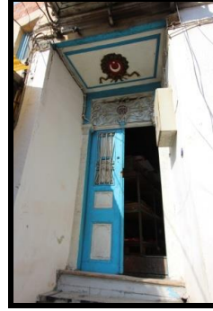
Resim 4: Kapı üstü penceresinin korkuluğunda yer verilen nazarlık.