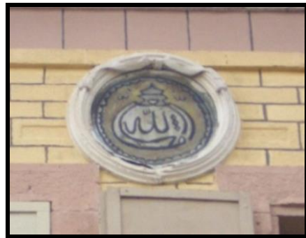
Resim 9: Namazgâh'taki bir konuttan nazarlık örneği.