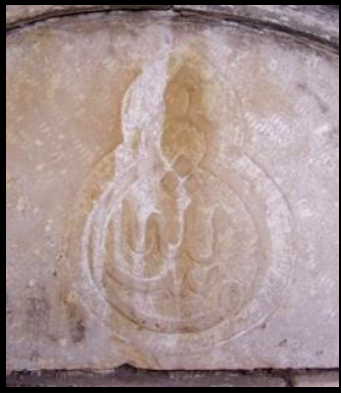
Resim 6: Mirkelamoğlu Hanı Çeşmesi'nin nazarlığı.