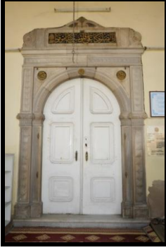
Resim 3: Ali Ağa Camii harim giriş kapısının yuvarlak kemiği ortasındaki kilit taşı üzerinde bulunan nazarlık.