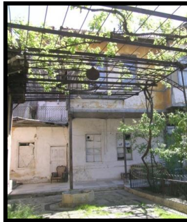
Resim 5: Bahçedeki ferforje kamelyadan sarkıtılan nazarlık.