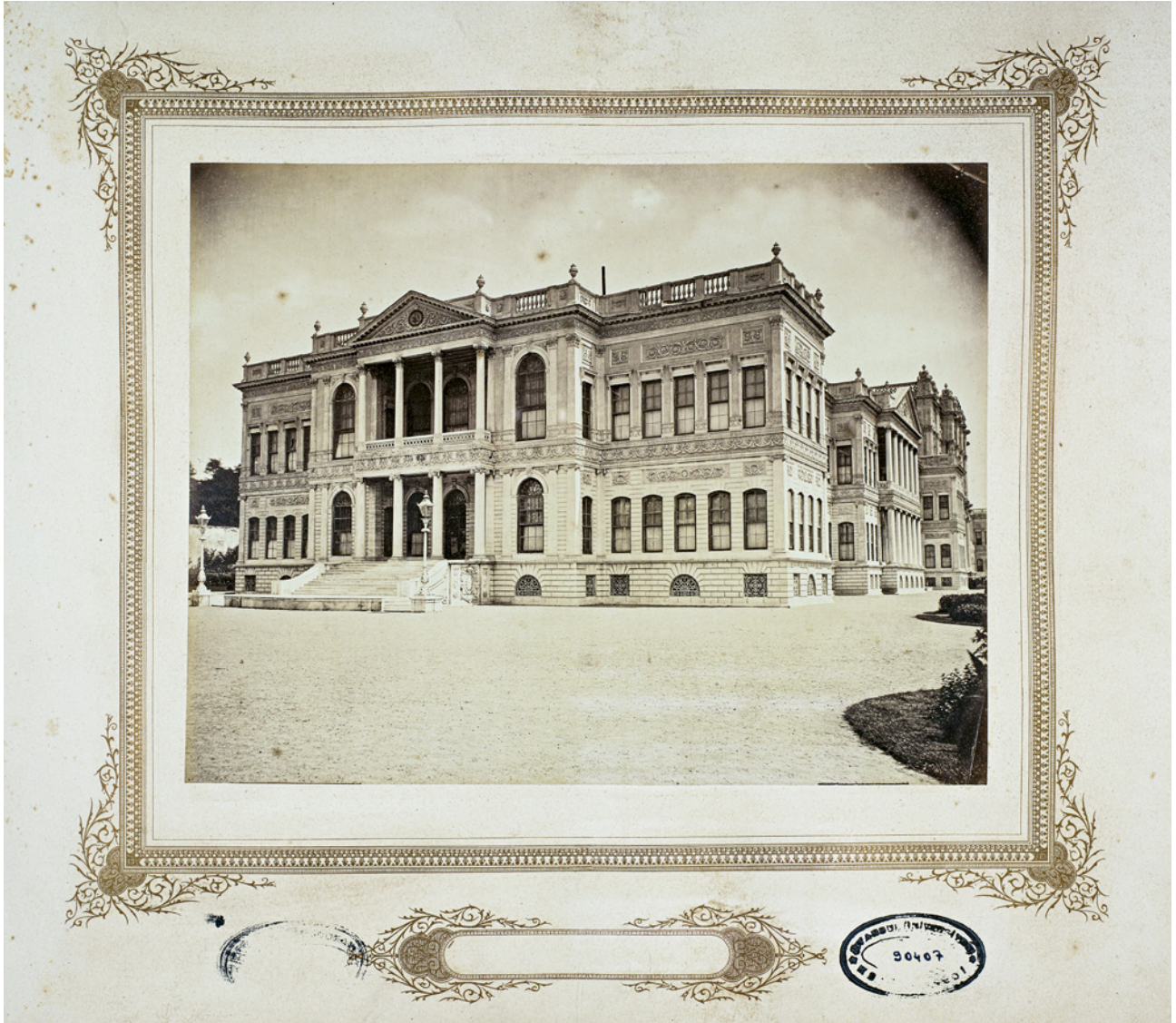
15 Basile Kargopoulo, Dolmabahçe Sarayı , Sultan II. Abdülhamid Kütüphanesi Koleksiyonu, Env. No. YSKH. YA. 90407/5

Müslümanların da rekabet ortamına girmesiyle renklenmiş ve gelişmiştir. Fotoğrafa hususi bir ilgisi olan Sultan II. Abdülhamid'in döneminde zengin bir arşiv oluşturulmuş, hanedan üyeleri ve devlet adamlarından sıradan halka değin geniş bir kitlenin fotoğrafları çekilmiş, böylece Osmanlı portreleri dünyanın çeşitli yerlerinde sergilenme imkânı bulmuştur. Birbirinden değerli bu kareler, geçmişi aydınlatan birer belge niteliğindedir. Günümüzde bu zengin koleksiyona ait fotoğraflar ve albümler, Millî Saraylar Koleksiyonu'nda yer almaktadır.