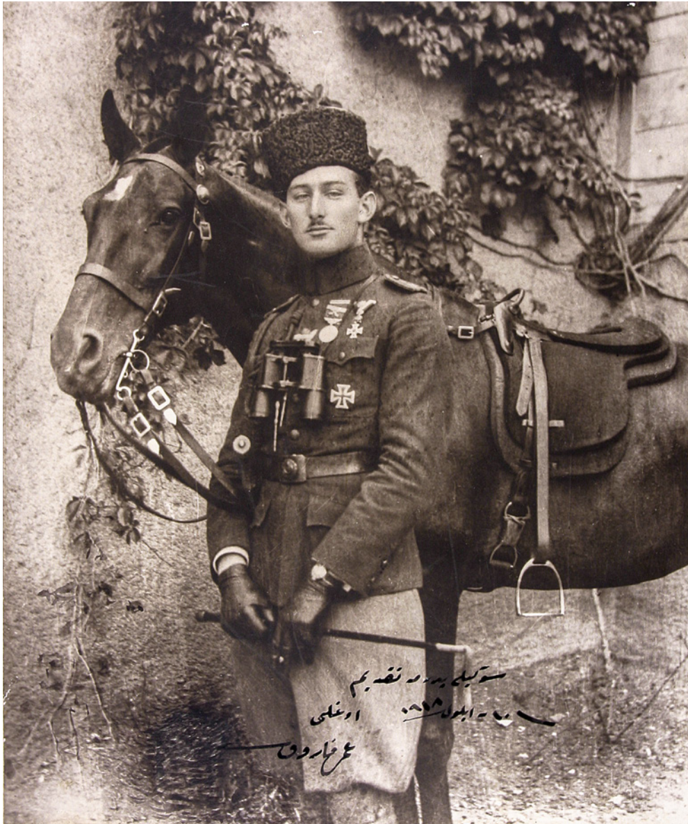
10 Üzerinde "Şevketlü pederime takdim. Oğlu Ömer Faruk, 10 Eylül 1918" yazılıdır, Halife Abdülmecid Efendi Kütüphanesi Koleksiyonu, Env. No. 100/4862

Fotoğrafa büyük ilgi duyan Sultan II. Abdülhamid, Yıldız Sarayı'nı sadece idari bir mekân olarak kullanmayıp kültür ve sanatın da merkezi hâline getirmiştir. Sarayda kurduğu fotoğraf atölyesinde şehzade ve hanım sultanların fotoğraflarını çektirerek hanedan üyeleri portrelerinin oluşmasını sağlamıştır. Çekilen portre fotoğraflarını imzalı ve ithafli olarak hediye etme geleneği, saray içinde ve dışında uzun yıllar boyunca devam etmiştir.