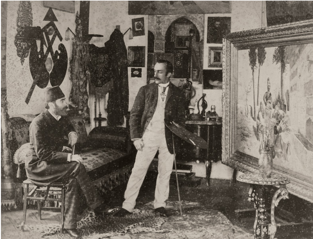
4 Phébus Efendi, Halife Abdülmecid Atölyesinde Resim Yaparken, Env. No. 100/843