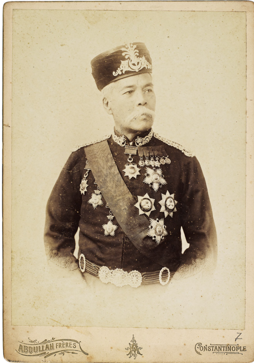
12 Abdullah Frères, Cahor Hâkimi Ebubekir , Sultan II. Abdülhamid Kütüphanesi Koleksiyonu, Env. No. YSKH. YA. 779-86/7

Sultan II. Abdülhamid, Osmanlı Devleti'nin propagandasını yapmak amacıyla 1893 yılında 51 fotoğraf albümünü Amerikadaki National Library'ye, 47 fotoğraf albümünü de İngiltere'deki British Museum'a göndermiştir. 9