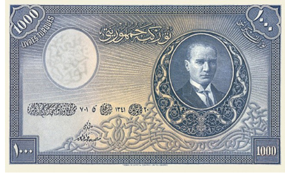
5 Birinci Emisyon Grubu'ndan 1.000'lik banknot, 1927, Türkiye Cumhuriyeti Merkez Bankası Sanal Müze

Atatürk, Alman İmparatoru II. Wilhelm ve Bulgar Kralı Ferdinand gibi liderlerin de fotoğrafını çekmiştir. Fotoğraflarını boyama tekniği ile renklendiren sanatçının 1926 yılında çektiği Atatürk portresi, 1927 yılında basılan kâğıt paraların ön yüzünde yerini almıştır. 6 Birinci Emisyon Grubu banknotlar 5 Aralık 1927 tarihinde dolaşıma çıkarılmıştır. Harf Devrimi'nden önce bastırıldıkları için üzerlerindeki yazılar Osmanlı Türkçesidir.