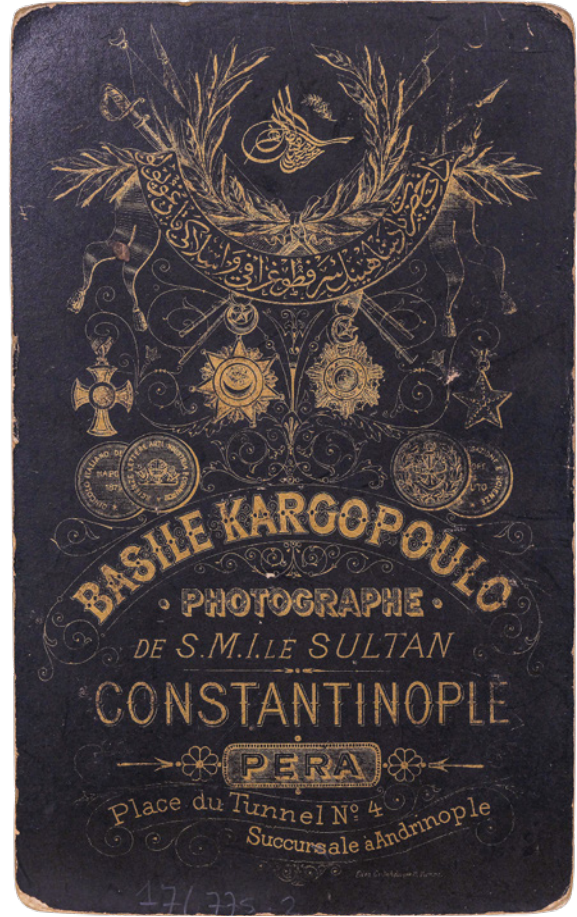
6 Basile Kargopoulo'nun stüdyosuna ait fotoğraf kartı önü ve arkası, Milli Saraylar Fotoğraf Koleksiyonu, Env. No. 121/775.2