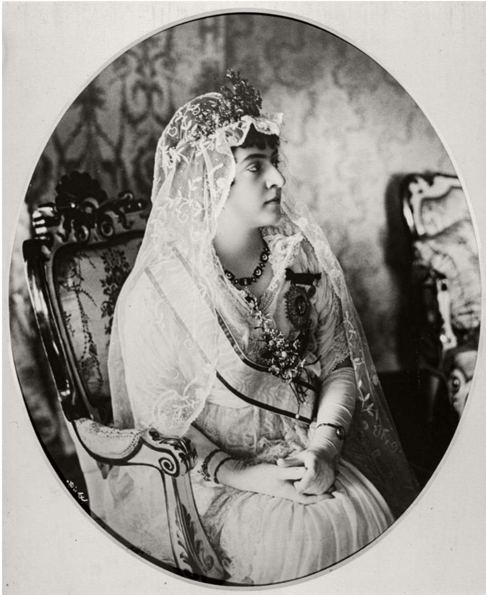
8 Sébah & Joaillier, Adile Sultan , Milli Saraylar Fotoğraf Koleksiyonu, Env. No. 121/588

Adile Sultan'ın 1917'de Avrupa tarzındaki gelinliğiyle verdiği meşhur poz, değişen kültürün göstergesi açısından da önemli bir belgedir. Bu fotoğrafla Osmanlı sarayında hanedanın rengi olan kırmızının yerine beyaz gelinliğin tercih edildiği ve dantel duvağın kullanılmaya başlandığı görülmektedir.