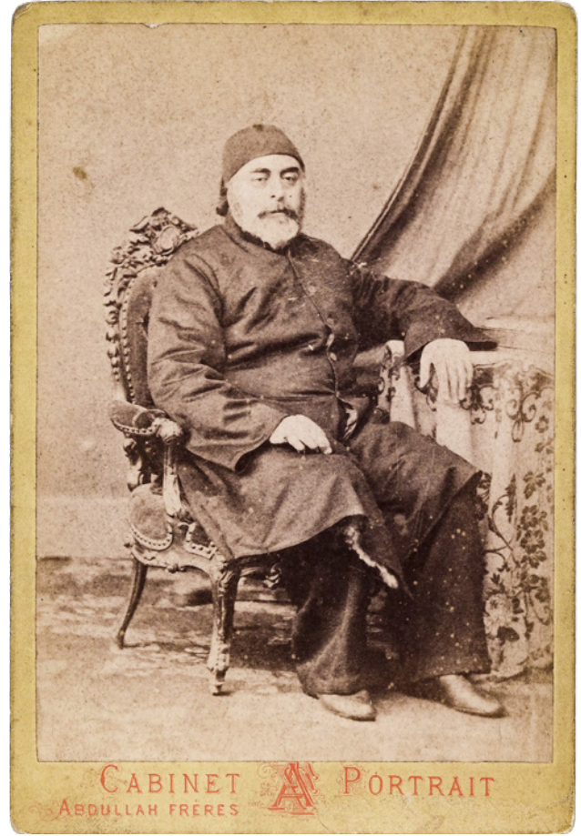
2 Abdullah Frères'in stüdyosuna ait fotoğraf kartı, Millî Saraylar Fotoğraf Koleksiyonu, Env. No. 121/775.9

Başlangıçta sade bir fon önünde çekilen portre fotoğrafları zamanla aksesuar ve dekor kullanımıyla zenginlik kazanmıştır. En sık kullanılan poz bir sandalyeye oturma veya yaslanma olurken, en sık kullanılan aksesuarlar ise kitap, nargile ve silahlar olmuştur. Mesleği ortaya koyan kıyafetlerle verilen bu pozlarda genellikle ciddi ifadeler görülmektedir. Günümüzle mukayese ettiğimizde, o dönemde fotoğraf çekimiyle henüz tanışan insanların her bir poza büyük önem verdikleri ve bu yeni buluşa ciddi bir yaklaşım gösterdikleri anlaşılmaktadır.