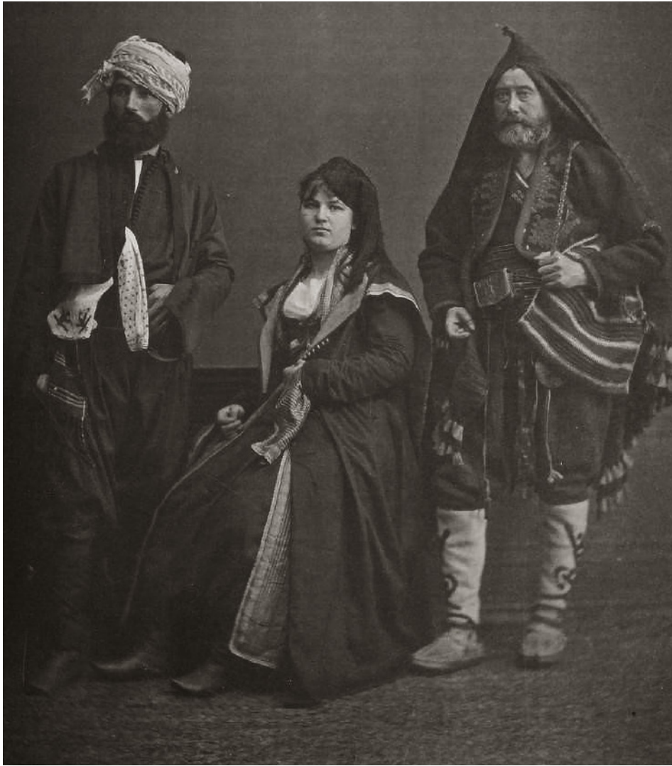
7 Bosna Vilayeti Halkı (Osman Hamdi Bey, Victor Marie de Launay, Les costumes populaires de la Turquie en 1873 , İstanbul: The Levant Times and Shipping Gazette Press, 1873)

27,5 x 37 cm boyutlarında ve 370 sayfa olarak hazırlanan albüm, Sébah'ın atölyelerinde phototype metodu ile basılmış olup 20 x 36 cm boyutunda 42 adet fotoğraftan müteşekkildir. 8 Çoğunlukla üçlü figürler hâlinde kadrajlanan insanların hangi yöreden oldukları hem kıyafetleri ve aksesuarlarından hem de duruşlarından net bir şekilde anlaşılmaktadır. Eserin zengin içeriği ve fotoğrafların kalitesi, sanatçının Sultan Abdülaziz tarafından üçüncü dereceden Mecidiye nişanı ile ödüllendirilmesini sağlamıştır.