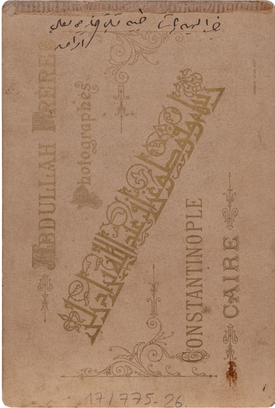
3 Abdullah Frères'in stüdyosuna ait fotoğraf kartı arkası, Millî Saraylar Fotoğraf Koleksiyonu, Env. No. 121/775.26

Fransız İmparatoriçesi Eugénie, Alman İmparatoru II. Wilhelm, Avusturya Kralı Franz Joseph, İran Şahı Nasıreddin, Mısır Hıdivi İsmail Paşa, İtalya Kralı II. Vittorio Emanuele, İngiltere Kralı Edward, Sırbistan Kralı Milan ve Bulgar Prensi