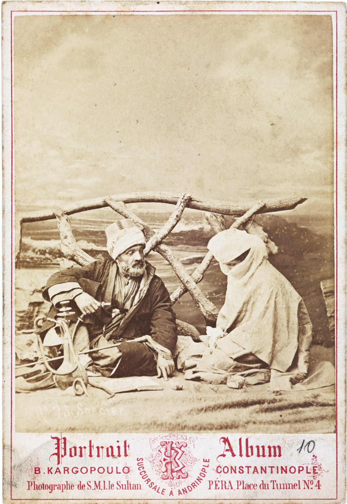
14 Basile Kargopoulos, Sorcier-Büyücü, Sultan II. Abdülhamid Kütüphanesi Koleksiyonu, Env. No. YSKH. YA. 779-29/10