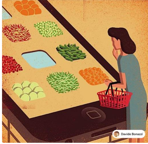
Görsel 7. Davide Bonazzi, kavramsal illüstrasyon örneği.

Davide'in çalışmalarının etki düzeyi yüksek olarak değerlendirilmektedir. Davide'in çalışmalarını büyüleyici kılan şey, dünyadaki en tartışmalı ve acil konulardan bazılarını alıp bunları gerçek sanat eserlerine dönüştürme yeteneğidir. Basit biçim ve doku aracılığıyla derin bir anlatı yaratmanın farklı bir yolu vardır. Bu, yalnız çok az tasarımcının başarabileceği bir durumdur. Belki daha da etkileyici olanı, Davide'in illüstrasyonlarıyla duygusal tepkiler uyandırma yeteneğidir. Yarattığı güzellik yüzey seviyesinden çok daha derin anlamlar içermektedir (Perlman, 2024).