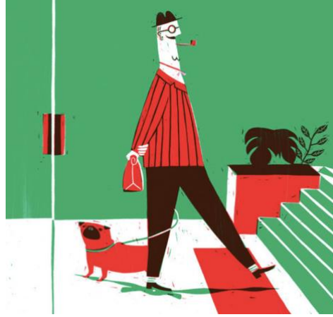
Görsel 5. Catarina Sobral, kavramsal illüstrasyon örneği.

puro'lu karakter merdivenlere doğru ilerlerken, köpeği onun tam zıttı yönünde geriye doğru gitmektedir. İkonografik eksende ele aldığımızda, illüstratif karakterin geçmiş ve gelecek olarak ikileme olduğu ve düşüncelerinde ikililik yaşadığı dile getirilebilir.