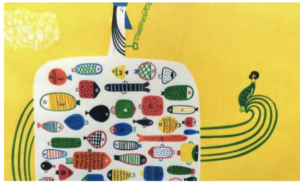
Görsel 4. Catarina Sobral, kavramsal illüstrasyon örneği.

Örneğin; Görsel 4'te yer alan kavramsal illüstrasyonu, ikonografik çözümlene ekseninde ele aldığımızda, tasarımın uzlaşım sal anlamı gereği minimal bir illüstrasyon dili kullanıldığı görülmektedir. Kavramsal olarak sevgi, neşe ve renklilik temasını barındıran illüstrasyonda deniz kızı ve içerisinde pek çok rengarenk balık bulunduran deniz canlısı yer almaktadır. Deniz canlısı deniz kızını kollarıyla sararak ona ne kadar renkli bir yaşam sunabileceğini ve ona olan sevgisini ifade etmektedir. İkon olarak deniz kızı, sabit bir şekilde bekleyerek, onun sözlerine kulak vermekte ve dikkatlice dinlemektedir.