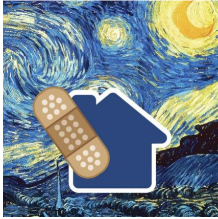
Görsel 3. Kavramsal illüstrasyon örneği, Pandemia, Tevfik Fikret Uçar, 2020.

tasarımsal ikonların anlamlarıyla birlikte, içsel/derinlikli boyut ve kavramlarla entegre edilmesi sonucu ikincil anlamlara ulaşılmaktadır. İmgelerin bileşimi esasen bizi hikayelere ve alegorilere ulaştırmaktadır. Bu düzlemde kavramsal temanın işlenerek alegorilerin saptanması ikonografyanın alanını oluşturmaktadır. Pandemi sürecinde yaşanan tuhaf, korkunç ve yeni günleri imgeler yoluyla aktarma arayışının bir ürünü olan bu çalışmada, görsel tasarımlara günlük notlar ve aforizmalar eşlik etmektedir (gmk.org.tr).