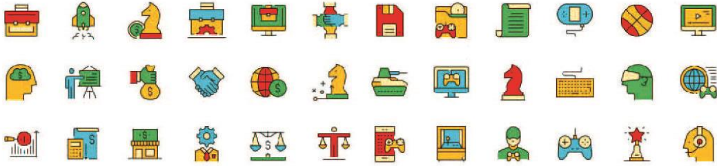
Görsel 2. Resimsel simge, ikon örnekleri.

doğrudan ilişkilidir. Fromm (1997:31)'un ifadesine göre sembol; Başka bir şeyin yerinde duran, onun yerini alan, onu temsil eden şeydir. Bir başka adı simge'dir. Tarih boyunca insanoğlunun bildirişimi sağlamak için yaptığı yoğun çalışmalar, günümüzde semiyotik/göstergebilim adı verilen semboller, simgeler, ikonlar, işaretler ve resimsel simgeler sistemini konu alan bir bilim dalını doğurmuştur (Yazar, 2010:26). İmgenin çözümlenmesi noktasında ikonografi ile ilgili çalışmalar tarih boyunca devam etmiştir. Yaklaşık 300 yıl önce Alman Baron Gottfried Wilhelm Von Leibnitz, bir gün resimsel sembollerden oluşan ve çeviri yapılmadan tüm dillerde okunabilecek evrensel bir dil oluşmasını arzulamıştır (Uçar, 2004:74).