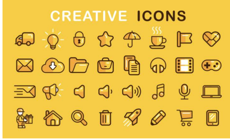
Görsel 8. Yaratıcı İkon örnekleri.

sağlayabilmesi için çeşitli sembollerden ve ikonlardan yararlandığını görmekteyiz. Toplumsal ilişkilerin de düzenlenmesinde etkin bir rolü olan ikonlar, çevreyi anlamamıza, iletişim kurmamıza ve imgeleri amacımız doğrultusunda kullanmamıza olanak sağlarlar (Görsel 7).