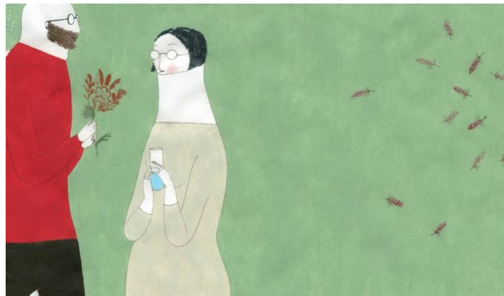
Görsel 6. Elena Odriozola, kavramsal illüstrasyon örneği.

İlk bakışta bir aşk temasının işlendiği Görsel 6'daki kavramsal illüstrasyonda, doğal yeşil soft bir alanda yer alan kadın ve erkek ikonu ile uçan çiçekler yer almaktadır. Görselde elinde çiçekle duran adam ve onun karşısında yer alan bir kadın illüstrasyonu bulunmaktadır. Adam elindeki çiçekleri vermek üzere kadına uzatırken, kadın elindeki su dolu şişe ile bekler pozisyonda görselleştirilmiştir. Burada sevgi teması ikonografik olarak bir kadın ve bir erkek arasında işlenmiştir. Sevgiyi alma ve verme kapasitesinin konu edinildiği ikonlarda illüstratif bir hikaye betimlenmiştir.