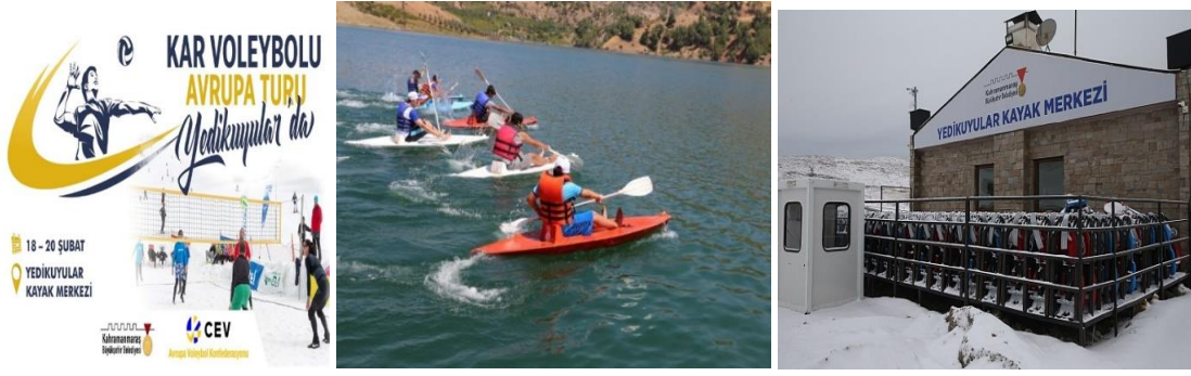
Fotoğraf 2. Yedikuyular kayak merkezi, Menzelet barajı kano yarışları (URL- 11).