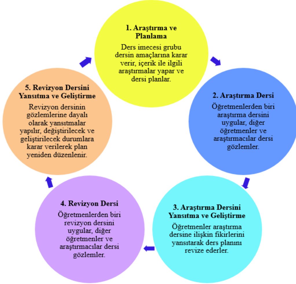
Şekil 1. Çalışmada yararlanılan ders imecesi döngüsü

planın uygulanmasından sonra ise ders gözlemleri doğrultusunda tekrar plan üzerinde tartışmalar yapılarak konuya ilişkin dersin nihai planına ulaşılmaktadır.