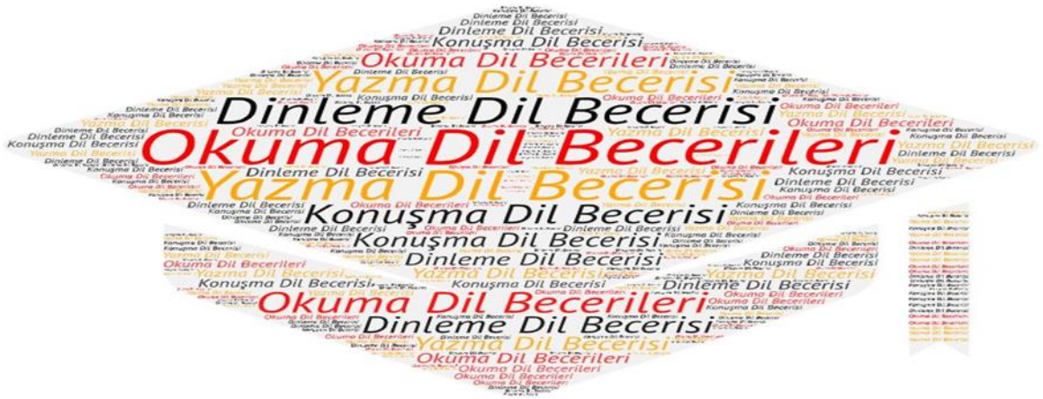
Şekil 1. Öğretmenlerin en çok kullandıkları dil becerisine ilişkin kavram bulutu

Ayrıca öğretmenlerin en çok kullandıkları dil becerisine ilişkin kavram bulutu Şekil 1'de verilmiştir.