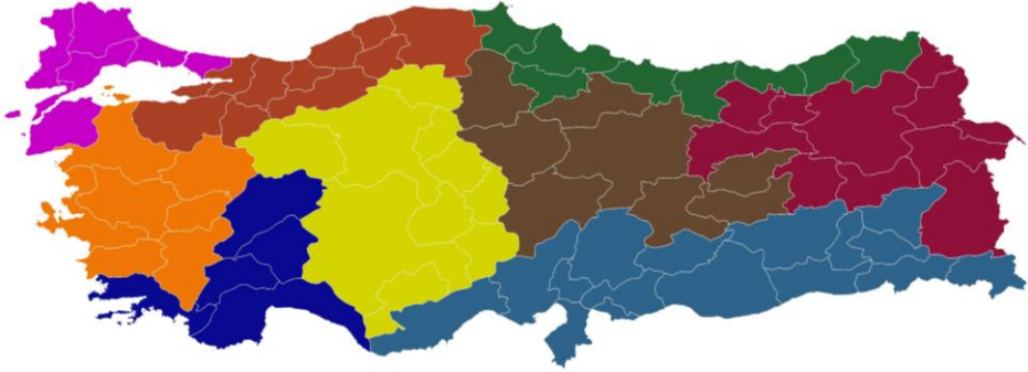
Şekil 1 : 81 İl düzeyinde arama konferansları

Yapılan geniş katılımlı arama konferanslarında, kadınlara yönelik pozitif ayrımcılık amacıyla uygulanan cinsiyet kotası, erkekler için yüzde 20 oranında belirlenmiştir.