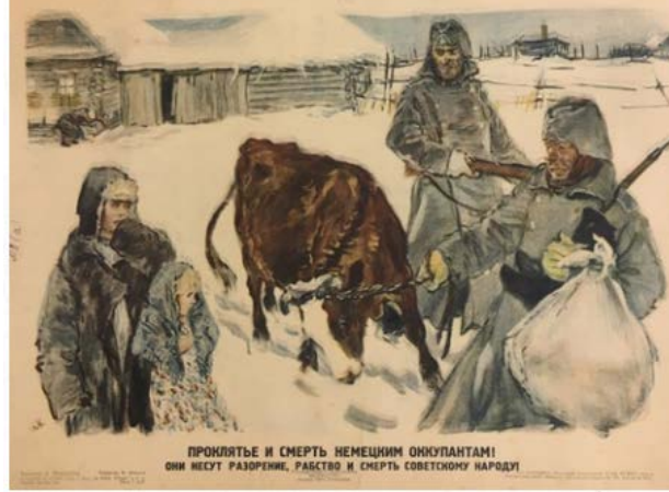
Şekil 6: "Alman İşgalcilere Lanet ve Ölüm! Sovyet Halkına Yıkım, Kölelik ve Ölüm Getiriyorlar!" Adlı Propaganda Posterleri, 1943 12

Anlatımın tözünde propaganda posterinde kadın, çocuk, Alman askerleri, büyükbaş hayvan ve evler yer almaktadır. Anlatımın biçiminde propaganda posterinde sağ tarafta Alman askerleri ellerinde silah ve çuval (muhtemelen gasp edilen eşyalar) varken büyükbaş hayvanı sürüklemeye çalışmakta, sol tarafta ise kadın ve kucağındaki çocuk korkuyla Alman askerlerine doğru bakmaktadır. Arkada yer alan evin kenarında ise iki büklüm bir insan olduğu görülmektedir. İçeriğin tözünde propaganda posterinde yağma ve mağduriyet mesajı ön plana çıkmaktadır. İçeriğin biçiminde propaganda posterinde Alman askerlerinin işgal ettiği yerlerdeki halkın evlerini ve hayvanlarını yağmaladıkları halkı yokluğa mahkûm ettikleri ileri sürülmektedir. Propaganda posterinde Alman işgalcilerin Sovyet halkına zulüm ve baskı uygulayarak ölüm getirdikleri iddia edilmektedir. Alman işgalcilerine ölüm çağrısı yapılarak Sovyet askerleri harekete geçirilmeye çalışılmaktadır.