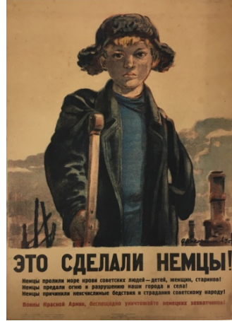
Şekil 7: “Bunu Almanlar Yaptı!” Adlı Propaganda Posterleri, 1944 13

Anlatımın tözünde propaganda posterinde çocuk, koltuk değneği ve yıkıntılar yer almaktadır. Anlatımın biçiminde propaganda posterinde sağ kolunun altında koltuk değneği olan bir çocuk resmedilmektedir. Propaganda posterinin arka planında ise yıkıntılar olduğu izlenimi veren bazı yapılar bulunmaktadır. İçeriğin tözünde propaganda posterinde mağduriyet mesajı ön plana çıkmaktadır. İçeriğin biçiminde propaganda posterinde Alman askerlerinin işgal ettiği yerde yıkıma yol açtığı ve bir çocuğun sakat kalmasına neden olduğu anlatılmaktadır. Propaganda posterinde bu nedenlerden dolayı da Alman askerlerine karşı Sovyet askerlerinin harekete geçmesi istenmektedir.