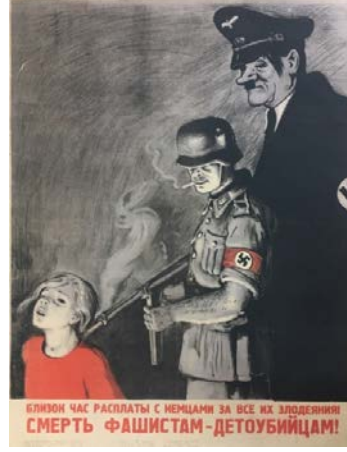
Şekil 8: "Almanlarla Yaptıkları Tüm Zulümler İçin Hesaplaşma Saati Yaklaştı! ..." Adlı Propaganda Posterini, 1944 14

Anlatımın tözünde çocuk, Alman askerleri, sigara ve silah yer almaktadır. Anlatım biçiminde propaganda posterinde kollarında Nazi işareti olan biri uzun (muhtemelen Nazi subayı) diğeri kısa boylu iki Alman askeri olduğu ve kısa boylu olan Alman askerinin sigara içerken bir kız çocuğuna silah doğrulttuğu görülmektedir. Yere çökmüş olarak görünen kız çocuğunun sırtına dayanan silah nedeniyle yaşadığı korku resmedilmiştir. İçeriğin tözünde propaganda posterinde korku ve katliam mesajı ön plana çıkmaktadır. İçeriğin biçiminde propaganda posterinde Alman askerlerinin işgal ettikleri yerlerde çocukları katlettiği ileri sürülmektedir. Propaganda posterinde bebekleri katleden Alman askerleri ile hesaplaşma vaktinin geldiği vurgulanmaktadır.