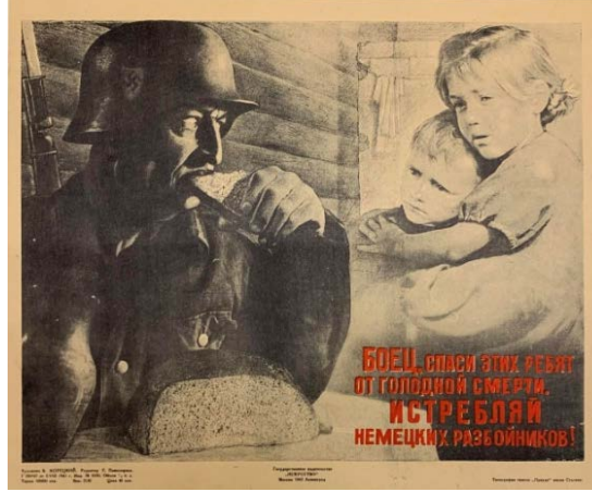
Şekil 4: "Asker, Bu Çocukları Açlıktan Kurtar. Alman Saldırganlarını Yok Et!" Adlı Propaganda Posterleri, 1943 10

Anlatımın tözünde propaganda posterinde Alman askeri, çocuklar ve yiyecek yer almaktadır. Anlatımın biçiminde propaganda posterinin sol tarafında bir Alman askeri bir şey (muhtemelen ekmek) yemekte, sağ tarafında ise iki çocuk Alman askerine doğru bakmaktadır. İçeriğin tözünde propaganda posterinde açlık mesajı ön plana çıkmaktadır. İçeriğin biçiminde propaganda posterinde Alman askerlerinin işgal ettiği yerde çocukların aç kalmasına yol açtığı ileri sürülmektedir. Propaganda posterinde çocukların açlıktan kurtulması içinde Sovyet askerlerinin Alman askerlerine saldırması teşvik edilmektedir.