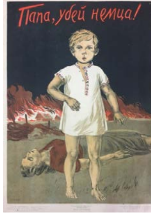
Şekil 1: "Baba, Almanı Öldür!" Adlı Propaganda Posterleri, 1942 7

Anlatımın tözünde propaganda posterinde çocuk, kadın, ev ve yangın yer almaktadır. Anlatımın biçiminde propaganda posterinde ön planda bir çocuk bulunmaktadır. Propaganda posterindeki çocuğun arkasında ise sırt üstü yatan bir kadın ve propaganda posterinin arka planında ise yanmakta olan evler yer almaktadır. İçeriğin tözünde propaganda posterinde yıkım ve katliam mesajı ön plana çıkmaktadır. İçeriğin biçiminde propaganda posterinde Alman askerlerinin işgal ettiği yerdeki bazı evleri