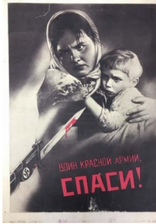
Şekil 2: "Kızıl Ordu Askeri, Kurtar!" Adlı Propaganda Posterleri, 1942 8

Anlatımın tözünde propaganda posterinde kadın, gözü yaşlı bir çocuk ve üzerinde Nazi işareti bulunan süngülü bir silah yer almaktadır. Kadın ve çocuğa doğrultulmuş olan silahın süngü kısmında damlayan bir kırmızılık (muhtemelen kan) görülmektedir. Propaganda posterinde kendilerine doğrultulmuş silah karşısında silahı tutan kişiye doğru bakan korkuyla kadına sarılmış gözünden yaş akan bir çocuk ve çocuğa sarılmış bir kadın yer almaktadır. İçeriğin tözünde propaganda posterinde korku mesajı ön plana çıkmaktadır. İçeriğin biçiminde propaganda posterinde Alman askerlerinin işgali sürecinde kadın ve çocukları (sivilleri) hedef aldığı anlatılmaktadır. Bu şekilde propaganda posterinde kadın ve çocuğun yaşadığı korku/mağduriyet üzerinden Sovyet