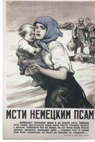
Şekil 5: “Alman Köpeklerinden İntikam!” Adlı Propaganda Poster, 1943 11

Anlatımın tözünde propaganda posterinde çocuk, kadın, öldürülen biri, iki asker ve bir ev yer almaktadır. Anlatımın biçiminde propaganda posterinde ön planda korkulu bir kadın ve kucağında gözü yaşlı bir çocuk bulunmaktadır. Propaganda posterindeki kadın ve çocuğun arkasında ise yüz üstü yerde yatan bir kişi ve bu kişinin başında iki Alman askeri bulunmaktadır. Alman askerlerinin ellerinde çuvallar (muhtemelen yağmaladıkları eşyalar) ve propaganda posterinin arka planında ise bir ev yer almaktadır. İçeriğin tözünde propaganda posterinde katliam, yağma ve kaçış mesajı ön plana çıkmaktadır. İçeriğin biçiminde propaganda posterinde Alman askerlerinin işgal ettiği yerlerdeki evleri yağmaladığı, kadınlarda dâhil olmak üzere sivillerin ölümüne yol açtığı ve insanların bu katliamdan kaçmaya çalıştığı algısı meydana gelmektedir. Özellikle yerde yatan kişinin, Alman askerleri tarafından öldürüldüğü ve kadının kucağında küçük çocukla birlikte korku içerisinde Alman askerlerinden kaçmaya çalıştığı mesajı verilmektedir. Propaganda posterinde ön plana çıkan kadın ve çocuğun Alman askerlerinin saldırılarından mağdur olan siviller olduğu anlatılmaktadır. Propaganda posterinde Sovyetler Birliği askerlerinin bu mağduriyete son vermesi, Alman askerlerinden intikam alması istenmektedir.