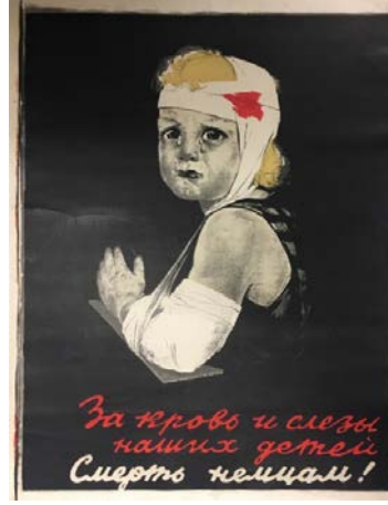
Şekil 3: "Çocuklarımızın Kanı ve Gözyaşları İçin Almanlara Ölüm!" Adlı Propaganda Posterini, 1943 9

Anlatımın tözünde propaganda posterinde çocuk ve sargı bezi yer almaktadır. Anlatımın biçiminde propaganda posterinde başında ve sağ kolunda sargılar olan gözünden yaşlar damlayan bir çocuk bulunmaktadır. Çocuğun başındaki sargıda kırmızı bir leke (muhtemelen kan lekesi) yer almaktadır. İçeriğin tözünde propaganda posterinde mağduriyet mesajı ön plana çıkmaktadır. İçeriğin biçiminde propaganda posterinde Alman askerlerinin işgali sürecinde bir çocuğun yaralandığı ve gözyaşı içerisinde olduğu anlatılmaktadır. Bu şekilde propaganda posterinde çocuğun yaşadığı mağduriyet üzerinden Sovyetler Birliği askerleri Alman askerlerine karşı harekete geçmeye çağrılmaktadır.