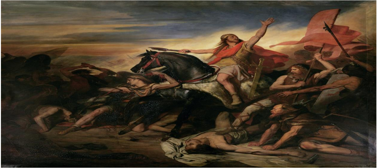
Resim 5. Tolbiac Savaşı (496) 52