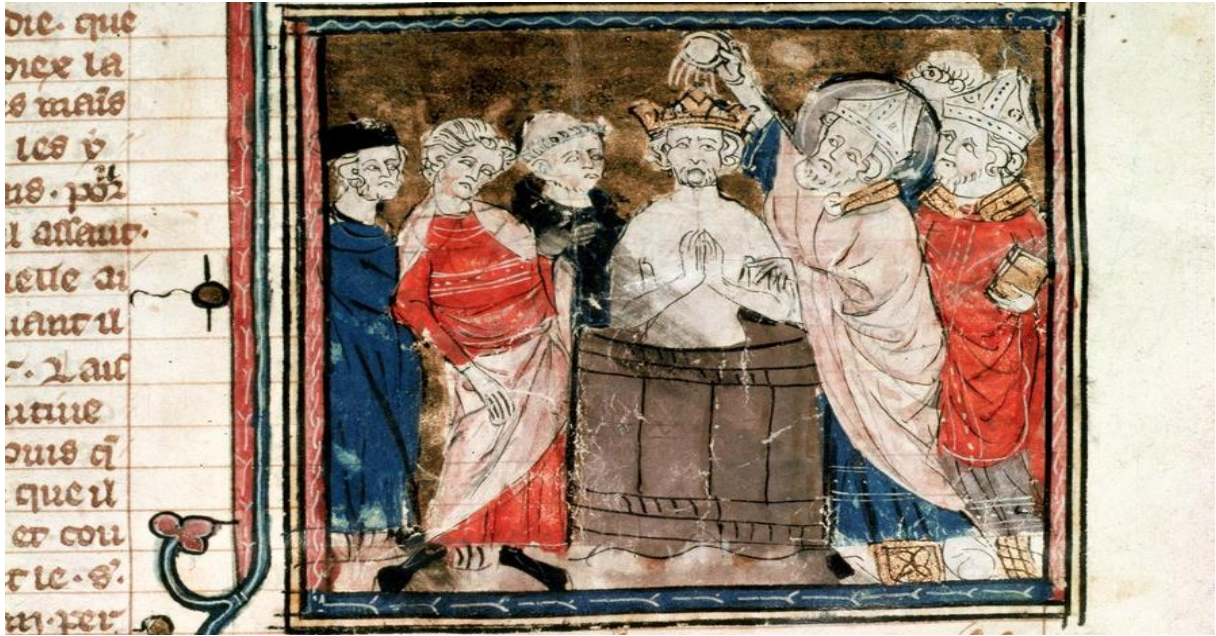
Resim 4. Clovis, Rheims Psikoposu Aziz Remigius tarafından vaftiz edilirken 44

“... Clovis, halkıyla bir toplantı tertip etti... Katılımcılar hep bir ağızdan bağırdılar: ‘Biz bunu yapacağız. Ölümlü tanrılarımıza tapımdan vazgeçerek Kral (Clovis) ve Remigius’un, hakkında bize bilgi verdiği ölümsüz Tanrı’ya inanmaya hazırız.’ Bu haber psikoposa iletildi. Durumdan memnun olan psikopos vaftiz töreninin hazırlanmasını emretti. Tören alanı örtülerle kaplandı, tapınağın duvarları beyaz perdelerle süslendi, vaftiz alanı düzene sokuldu, tütsüler, güzel kokulu mumlar yakıldı ve vaftizhanenin her bir köşesi ilahi kokuyla doldu. Tanrı orada bulunan herkesin kalplerini öyle bir lütufla doldurdu ki orada bulunanlar kendilerini güzel kokulu bir cennetteymiş gibi hissettiler. Kral Clovis, psikopos tarafından vaftiz edilmek istediğini söyledi. Yeni bir Constantin gibi, eski cüzzamının yaralarını yıkamaya ve akan sularla bıraktığı pis lekelerden arınmaya hazır bir şekilde vaftiz törenine doğru adım attı... Vaftiz edilmeye doğru ilerlerken, Tanrı’nın kutsal adamı (psikopos) ona şu anlamlı sözlerle seslendi: ‘Tevazuuyla başını eğ Sigamber 42 (Sicamber) yaktığına tap, tapmaya alıştığın şeyi yak...’ Üçleme’de her şeye kadir Tanrı’nın olduğunu ve varlığını kabul eden kral, Baba, Oğul ve Kutsal Ruh adına vaftiz edildi...’ 43