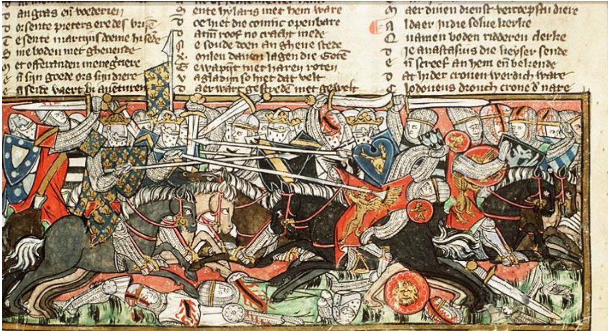
Resim 1. 507 Vouillé Savaşı 6

Görüleceği üzere Theodoric kendi otoritesini korumak amacıyla tarihî bir olayı referans alarak Heruli ve Thüringer krallarına yazdığı mektupla onları kendisiyle ortak hareket etmeye zorlamaktadır. Fakat Theodoric'in bu çabası özellikle Clovis tarafından olumlu karşılanmamış ve Clovis tarihi kayıtlara 507 tarihli Vouillé olarak geçen savaşta II. Alaric'i mağlup ederek öldürmüştür. 5 Dolayısıyla Theodoric'in akrabalık bağlarını kullanma çabası gerek diplomasi gerekse de askerî ilişkileri yönetmek açısından başarısızlıkla sonuçlanmış ve yapılan mücadelelere dayanak oluşturamamıştır. Bu gelişmeler erken Orta Çağ Avrupası'nda tarihî olaylar üzerinden örneklendirilen akrabalık ilişkilerinin teorik ve pratik açıdan birbirinden ne denli farklı olduğunu açıkça göstermektedir.