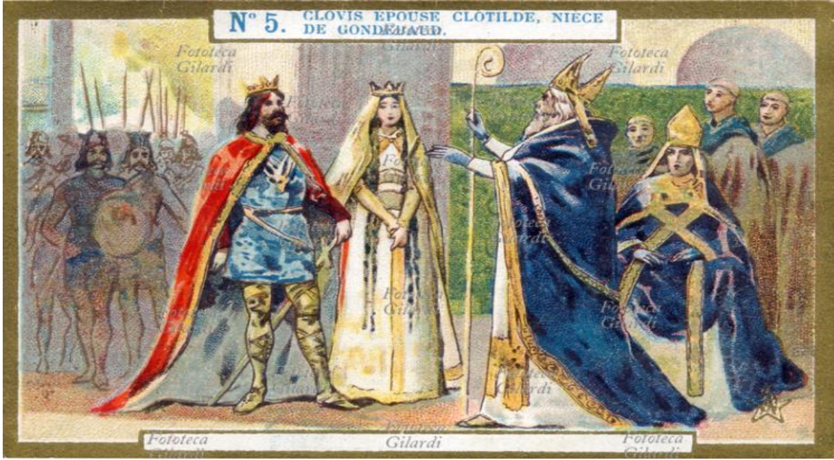
Resim 3. Clovis ile Clothilde'in nikah merasimi 23

olduğundan daha güçlü göstermeye çalışmasından kaynaklanıyor olabilir. Nitekim Gundobad'ın her ne koşulda olursa olsun başlangıçta bu evliliğe kesinlikle yanaşmadığı ve korku dolu ifadelerle de olsa gerekirse bu meselenin çözümü için olası bir savaşı dahi göz önüne alabileceği LHF'de açıkça belirtilmiştir. 21 Özellikle Gregory'nin verdiği bilgiler üzerinden Clovis'in, Clothilde ile evliliğine dair beklentisi tam olarak açıklığa kavuşturulmaması da bu evlilik onu hem Burgonya Krallığı ile akraba yapmış hem de siyasi açıdan rakiplerine nazaran elini güçlendirmiştir. Öte yandan bakıldığında Clovis'in, Gundobad'ı bu evliliğe rıza göstermesi için zorladığı da görülmektedir. Wood'a göre bu evlilik üzerine bilgi veren Gregory'nin söylediklerine bakılırsa Clovis, Clothilde ile yapacağı evlilik üzerinden bir huzursuzluk çıkarmak niyetindedir 22 ve bu durum ise bir nevi Clovis'in, Galya topraklarında düşlediği hakimiyet sahası için aradığı fırsat gibi görünmektedir.