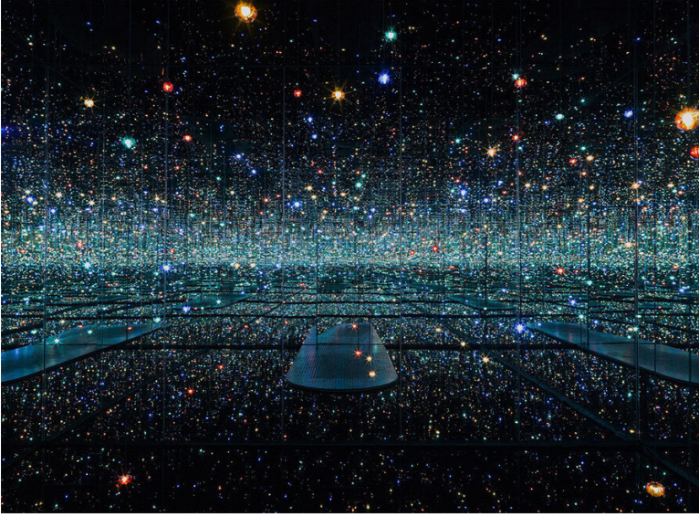
Görsel 6. Yayoi Kusama, Sonsuzluk Odası ( Infinity Mirrored Room ), 2012, Enstalasyon.

Yayoi Kusama, Sonsuzluk Odası adlı (Görsel 6) enstalasyon çalışmasında mekân içinde bulunan noktaların, sonsuz sayıda yansımaları elde ederek insanın evren içinde yalnızlığına dikkat çekmek istemiştir. Zihninde sonsuz sayıda var olan noktalar sonsuz sayıda eser içerisinde yer almaktadır. Kusama izleyicinin enstalasyonda gezerken, mekânı hissetmesini ve izleyicinin duygularıyla yüzleşmesini istemektedir. Sanatçının eseriyle, izleyici etkileşim içine girer ve izleyici düşünür, eseri kendi zihninde algıladığı şekliyle yeniden yorumlar. Yani sanat yapıtı mekânın içinde yer alır ve mekanla bütünleşir, izleyicide mekânın içinde birebir yer alarak mekânı hisseder ve mekanla tek vücut olur.