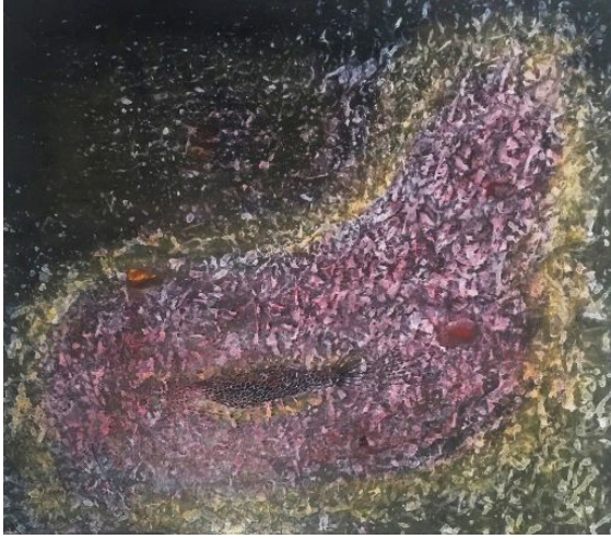
Görsel 2. Yayoi Kusama, Doğu Denizi , 1957, Tuval Üzerine Yağlıboya.

Varlıklı bir ailenin küçük kızıdır ama mutlu değildir. Gözü dışarda olan bir baba ile ihanete uğrayan annesinin bunalımlı hali arasında kalmıştır. Annesi ise Yayoi Kusama üzerinde baskı uygular, resim yapmasını hiç istemez (Bulut, 2019). Annesinin başı öne eğik ve gözleri kapalıdır ve sanatçı eserinde, annesinin suratını böyle tasvir ederek, belki de annesinin hastalığını ve resim yapmasını onaylamasını istemiş olabilir. Çünkü annesi resim yapmasını istememektedir. Sonuç olarak Kusama'nın eserinde noktalar şeklinde ortaya çıkan obsesyonları görülmektedir ve sanatçının iç dünyasını yansıtmaktadır.