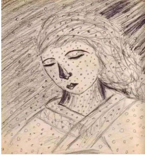
Görsel 1. Yayoi Kusama, 10 yaşındayken çizdiği annesinin Portresi , 1939, Karakalem Çalışması.

kuların bir araya geldiği sanat eserleri, sanatçının duygusal ve zihinsel dünyasına ulaşarak içsel dengeyi sağlar. Bu denge, stresi azaltmak, anksiyeteyi hafifletmek, ruhsal rahatlamayı desteklemek ve yaratıcılığı artırmak için önemlidir. Sanat, sanatçıların iç dünyalarını ifade etmek ve duygusal yüklerini hafifletmek için sığınabilecekleri güvenli ve özgür bir alan sunar. Farklı renklerin, desenlerin, şekillerin ve kompozisyonların kullanılması, duyguların karmaşıklığını ifade etmenin güçlü bir yoludur. Bir tuvalin, bir heykelin veya bir sanat eserini oluşturmak için önünde geçirilen zaman, sanatçıların içlerinde biriken sevinç, hüznün, öfke veya hayal kırıklığını anlamalarına ve ifade etmelerine yardımcı olur. Bu özgür ifade, içsel dengeyi koruma, stresi azaltma ve zihinsel rahatlamayı sağlama noktasında önemli bir rol oynar. Özellikle duygusal olarak negatif hissedilen zamanlarda, sanatın sağladığı bu duygusal rahatlama, insanların zihnindeki gerginliği hafifletirken duygusal bir çıkış yolu sunar. Sanatı bu şekilde kullanan sanatçılardan biri de Yayoi Kusama'dır.