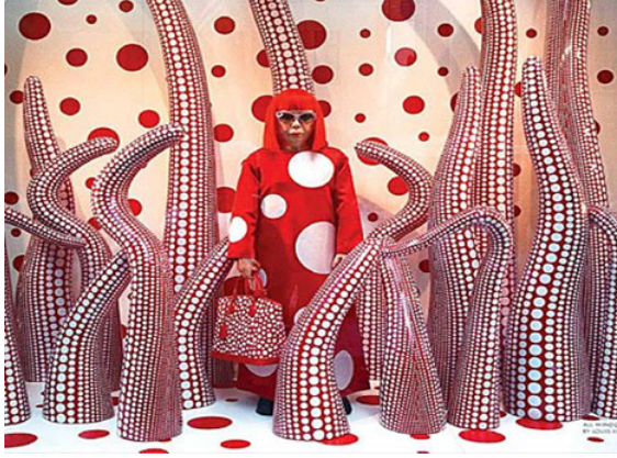
Görsel 5. Yayoi Kusama, Louis Vuitton Vitrin Tasarımı , 2012, London.

Buradan şunu anlıyoruz, sanatçı sanatı ile duygularını kontrol altına almakta, psikolojisini olumlu yönde etkilemekte, bilinçdışını açığa çıkarmakta ve sanatıyla kendisini tedavi etmektedir. Sanat yaparak sanatın iyileştirici gücünü kullanmaktadır ve hastalığını olumlu yöne çevirerek yaratıcılığını açığa çıkarmaktadır.