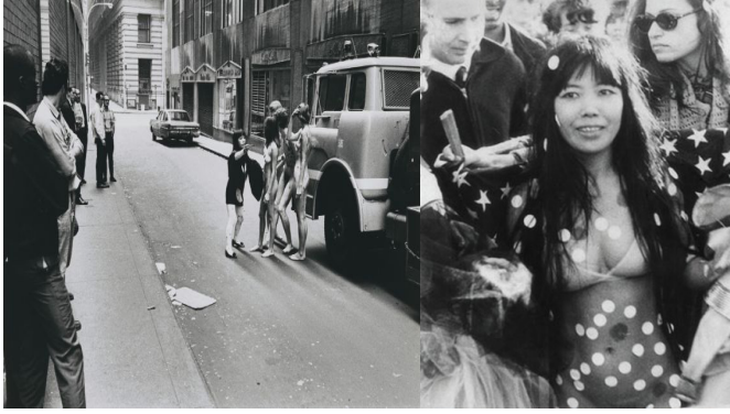
Görsel 4. Yayoi Kusama, Harry Shunk, Janos Kender, Anatomik Patlama , 1968, Sokak performansı, New York.

Sanatçı Anatomik Patlama (Görsel 4) adlı sokak gösterisini, şiddete karşı çıkmak için Vietnam Savaşı sırasında Amerika'da ve New York Menkul Kıymetler Borsası'nın karşısında gerçekleştirmiştir. Kusama, şiddete çıplak vücut boyama ve cinsellik içeren performans sanatlarıyla karşılık vermektedir. Sanatçı, gösterisi için çıplak dansçılar bulup dansçıların vücutlarını noktalarla boyamıştır. Psikolojisinde tekrarlar şeklinde oluşan nokta takıntılarını sanatçı bu kez, kendisinin ve dansçıların vücudunda kullanmıştır. Böylece sanatçı kendisinin ve dansçıların vücudunu, sanat eserine dönüştürmüştür. Bu performans sanatında da görüldüğü gibi, eserlerinde sıklıkla kullandığı nokta desenlerini her sanat disiplinde kullanmıştır.