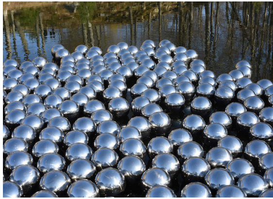
Görsel 3. Yayoi Kusama, "Nergis Bahçeleri" (Narcissus Garden), 1966, Yerleştirme.

Bir hastalığın sanatçı üzerinde yaratıcılığa dönüşmesi, sanatçının hangi konuyu ele aldığı ve hangi materyalde duyguyu algıya dönüştürdüğüyle ilişkilidir (Hanson, 2005). Ayrıca Yaratıcılık kişinin bazen kendinde gördüğü eksikliği fark ederek, özgün, alışılmışın dışında olanı kurgulayabilme becerisidir. Kusama noktaları tüm çalışmalarında kullanmış ve birçok materyal üzerine aktararak yaratıcılığa dönüştürmüştür. Burada ayırıcı konu sanat mı hastalığı iyileştirir yoksa hastalık mı sanatı iyileştirir konusu önemli bir noktadır. Sanatçının eserinde de görüldüğü gibi; takıntıları oluşturulan noktalar sanatına yansyarak eserinin ortaya çıkmasını sağlayarak kendisini ifade etmesini sağlamıştır ve sanatın iyileştirici yönünü kullanarak da kendisini tedavi etme şansını bulmuştur. Kısaca diyebiliriz ki, Kusama'nın bu eserinde de noktalar yer almakta olup, sanat Kusama için obsesyonlarından bir kaçış, bir sığınak ve sürekli üretmektir.