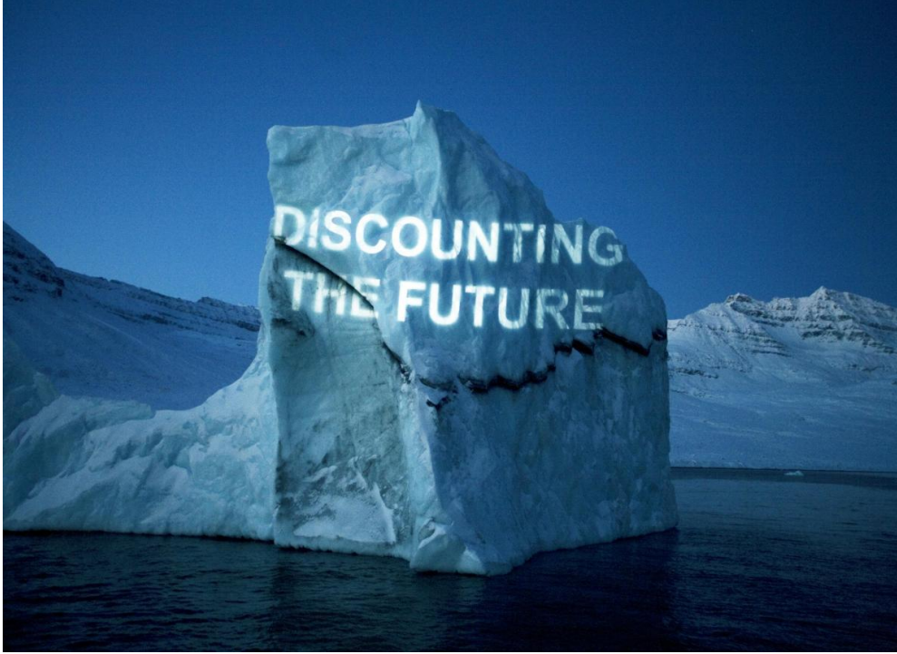
Görsel 7: David Buckland, "Ice Text", 2009, Norveç

İklim krizinin önemli bir sebebi de artan sera gazlarıdır. Atmosfere oldukça zarar veren bu gazlar, ozon tabakasını delmekte ve güneş ışınlarının yüzeye zararlı bir şekilde yansımaya neden olmaktadır. Atmosferde ısıyı tutarak tıpkı bir seradaymış gibi hissiyatı verdiği için bu duruma "sera etkisi" adı verilmiştir. Sera gazlarının atmosfere yıkıcı etkisinin başlangıcı 19. yüzyıla dayanmaktadır. Sanayi Devrimi ile birlikte artan karbonmonoksit, metan ve kükürt gazları fosil yakıtların bir sonucudur. Fosil yakıtlar sanayileşme ve nüfus artışlarıyla birlikte kontrolsüz bir şekilde kullanılmaya, birkaç yüzyıl geçince de etkileri gözle görünür bir biçimde karşımıza çıkmaya başlamıştır. İklim krizi yukarıda bahsedilen sera gazı olgusu örneğinde olduğu gibi insan kaynaklıdır. Bu yüzden günümüzde eskisine nazaran daha bir bilinçlenme söz konusudur. Sanatçılar ve bilim insanları değişiklikleri inceleyip ve bunun üzerine küresel anlamda düşünmekte ve iş üretmektedirler (Steiner, 2016, s.149).