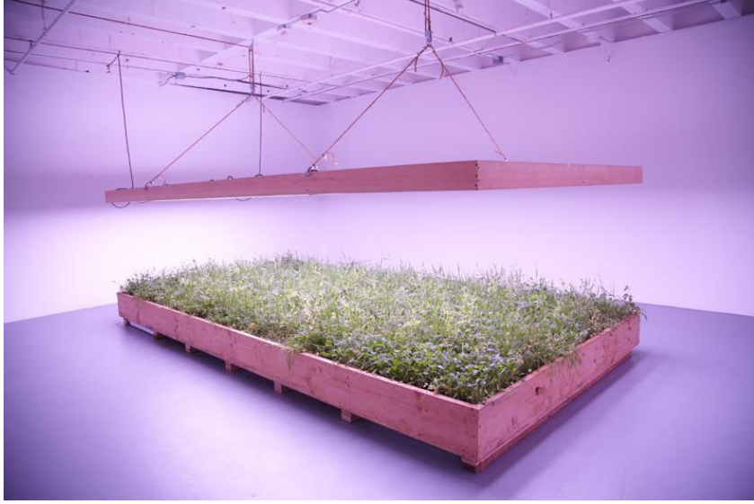
Görsel 1: Helen Mayer Harrison ve Newton Harrison, "Survival Place I", 1970, Londra