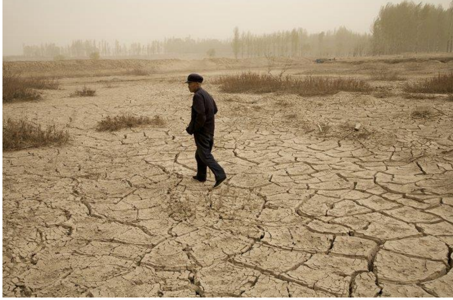
Görsel 4: Benoit Aquin, “Dust Bowl”, 2006, China

süresince resmetmiştir. Resimdeki kadın figürlerinde ifadesizlik ve ilgisizlik gözümüze çarpmaktadır. Bunun sebebi felaketin insanlarda travma ve depresyon yaratmasıdır. Sanatçı eserlerinde, ekolojik tahribatın insanlarda yarattığı travmayı ele almaktadır. İklim krizi sonucu oluşan felaketlerin tanıklarını tıpkı bir belgeselci gibi gözlemlemekte, kayıtlar tutmakta ve resmetmektedir (Godfrey, 2024, s.208).