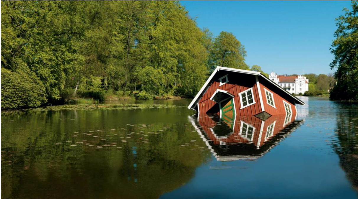
Görsel 6: Tea Makipaa, "Atlantis Wanas", 2007, Finlandiya

İngiliz sanatçı David Buckland ise iklim krizi hakkında etkili işler üreten güncel bir sanatçı olarak karşımıza çıkmaktadır. Sanatçı, projelerinde disiplinler arası çalışarak bilim insanlarından da yardım ve danışmanlık almıştır. Sanatçı 2001 yılında "Cape Farewell" projesini oluşturmuştur. Bu projede iklim krizi yaşayan özellikle buzul erimesi olan alanlara geziler düzenlenip bunun sonucunda sanatsal işler (opera, film, edebiyat) üretilmesi amaçlanmıştır. Cape Farewell projesi bu yüzden iklim değişikliği üzerine en etkili ve güçlü projelerden biri olarak da nitelendirilmektedir (Brown, 2014, s.77). David Buckland bu projede Norveç'de -30 derecede buzullar üzerine projeksiyonla iklim krizi üzerine sloganlar yazıp fotoğraflamıştır (Görsel 7). Oldukça kısa sloganlarla güçlü bir etki yakalamak isteyen sanatçı buzulların erimesini adeta tarihsel bir parçanın yok oluşuna benzetmiştir.