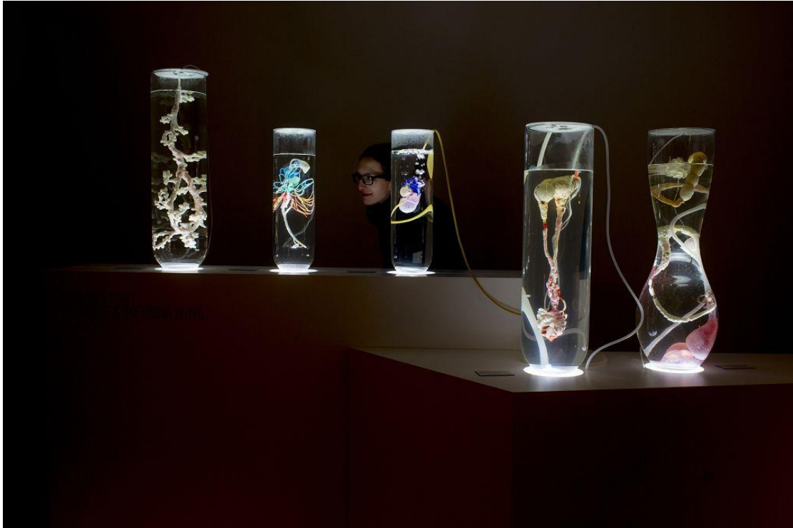
Görsel 11: Pınar Yoldaş, "Ecosystem of Excess", 2014, Almanya