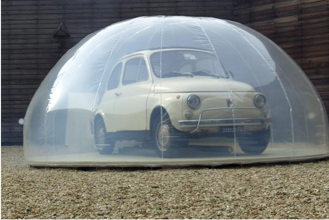
Görsel 8: Andrea Polli, “Breather”, 2011, Amerika

Kuveytli sanatçı Monira Al Qadiri “Deep Float” adlı heykelinde bulunduğu ülkenin petrol politikasına eleştirel bir yorum yapmıştır. Artan fosil yakıt tüketiminin insanlığı nasıl bir çıkmaza sürüklediği küvette petrole bulanmış bir insan figürüyle belirtmiştir. Eserde küvette petrole bulanmış bir çift el karşımıza çıkmaktadır (Görsel 9). Esere yakın duvarda da kaligrafik şekilde eski Farsça petrol yazmaktadır. Sanatçı bu yazıyı Marco Polo’nun notlarına dayandırmaktadır. Marco Polo’ya göre insanlar şifa bulmak için petrol kaplıcalarında yıkanmış (Fowkes, 2022, s.47). Eski dönemlerde şifa kaynağı olarak nitelendirilen petrol, şimdi sanayinin vaz geçilmez bir parçası haline gelmiştir. Günümüzde savaşların, kapitalizmin ve sömürgeciliğin en önemli nedenlerinden biri olmuştur. İnsanlık ve doğa petrolün iyileştirici anlamını yitirdiğinden beri aslında günden güne kötü bir sona doğru batmaktadır. Eserdeki petrole bulanmış eller, günümüz insanın durumuna eleştirel bir göndermedir. Ekonomik hırslar uğruna insanlık çevreyi tahrip etmekte fakat bunun bedelini de ödemektedir.