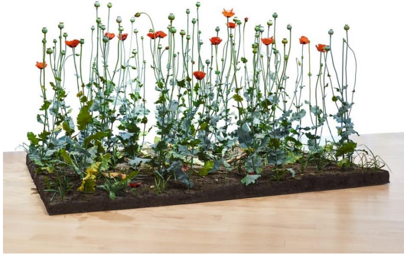
Görsel 3: Roxy Paine, "Crop", 1997, New York