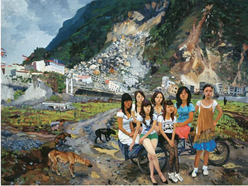
Görsel 5: Liu Xiadong, “Out of Beichuan”, 2010, China