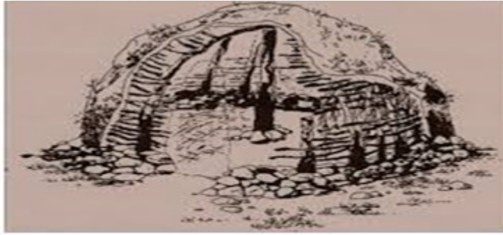
Çayönü Basit Kulübe - Evre I Ergani - Diyarbakır

sayesinde sürekli bir hava akımı sağlamıştır. Bu durum nemin olumsuz etkilerinden korunmanın yoludur ve sistem gelişmiştir. Yaklaşık olarak M.Ö.9200 tarihlerine aittir 17 . "Izgara plan tipinin gelişerek birkaç yüzyıl devam ettiği, bu süreç içinde yapının giderek dörtgen bir dış duvara sahip olduğu ve taban altındaki ızgaraların da bir taş döşemeye dönüştüğü görülmektedir. Bu nedenle ızgara planlı yapı evresi, mimarlık tarihinde çok tartışmalı olan yuvarlak plandan dörtgen plana nasıl geçildiğini tüm aşamalarıyla sergileyen bir süreci yansıtmaktadır" 18 .