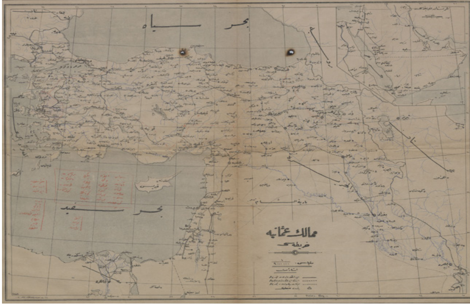
Fotoğraf 2: Memalik-i Osmaniye'nin Asya bölgesinde işlemekte ve inşa edilmekte olan demiryolları ile petrol mntıklarını gösteren 1/400.000 ölçekli harita 10