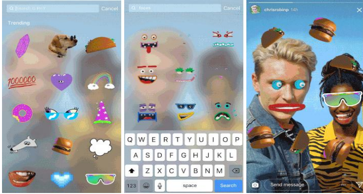
Resim 2. GIF'ler. (Ezgiakarr, 2024)