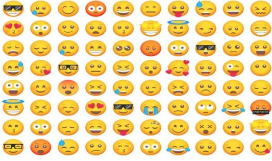
Resim 1. Emojiler (Smartprix, 2024)

Aşağıdaki tabloda dijital iletişimde sıklıkla kullanılan bazı emojiler, beden dili kapsamında temsil ettikleri öğelerle birlikte sunulmuştur. Bu eşleştirme, dijital ortamlarda beden dilinin yerini nasıl sembolik ve görsel öğelerin aldığına dair bir çerçeve sunmaktadır.