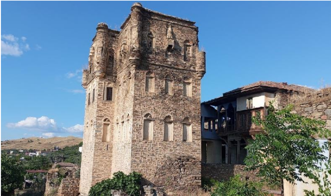
Ek-1 Aydın'ın Nazilli ilçesinde bulunan Arpaz Kulesi.