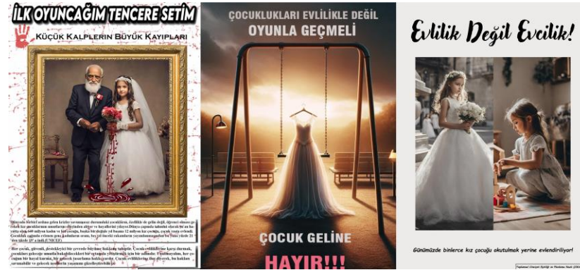
Şekil 6. Eğitim ve cinsiyet başlıklı poster sunumları (öğrenci çalışmaları)

Sosyal refah devletlerinde eğitim almaya başlamak ve eğitime devam etmek tüm yurttaşların eşit hakkıdır. Ancak bu durum pratikte sekteye uğramaktadır. Eğitimdeki fırsat eşitsizlikleri ekonomik, coğrafi, politik, kültürel ve bireysel farklılıklar içerebilmektedir (Kurttaş, 2021). Dünya geneline bakıldığında 122 milyon kız çocuğunun okula gidemediği, okuyamayan yetişkinlerin ise yaklaşık üçte ikisini kadınların oluşturduğu bilinmektedir (UNESCO, 2023). Ülkemizde kız çocuklarının okula gitme oranını artırmak için yapılan çeşitli projeler faydalı olsa da istatistikler erkeklerin avantajlılıklarını koruduğunu göstermektedir.