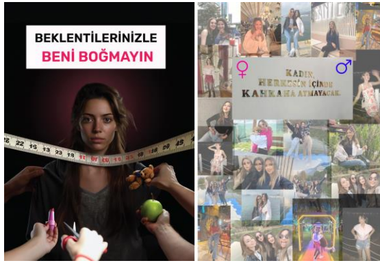
Şekil 5. Medya ve cinsiyet başlıklı poster sunumları (öğrenci çalışmaları)