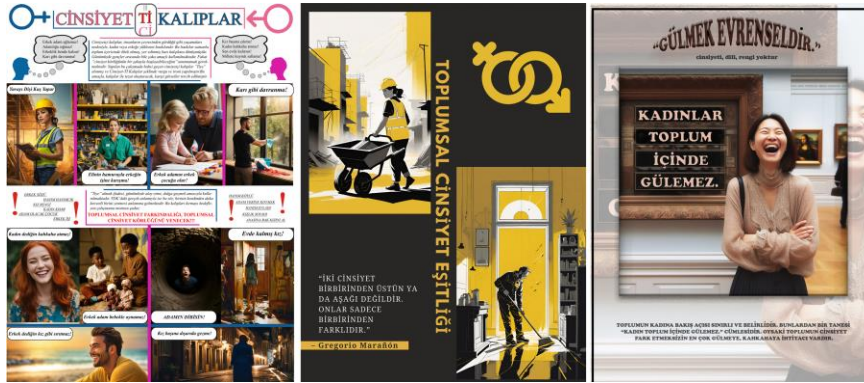
Şekil 2. Toplumsal cinsiyet başlıklı poster sunumları (öğrenci çalışmaları)

çalışkan (f=2) ve tutumlu (f=2) kavramlarıyla birlikte anılmıştır. Görüldüğü üzere öğrencilerin içinde yaşadıkları toplumdan pek de ayrışamayan cinsiyet tanımları mevcuttur. Nitekim erkekler gücün, otoritenin, özgürlüğün; kadınlar ise nahifliğin, güzelliğin ve evcimenliğin timsalidir. Yapılan görüşmelerde her iki cinsiyetin de kadınlığı daha zor bulduğunu söylemek mümkündür. Ayrıca kırsal ve kentsel alanda yaşayan kadınlar arasında da farklılığa dikkat çekilmiş, ülkemiz kırsalında kadınların daha da ötekileştirildiği (şiddete maruz kalma, ailede söz sahibi olamama, baskı, yargılama, ücretsiz işçilik vb.) ifade edilmiştir.