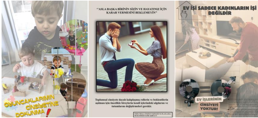
Şekil 3. Toplumsal cinsiyet rolleri başlıklı poster sunumları (öğrenci çalışmaları)

Bu bilgilerin ışığında araştırmada cinsiyet rolleri bağlamında bir ayrışmanın söz konusu olup olmadığını belirlemek amacıyla öğrencilerden kadın ve erkeklere özgü meslekleri sıralamaları istenmiştir. Öğrenciler sanayi/oto tamir/galeri çalışanı (f=18), şoför (f=16), yönetici (f=16), polis, asker vb. kolluk gücü (f=15), mühendis (f=13), siyasetçi (f=10), esnaf (f=11), yazılımcı (f=11), müteahhit (f=8), sporcu (f=6), oyun tasarımcısı (f=2), gardiyan (f=2), avukat (f=2) ve makine operatörü (f=2) meslekleri ile erkekleri; hemşire (f=19), sekreter (f=17), öğretmen/akademisyen (f=16), mimar/iç mimar (f=12), modatasarımcısı (f=9), temizlik işçisi (f=9), memur (f=7), kuaför (f=5), diyetisyen (f=5), psikolog (f=5), çiçekçi (f=3), bebek bakıcısı (f=3), eczacı (f=3), spiker (f=2) ve model (f=2) meslekleri ile kadınları ilişkilendirmiştir. Bu bağlamda öğrencilerin zihninde keskin bir şekilde ayrıştırılmış meslek gruplarının olduğunu söylemek mümkündür.