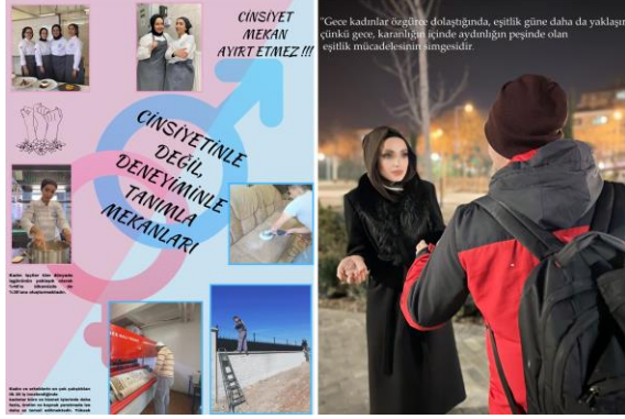
Şekil 9. Kentsel mekânda ayrışma başlıklı poster sunumları (öğrenci çalışmaları)

Planlama öğrencileri ise eril mekanları sanayi alanı (ve oto yıkamacı, oto galeri vb.; f=20), halı saha (stadyum; f=18), kahvehane (nargile/internet cafe vb., f=17), yeşil alan (park, piknik alanı vb.; f=14), ibadet alanı (f=13), kamusal tesis (adliye, belediye, karakol vb.; f=10), askeri tesis (f=8), eğlence mekanları (f=7) olarak sıralamaktadır. Ev (f=20), alışveriş merkezleri (f=20), güzellik salonları (f=16), çocuk parkları (f=12), mahalle pazarı (f=12), sağlık tesisi (hastane, sağlık ocağı vb.; f=10), hobi kursları (f=5), eğitim tesisleri (f=4) ise dişil mekân olarak belirtilmektedir. Öğrenciler hava karardıktan sonra mekânsal ayrışmadan ziyade tüm kentün eril kimlik kazandığını ifade etmektedir.