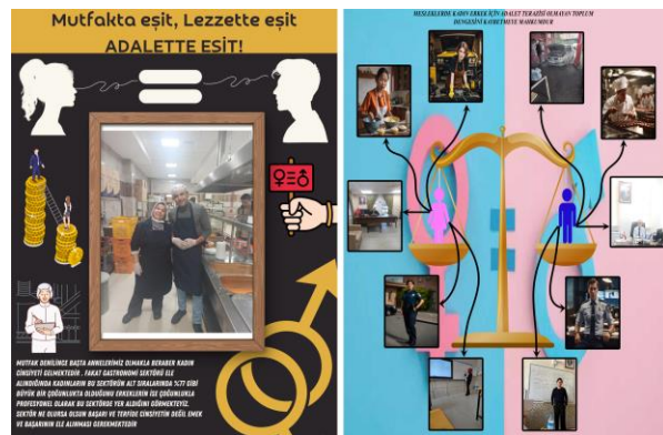
Şekil 8. Cinsiyet ve hukuk başlıklı poster sunumları (öğrenci çalışmaları)