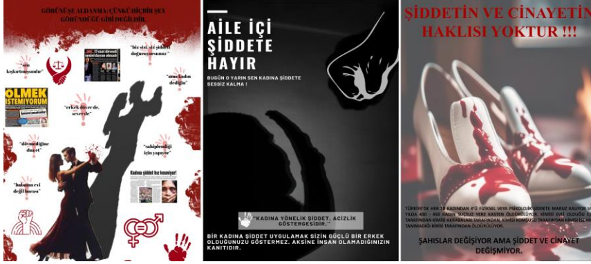
Şekil 4. Kadına yönelik şiddet başlıklı poster sunumları (öğrenci çalışmaları)

davranışlarında farklılaşmalar yaratmaktadır. Kadınlar ise hem cinsiyet hem de şiddetin türüne göre öncelikle kendilerini korumaya yönelik bir tutum içerisinde (bkz. Tablo 5).