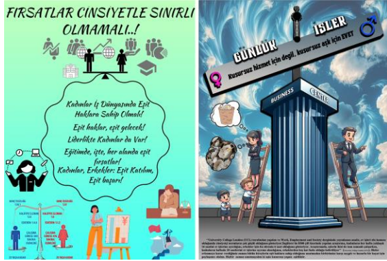
Şekil 7. Çalışma yaşamında eşitlik başlıklı poster sunumları (öğrenci çalışmaları)

yoğunlaşmıştır. Yemek, temizlik, kuaförlük, büro işleri, bakım hizmetleri vb. sektörlerde daha fazla yer alan kadınlar dişil meslek zincirini kıramamıştır. 19. yüzyılda kapitalizmin ve eril sistemin etkisiyle kadınların ya evle ilişkilendirildiği ya da istihdamlarının kısıtlandığı bilinmektedir. Bu dönemde genellikle dişil sektörlerde yer alan kadınların konumları marjinalleşmeye başlamış, kadınlar düşük ücretli, kötü örgütlenmiş sektörlerde, ağır şartlar altında çalışmak zorunda kalmıştır. Tüm güçlükleri ek olarak kadın eve geldiğinde ikincil işi ev halkına bakım/hizmet olmuştur (West, 2022). Aynı işi yapsalar dahi kadınların aldığı ücret erkeklere nazaran daha düşük kalmaktadır. TÜİK (2023) cinsiyetler arası kazanç farkını %19,6-%14,5 olarak açıklamıştır. Pek çok kadının çocuklarının ya da bakmakla yükümlü oldukları diğer akrabalarının tek ekonomik geçim kaynağı olduğu düşünüldüğünde (Land, 2000) kadınlar tarafından ücretten ziyade bir iş bulmanın önem kazanması muhtemeldir. Bu nedenle daha düşük kazancı olsa da bulunan iş kaybedilmek istenmemektedir. Dikey ayrımcılık ise kadınların mesleklerinde daha alt pozisyonlarda kalması durumudur. Cam tavan sendromu olarak da bilinen bu durum hemen hemen her alanda (özel sektör, kamu sektörü vb.) kendini hissettirmektedir. Üst düzey yöneticilerin, müdürlerin, siyasi parti liderlerinin ve hatta rektörlerin erkek ağırlıklı olması dikey ayrışmanın en belirgin göstergeleridir.