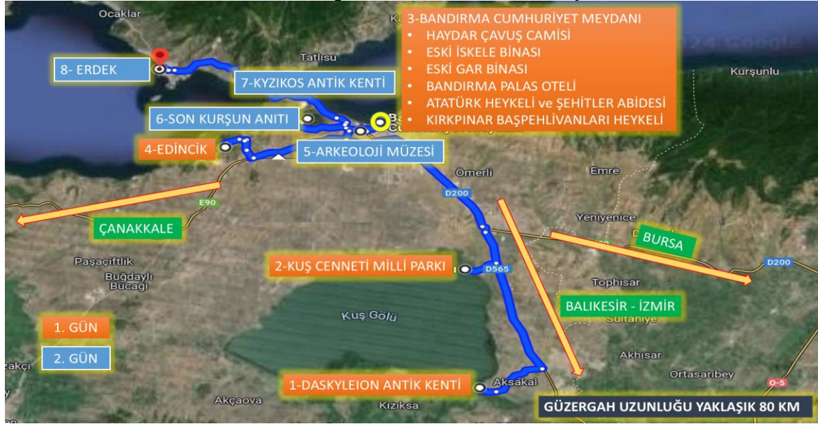
Harita 5: Bandırma bir gece konaklamalı tur rotası ziyaret noktaları

Kaynak: Google Maps uygulamasından alınan harita üzerinde yazarlar tarafından düzenlenmiştir.