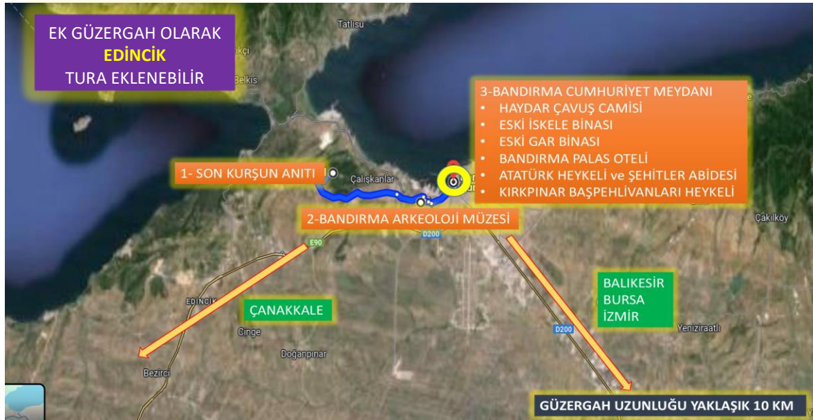
Harita 3: Bandırma yarım günlük tur rotası ziyaret noktaları