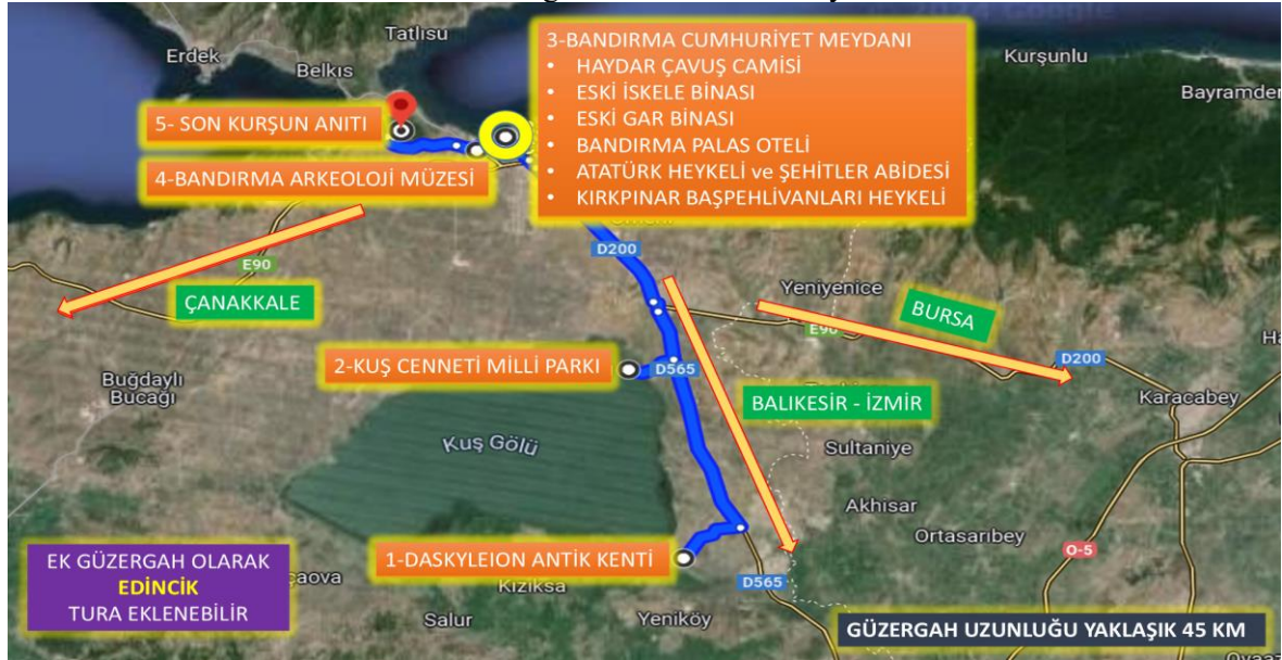
Harita 4: Bandırma günübirlik tur rotası ziyaret noktaları