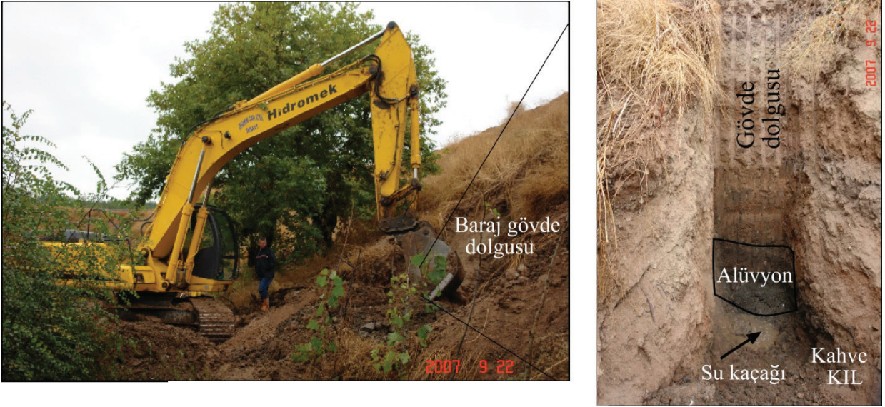
Şekil 4. Baraj gövde dolgusu ile kahverengi kil arasındaki alüvyonda su kaçağı.

Figure 4. Water seepage from the alluvium between the dam fill material and brown clay.