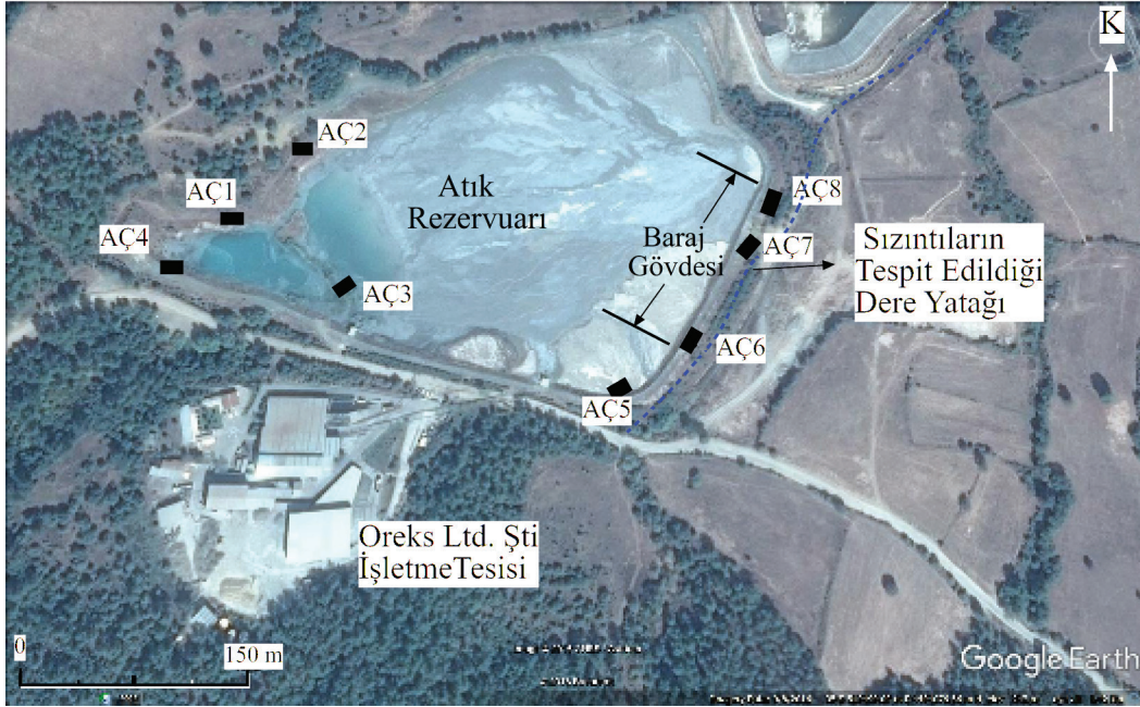
Şekil 2. Atık rezervuar alanı ve araştırma çukuru konumları.

Siltli kumun geçirimsizlik katsayısı ise 3.33 \cdot 10^{-6} cm/s olup, yarı geçirimlidir.