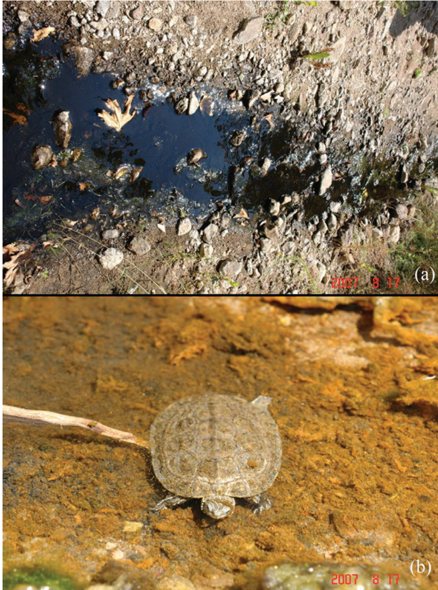
Şekil 5. Gövde mansabındaki dere yatağında çökelen ağır metal ve demiroksit (a) ile yaşam mücadelesi veren su kaplumbağası (b).

önlenmiş ve çevresel etkileri önlenmiştir. Tesiste üretim halen devam etmektedir.