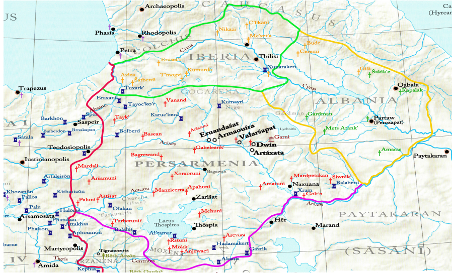
Harita 2: İlhami Tekin Cinemre, Kaynak: Hewsen, 2001, s. 85; TAVO B VI 14, B VIII 4; BAtlas , map89.

Kuzeyden güneye uzanan yeni sınırın batısının Roma İmparatorluğu tarafından III. Arşak'ın (yak.379–387?) yönetimine verilmesiyle bölge Romalılar tarafından kontrol edilmeye başlandı. 76 Ancak III. Arşak'ın ölümünden sonra, Roma imperial gücü buraya yeni bir idareci atamadı ve bu bölgeyi Comes Armeniae 'nin idari yetkisi altında Armenia Inferior olarak isimlendirdiler. 77 Armenia Inferior da yine kendi içinde Armenia Prima ve Armenia Secunda olmak üzere iki parçaya ayrıldı. 78 Bu sınır hattı, Korduena'ya doğru Roma topraklarına dâhil olarak, güneye doğru uzandığında Balabitene, Asthianene ve Khorzane bölgelerini de içeriyordu. Esasen 299 yılından bu yana Romalıların elinde olan bölgelerde, yeni sınırın etkisiyle idari ve sosyal açıdan istikrarsızlık yaşanmaya devam ediyordu. 79 Zira Ermenilerin Tsop'k olarak adlandırdığı bu bölge, kendi içinde çeşitli