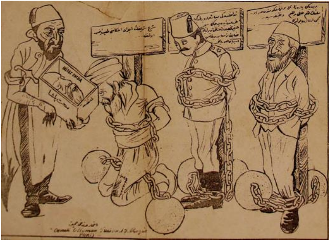
Şekil 8. Abdülhamid’in Cellad Olarak Gösterildiği Bir Figür

Laklak: Mehmet Fazlı’nın 1907 yılında Kahire’de çıkardığı ve içerisinde karikatürlerin yer aldığı mizah gazetesidir. Beşinci sayısından sonra İstanbul’da yayınlanmaya başlamıştır (Akünel, 1980: 1298). Hakkı Tarık Us koleksiyonundan gazetenin dördüncü ve beşinci sayılarına ulaşılabilmektedir. Buna binaen Laklak ’ın ayda iki defa neşr olduğu kapağındaki yazıdan anlaşılmaktadır. 15 Mayıs ve 1 Haziran 1907 tarihli iki sayısı elde mevcuttur. Gazete kapağında bir karikatür ile yayına çıkmıştır. O dönemdeki önemli hadiselerle gönderme yapılan çizimler görülmektedir. Toplamda dört sayfa olarak çıkan gazetenin son sayfasında da başka bir karikatüre rastlanmaktadır ( Laklak , Nu: 4-5, 15, Mayıs ve 1 Haziran, 1907).