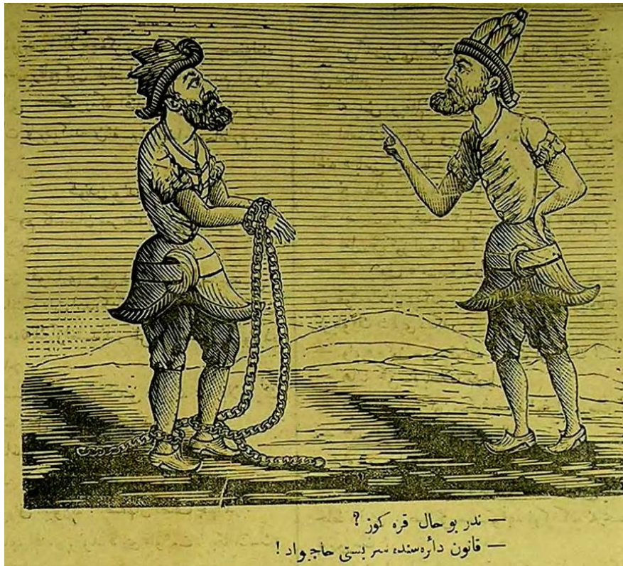
Şekil 5. -Nedir bu hal Karagöz?

Sultan Abdülhamid, basına karşı uyguladığı siyaseti kanunlar çerçevesinde yaptığını öne sürmüştür. Hukuki dayanağının Matbuat Nizamnâmesi ile Kararnâme-i Örfi’de bulunduğunu iddia etmektedir. Ayrıca Sultan Abdülaziz’den beri devam eden Encümen-i Teftiş ve Muayene kuruluyla kitap yayınlarına sansür uygulanmaktaydı. Var olan bir uygulamayı Abdülhamid devam ettirmiştir. Bu devirde görülen ilk kapatma Teodor Kasap’ın çıkardığı Hayal adlı mizah gazetesine olmuştur. Kapatılma nedeni olarak da ( Hayal , Nu: 319, 8 Şubat 1292/15 Şubat 1877) sayısındaki Nişan Berberyan’ın bir karikatürü gösterilmiştir. Karikatürde Hacivat’ın “Bu ne hal Karagöz?” sorusuna eli ayağı zincirli Karagöz “Kanun dairesinde serbestî Hacivat!” cevabını vermektedir. Kanun-ı Esasi ile gelen basın özgürlüğünün yeterli olmadığı vurgulanmak istenmiş, ancak bu eleştiri yüzünden dergi kapatılmıştır (Özgül, 2010: 384).