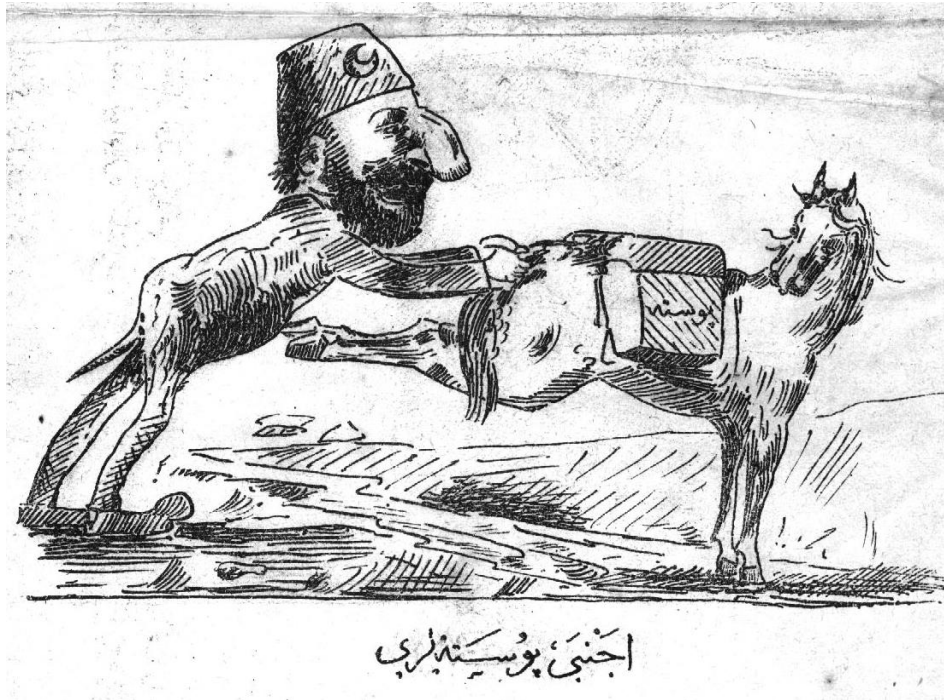
Şekil 7. Ecnebi Postaneleri ( Tokmak , Nu: 5, 15 Haziran 1901)

Giriş yazısından da anlaşılacağı üzere Tokmak , Abdülhamid ve saraya oldukça muhalif ve sert bir söylemle basın hayatına devam etmiştir. Gazetenin her sayısında en az bir karikatüre rastlanmıştır. Bu karikatürlerde genellikle ana simge Abdülhamid olmuştur. Kimi zaman kellesi gövdesinden ayrılmış bir şekilde gösterilmiş, kimi zaman üzerinde haçlarla Batı'ya yardım ettiği imajı verilmeye çalışılmıştır.