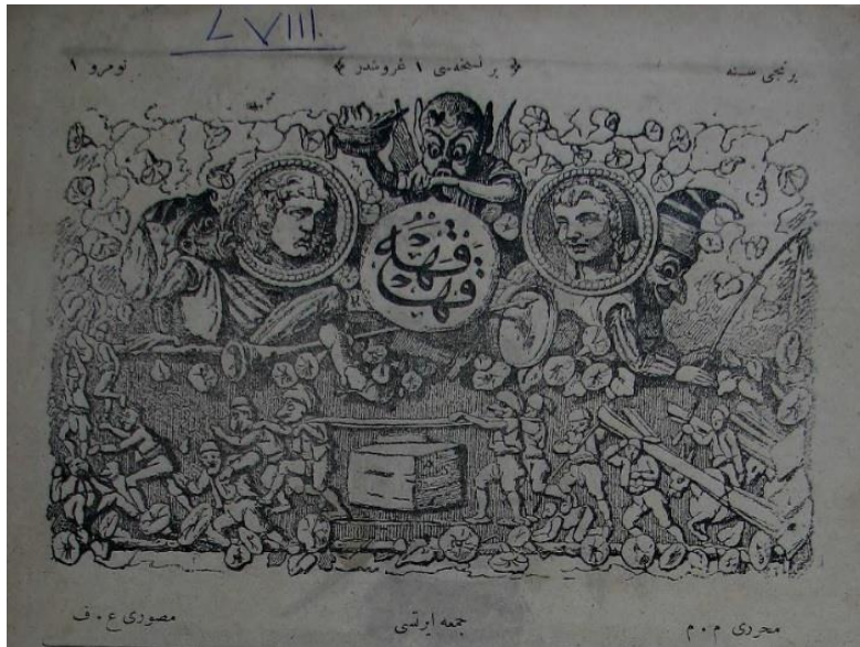
Şekil 3. Kahkaha 'nın Kapak Resmi ( Kahkaha , Nu: 1, 22 Mart 1291)