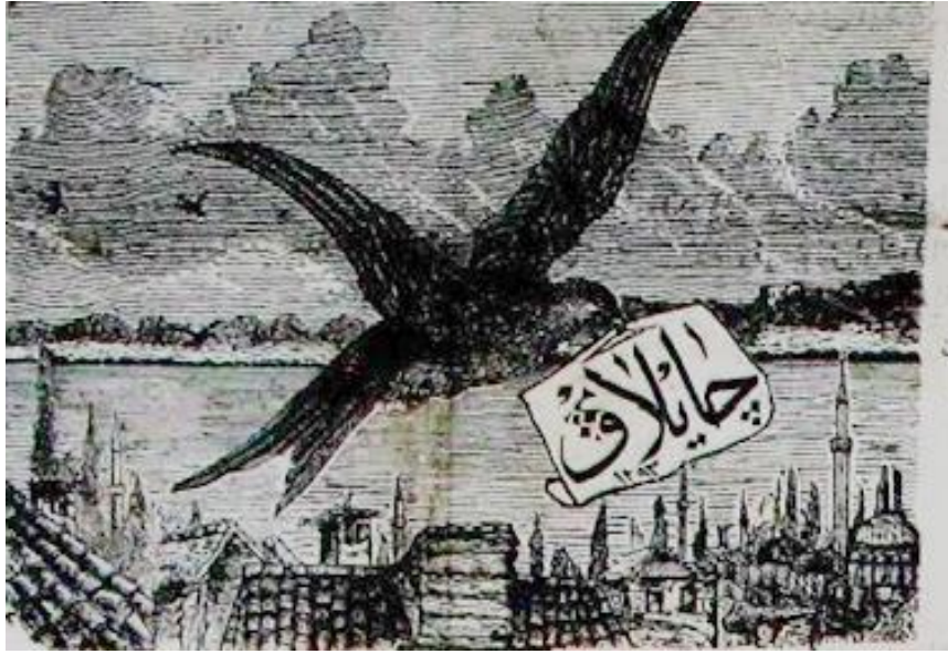
Şekil 4. Çaylak 'ın Kapak Resmi ( Çaylak , Nu: 1 Kânûn-ı Sâni 1292)