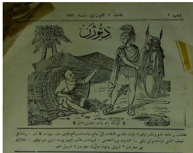
Şekil 1. Diyogen 'in Kapak Resmi ( Diyogen , Nu: 4, 1286, 2 Kânûn-ı Evvel)

1870-77 yılları arasında toplam on beşe yakın mizah dergisi çıkarılmıştır. Bu dergilerin okuyucu kitlesi daha çok Galata ve Pera’nın kozmopolit müşterileridir. Yayınlar, genelde dört sayfa olup küçük forma halinde basılmıştır (Özdiş, 2010: 47). Bu dönemdeki dergilerin boyutları ve fiyatları ne olduğu ile ilgili 1876 yılında yayınlanan Çaylak dergisi örnek verilebilir. Derginin boyu 35 cm, eni ise 25 cm’dir. Başlığının sağ ve sol tarafında seneliğinin 4,5, altı aylığının ise 2,5 Mecidiye olduğu yazılıdır. Senelik posta ücreti ise 2 Mecidiye’dir (Çapanoğlu, 1970: 20).