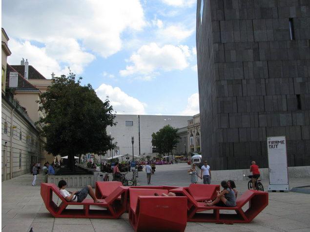
Görsel 19. Yenilenen Strüktürü ve Malzemesi ile MQ Mobilyaları

Avlunun mekânsal pratiğinde önemli bir rolü olan bu değişken kentsel mobilyalar, serbest zamanlarını açık havada ve kentin farklı mimari dokularının bulunduğu bu kültür-sanat alanı MuseumsQuartier'de değerlendirmek isteyen kentliler (ve turistler) için değişik bedensel konforlar sunmaktadırlar (Figür 20).