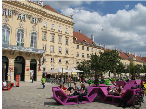
Görsel 5. Viyana Müzeler Avlusu Ve Mekân-Beden İlişkisi