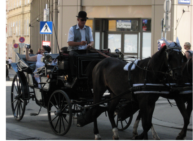
Görsel 1. Viyana’nın Kentsel Hafızasının Dikkat Çeken Elemanları: At Arabaları / Faytonlar (Pherdekutshen)

Bu kamusal mekân, tarihi dokusunu koruyan, ve bu dokuyu oluşturan kentsel nesnelere gündelik yaşamı örtüştürmeye önem veren başkent Viyana’nın merkezi bir bölgesinde yer almakta ve kentsel kültürün önemli parçasını oluşturmaktadır 1 . Örneğin, cadde ve sokaklarının önemli kentsel nesnelere olan geleneksel at arabaları / faytonlar (pherdekutshen), kent gezginleri için bir çekim yaratmanın ötesinde kentsel hafızayı zaman ve mekân ilişkisi bağlamında korumakta, atlar ve sürücülerini gündelik kentsel yaşamın önemli bir unsuru olan trafik akışkanlığının doğal bir parçası olmaktadır (Görsel 1-2-3).