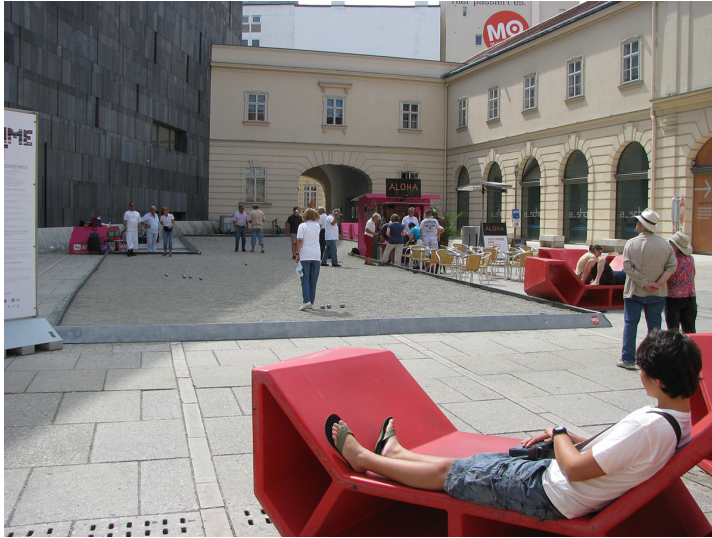
Görsel 14. Mimarlık Merkezine Açılan Yan Avlu