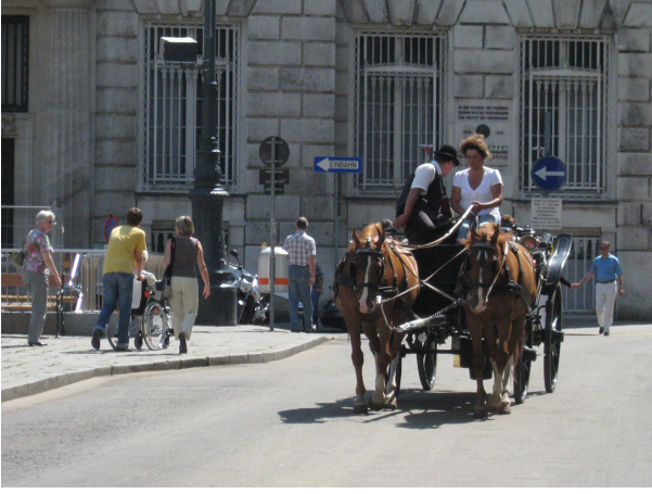
Görsel 3. At arabaları Stephansplatz'ı çevreleyen bölgede yoğunlaşmaktadır.

Viyana'nın kentsel hafızasının ve mekânsal pratiklerin sürekliliğinin temsilcileri olan atlar, bu yazıda ele alınan mekânın hafızasında da sembolik bir konuma sahiptir denebilir. MuseumsQuartier Wien (MQ Wien) olarak bilinen çağdaş sanat ve kültür kompleksi, kraliyetin 18. yüzyıl barok dilini taşıyan ahır kompleksinden (Hofstallgebäude) dönüştürülen bir mimari / kentsel projedir. Şüphesiz, Viyana gibi mekânsal biçimlenmesi mimarlık tarihinin önemli sayfalarını oluşturan kentlere yeni mekânsal öneriler getirmek, bu önerileri mimari olarak hayata geçirmek ve kentlinin mekânsal pratikleri bağlamında öngörülen sosyo-kültürel hedeflere ulaşmak öncelikle kenti doğru okumayı ve iyi çizilmiş yaratıcı bir yol haritası geliştirmeyi gerektirir.