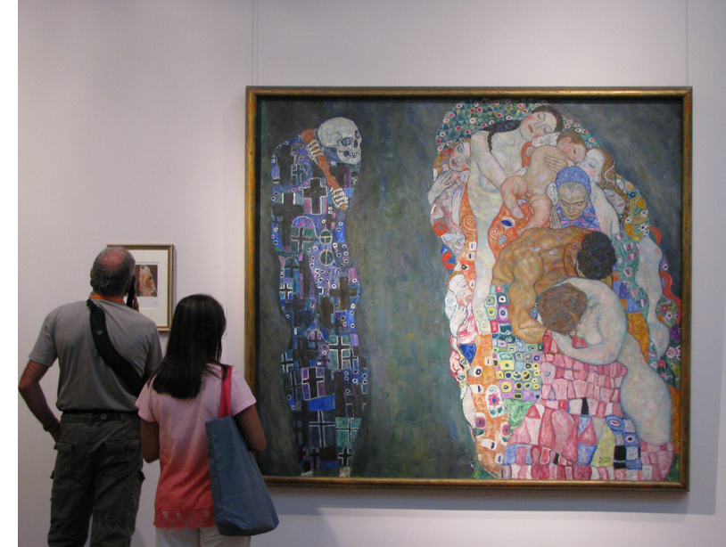
Görsel 9. Leopold Müzesi'nde Viyanalı Sanatçı Gustav Klimt'in Death And Life (1910) Eseri ve Sanat Ziyaretçileri

Kunsthalle Wien ise uluslararası çağdaş sanat sergileriyle öne çıkmaktadır. Leopold Müzesi'nde sergilen Gustav Klimt (1862-1918), Oskar Kokoschka (1886-1980) ve Egon Schiele (1890-1918) koleksiyonu 20. yüzyılın bu çok önemli Avusturyalı sanatçılarının en kapsamlı şekilde temsil edildiği müze olarak bilinmektedir 10 . Özellikle Viyana ile özdeşleşmiş bu sanatçıların eserleri her yıl milyonlarca sanat ziyaretçisinin ilgi odağını oluşturmakta, bu ziyaretçiler aynı zamanda MuseumsQuartier avlusunun da kullanıcısı olmaktadır (Görsel 9).