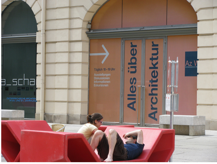
Görsel 13. Mimarlık Merkezi girişindeki yazı: Mimarlık üzerine herşey (Alles über Architektur)

performans mekânları (Tanzquartier Wien), tütün müzesi (Tabakmuseum), mimarlık kütüphanesi, mimarlık merkezi (Architekturzentrum Wien –Az W) gibi geniş bir yelpazedeki işlevlere ev sahipliği yapmaktadır (Görsel 13-14) 11 .