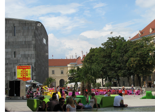
Görsel 18. Avluyu bir 'Oturma Odası' Gibi Kullanan Kentli

bağlamında, dünyadaki benzer kültürel yapı gruplarının oluşturduğu alanlardan daha farklı bir statüye kavuşturmuştur.