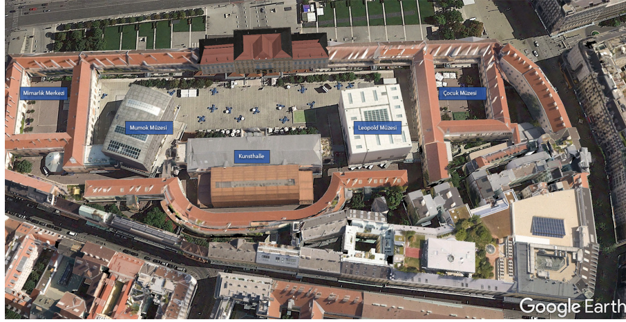
Görsel 7. MuseumsQuartier: Eski Ahır Kompleksi İçinde Viyana Müzeler Avlusu, Yan Avlular, MUMOK, Leopold Müzesi ve Kunsthalle

Ana avluya bağlı daha küçük iç avluları tarifleyen yan cephelerinden biri kentin gündelik yaşamının en hareketli yerlerinden olan Mariahilfer Caddesi'ne (Mariahilfer Strasse) açılmaktadır. Diğer yan kısa cephe Burg Sokağı (Burg Gasse), arka uzun cephe ise birbirine bağlanan Breite ve Karl-Schweighofer Caddelerine (Breite Strasse Karl-Schweighofer Strasse) açılmaktadır. Çok geniş bir alana yerleşen avlunun mekânsal canlılığında, geçirgen bir tektonik yapıya sahip olmasının ve dört farklı yönden değişik kullanımlara ve niteliklere sahip kent parçalarından beslenmesinin rolü büyüktür (Görsel 7).