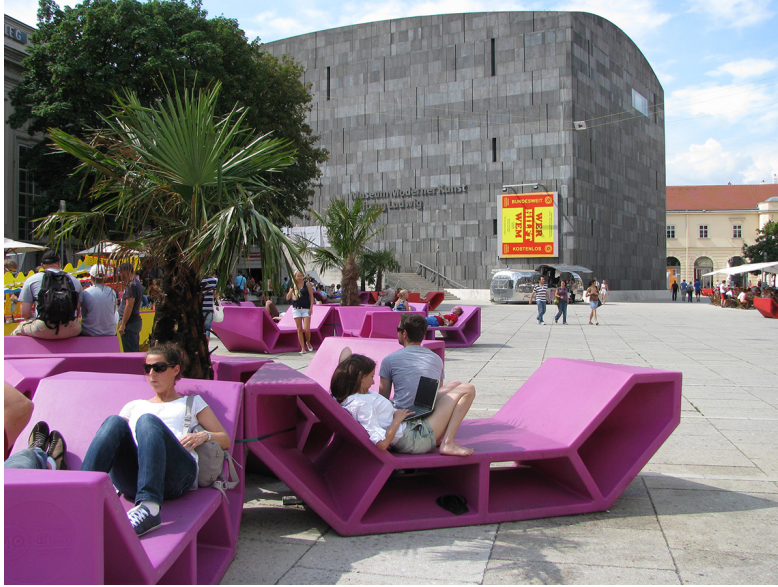
Görsel 11. Viyana Müzeler Avlusu ve MUMOK Museum Moderner Kunst Stiftung Wien

Ana avluyu anlamlandıran başlıca yapılar Kunsthalle Wien, Leopold Müzesi ve MUMOK olmakla birlikte, MuseumsQuartier'in kentsel çeperlerini tarifleyen tarihi yapılarda yer alan zengin kültürel ve sanatsal işlevler farklı kesimleri avluya çekmektedir. Bu çeperlerdeki cadde ve sokaklara bağlanan yarım silindirik biçiminde tonoz örtülü barok pasajlar, edebiyat, sokak sanatı, karikatür, tonal sanat, baskı ve dizgi tasarımı gibi farklı temalarla ana avluya açılmaktadır. Tarihsel pasajlardaki bu temalar değişik ilgi alanları olan kentli gruplarını serbest zamanlarını değerlendirmek üzere bir araya getirmektedir. Sokak, pasaj, avlu, müze gibi farklı ölçek ve biçimdeki kamusal mekânların birbirine bağlanarak kentliye sunduğu yürüyüş sürekliliği ve bu mekânları deneyimleyen bedenlerin kentsel mekânla kurduğu bağ kentsel kültür dinamiklerinde önemli bir rol oynamaktadır. Açık ve kolay erişilebilir bu kamusal mekânların serbest zaman aktiviteleri bağlamında paylaşılması mimari mekânı toplumsal olarak da inşa etmektedir. Yani Lefebvre'in de ima ettiği üzere, en azından mimar kadar, bu mekânı pratikleyen kentli de onun inşacıdır. MuseumsQuartier'in kentsel sürpriz denilebilecek (tarihi yapılarla çevrili) küçük ölçekli yan avluları bu anlamda kayda değer bir mekânsallığa sahiptir. Ana avluyu iki yönden besleyen yan avlular, çocuklara deneysel bir yaklaşımla odaklanıp gözlem yapma yeteneği kazandıran çocuk müzesi (Zoom Kindermuseum), çağdaş dans sanatları ve tiyatro