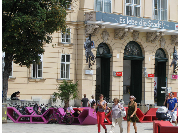
Görsel 4. Viyana Müzeler Avlusu: "Es lebe die Stadt!": Kent çok yaşa!

Viyana Müzeler Avlusu'nun ürettiği kamusal mekân ve kamusal beden ilişkisinin irdelenmesine geçmeden önce söz konusu alanın tarihsel süreklilik içinde mekânsal bilgisini vermek yerinde olacaktır. Aşağıdaki bölümde, alanın monarşiden demokrasiye uzanan toplumsal süreç dinamiklerine bağlı olarak gerçekleşen dönüşümü siyasal, sosyo-ekonomik ve kurumsal olguları içeren bir ardışıklıkla aktarılmaya çalışılacaktır.