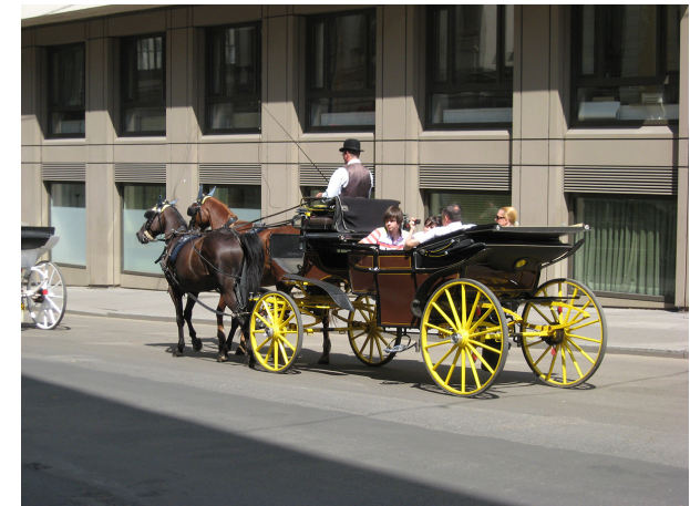
Görsel 2. Viyana Caddelerinde Trafik Parçası Olan At Arabaları