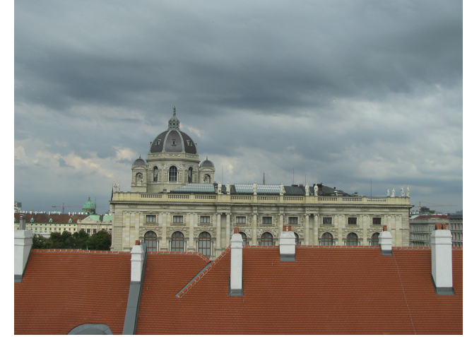
Görsel 15. Leopold Müzesi'nden Çatı ve Göküzü

Kompleksi çevreleyen ve hem ana avlu hem de yan avlulara uzun cepheler veren tarihi yapı grubunun renove edilmesiyle elde edilen mekânlarda sanat-kültür organizasyon merkezleri ve sanatçı stüdyoları bulunmaktadır 12 . Özgün mimari biçimlenmeler aracılığıyla birbiriyle ilişkilenen ve farklı fonksiyonları barındıran yapı gruplarının yanı sıra, modern Leopold Müzesinin üst kattan diğer müzeleri algılamaya olanak sunan tasarımı ile de bu alan kentsel / mimari kurgusu ile yukarıda değinilen "kent parçası olma" argümanının kapsamlı şekilde mekânsallaşmış halidir (Görsel 15-16-17).