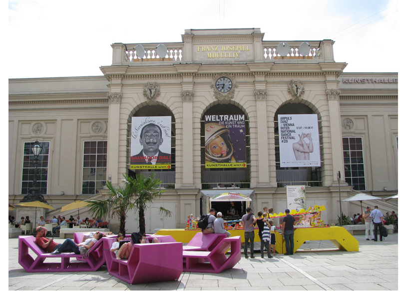
Görsel 12. Viyana Müzeler Avlusu'nda sergi ve etkinlikler için kullanılan Viyana Sanat Merkezi yapısı Kunsthalle Wien