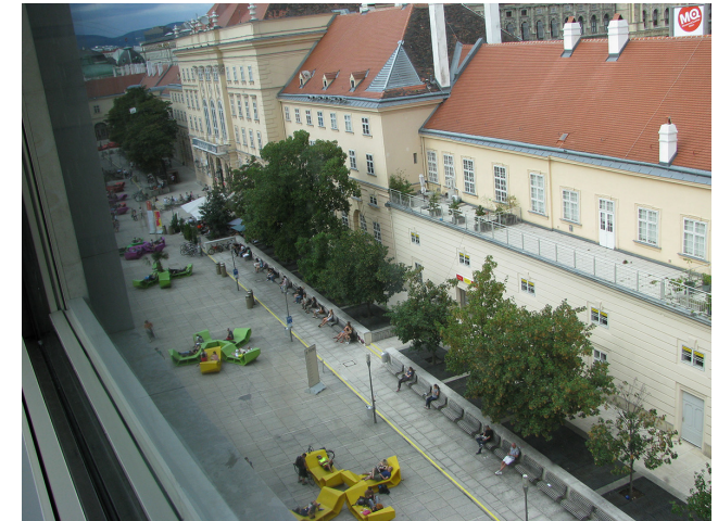
Görsel 16. Leopold Müzesi'nden Avluya ve Eski Ahır Kompleksine Bakış