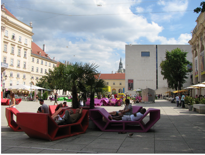
Görsel 10. Viyana Müzeler Avlusu ve sağda Leopold Müzesi