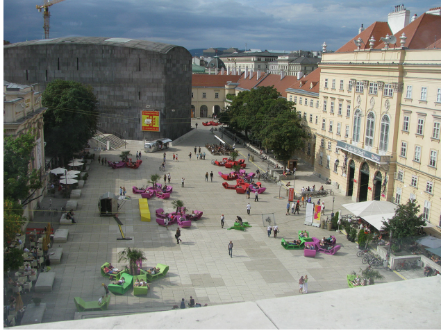
Görsel 17. Leopold Müzesi'nden Avluya Bakış (Solda MUMOK)

Yukarıda değinildiği üzere, burada müze yapılarının temsil ettiği çağdaş mimarlık dili ve yıllar içinde fonksiyonları değişse de 18. yüzyıldan bu yana varlığını sürdüren tarihi doku dramatik bir etki ile buluşmakta; bu buluşma mekâna bir enerji katmaktadır. 18. ve 19. yüzyılda kraliyet at arabalarının, at sulama havuzlarının bulunduğu mekânlarda kentlinin serbest zamanlarını değerlendirmesi ve barok ahır kompleksi içinde MUMOK ve Leopold yapılarının modernist biçimlenmeleri bu enerjiyi gözle görülür kılmaktadır. Ancak, burada vurgulanması gereken önemli bir ayrıntı avlunun sunduğu mekânsal zenginliği arttıran ve yıllar içinde avluyla özdeşleşen kentsel mobilyalardır.