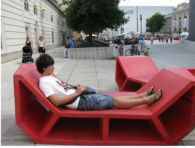
Görsel 19. Yenilenen Strüktürü ve Malzemesi ile MQ Mobilyaları

Avlunun mekânsal pratiğinde önemli bir rolü olan bu değişken kentsel mobilyalar, serbest zamanlarını açık havada ve kentin farklı mimari dokularının bulunduğu bu kültür-sanat alanı MuseumsQuartier'de değerlendirmek isteyen kentliler (ve turistler) için değişik bedensel konforlar sunmaktadırlar (Figür 20).