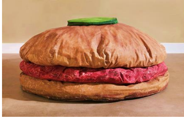
Şekil 1: Claes Oldenburg, Floor Burger, 1962.

Pop Art sıradan olan bir nesnesinin tüketilmesinin yüceleştirilerek insanda bir haz yaratma edimi oluşturur. Bu tüketimin yüceliğinin temsili ise sıradan bir nesneyi büyük ölçekli hâle getirme yaklaşımıdır. Pop Art'ın önde gelen isimlerinden Claes Oldenburg'un büyük ölçekli "Floor Burger" (Şekil 1) isimli heykeli günlük tüketim nesnesi olan bir hamburgerin ticari bir nesne haline gelmesi ile popüler kültürün yüceleştirilmesinin bir eleştirisi olarak algılayabiliriz.