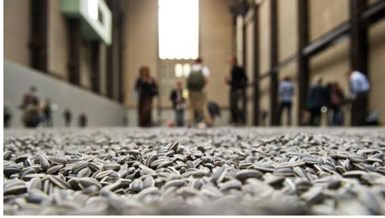
Şekil 5: Ai Weiwei, Ay Çekirdekleri, Tate Modern, London, 2010

Miroslaw Balka'nın devasa metal kutu olan "How It Is" (Şekil 7) adlı çalışması, Edmund Burke'ün yücelik kavramını mükemmel bir şekilde yansıtır. Balka'nın devasa çelik yapısı olan bu çalışma, Burke'ün yüceliğin temel bir yönünü vurguladığı gibi, kontrolümüz veya anlayışımız dışındaki bir şey tarafından tehdit edilmekten kaynaklanan abartılı duyguları tetiklediği ifade edilir.