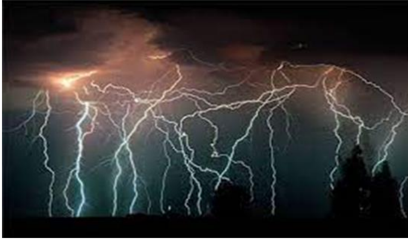
Şekil 2: Walter De Maria, Yıldırım Tarlası, New Mexico,1977.

Ekolojik sanatçılar, doğanın yüceliğini tekrar kazanmak ve insanların doğa ile olan bağlarını güçlendirmek için büyük ölçekli projeler gerçekleştirmişlerdir. Agnes Denes'in "Ağaç Dağı- Yaşayan Zaman Kapsülü" (Şekil 3) projesi, geniş bir alana ağaç dikilmesini içerir. Bu proje, doğanın ve özellikle de ormanın yüceliğini yeniden canlandırmayı hedefler. Ayrıca, insan zihninde sonsuzluğa açılan bir sıralama oluşturarak projenin geniş alanı insanın hayal gücünü ve duygusal derinliğini etkilemeyi amaçlar. Bu tür projeler, insanların doğaya olan bağlılığını ve doğal çevrelerin önemini vurgulamak için güçlü bir araç olarak kullanılır.