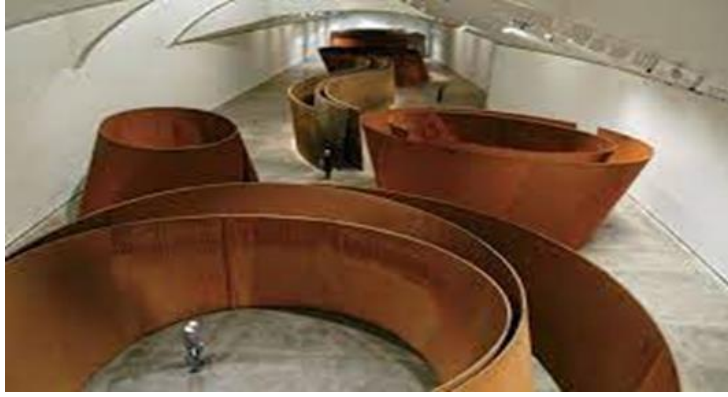
Şekil 4: Richard Serra, Zaman Meselesi, 2005

Ayrıca, "Zamanın Meselesi", yüce kavramının taşıdığı birden fazla etkiyi ortak bir biçimde kullanarak, izleyicilerde derin duygusal ve düşünsel etkiler yaratır. İzleyiciyi, zaman ve mekân algısını sorgulamaya ve içsel bir yolculuğa çıkarmaya teşvik eder. Bu yapıt, izleyicilere fiziksel ve zihinsel bir deneyim sunarak, onları yücelik duygusunun ve sonsuzluğun önemini düşünmeye yönlendirir.