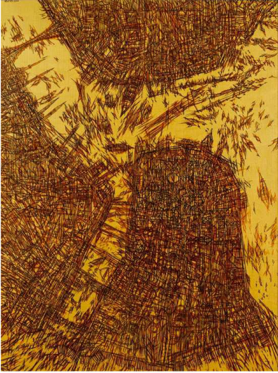
Resim 4. Devrim Erbil, Haliç , 2011, T.Ü.Y.B, 100x150 cm Kaynak: Ersoy, 2013: 24.

Kaynak: https://www.devrimerbil.com/serigrafiler/istanbul-galata/