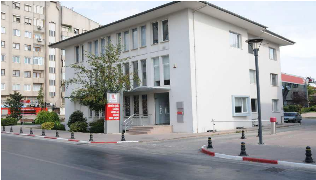
Resim 1. Devrim Erbil müzesi

Türkiye'de 2000'li senelere gelindiğinde özel kurumların ve bankaların bireylerin koleksiyonlarını müze haline getirme eğilimi gösterdikleri dikkat çekici bir durumken, monografik ve tek koleksiyon müzelerinde de artış olduğu görülmüştür. "Burhan Doğançay Müzesi, Devrim Erbil Sanat Müzesi, Şefik Bursalı Müzesi" İstanbul Üniversitesi'nde ki "Feyhaman Duran ve Güzin Duran Müzesi" o dönemdeki monografik müze örnekleri arasında sayılmaktadır (Pelvanoğlu, 2012: 78).