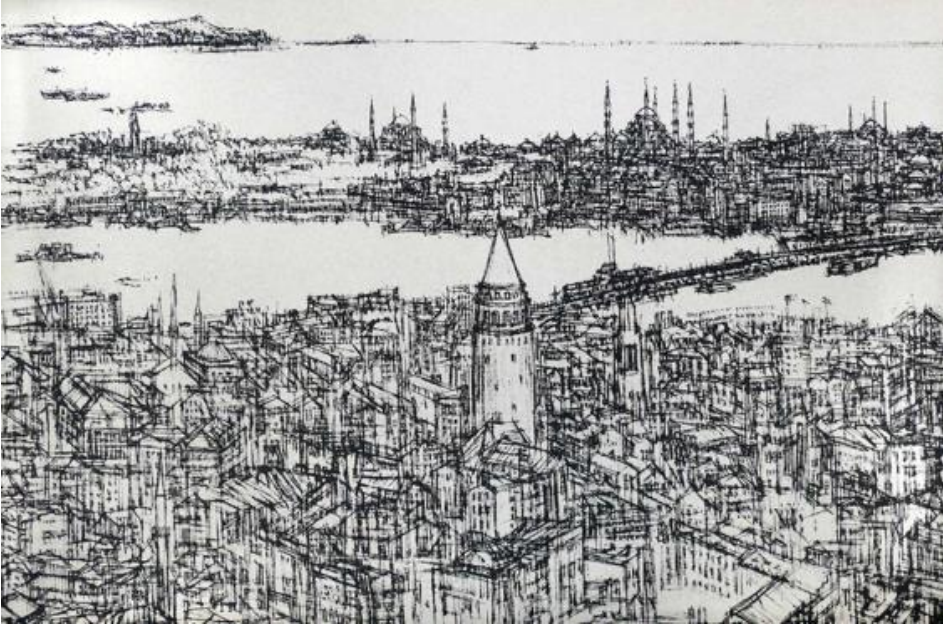
Resim 3. Devrim Erbil – İstanbul ve Galata

Kaynak: https://www.devrimerbil.com/serigrafiler/istanbul-galata/