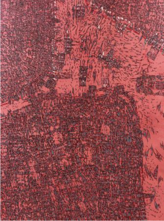
Resim 5. Devrim Erbil, İstanbul’a Bakış

“İstanbul’a Bakış” ismini verdiği bir gravür çalışmasında minyatür etkisinin de hissedilmesinin yanında Erbil onu da benzer şekilde İstanbul’a yukarıdan bakıp resmetmiştir. Sanatçının görüşü bağlamında İstanbul, uzaktan daha güzel görünmektedir. “Sarı-Kırmızı-Mavi” isimli ipek baskı olan eserindeyse Erbil’in 1990’lı senelerde etkilenmiş olduğu pop-art stiline etkileri dikkati çekmektedir. İstanbul’un üzerinde çok sayıda kullandığı kuşlar da ritmik çizgileriyle dikkati çekmektedir.