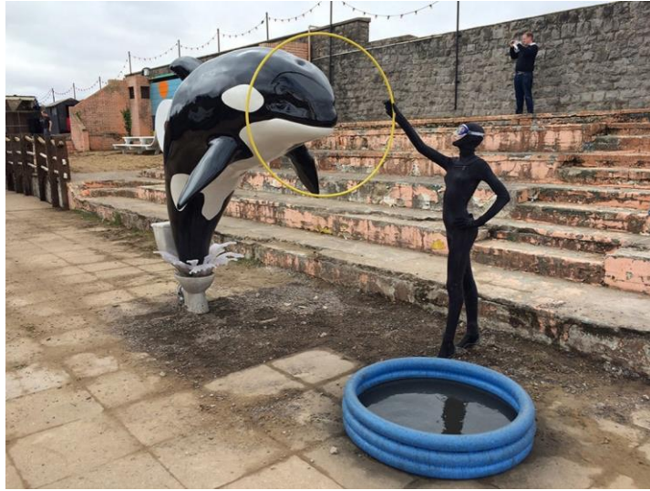
Şekil 7. Dismaland: Plastik su havuzuna atlayan balina

olarak değerlendirilebilir. Dismaland'de yer alan eserler grafiti ve stensil gibi boyama teknikleri yanısıra sanat dışı alanlara, gündelik hayata ait nesnelere de kullanılmasıyla üretilmiş, toplumsal mesajlar içeren kavramsal sanat eserleridir (Görsel 7, 8). Dismaland sergi süresince kalan, geçici bir eğlence parkı olmasına rağmen yenimedya'nın en yaygın kullanılan aracı olan internet sayesinde dünyaya yayılmış, eserler kaldırıldığı halde internet kullanıcıları fotoğraflarına ulaşabilmekte, bir anlamda Dismaland'i yeniden ziyaret edebilmektedirler. Bir bütün sanat eseri olarak bu proje mesajını iletmeye devam etmektedir.