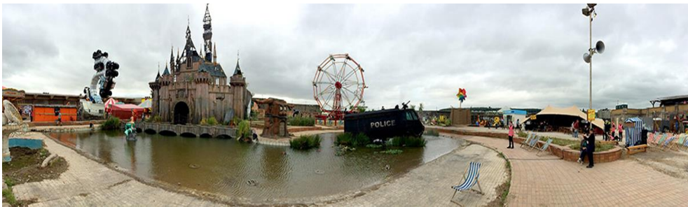
Şekil 8. Dismaland genel görünüm

Dismaland'den 1.5 yıl sonra, Mart 2017'de Banksy, daha önce de grafitileriyle ziyaret ettiği, Filistin'i İsrail'den ayıran Bethlehem duvarı manzaralı The Walled Off Hotel'i (Duvarlarla çevrili), 9 oda ve bir suitten olu-