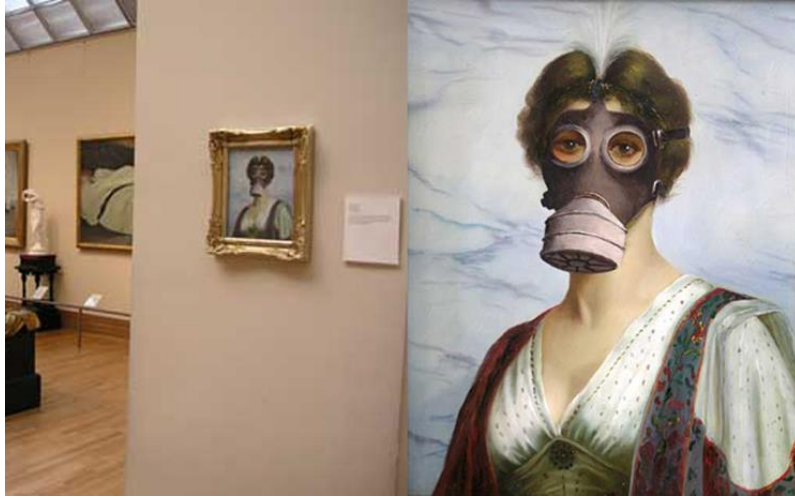
Şekil 5. Banksy'nin New York Metropolitan Sanat Müzesi'ne gizlice yerleştirdiği tablosu (2004)

günlerce fark edilmemiş, Banksy'nin sahte resmi sonradan müze koleksiyonuna alınmıştır. Yıkıcı ve alaycı işlerini New York'taki dört büyük müzenin duvarlarına da gizlice asan Banksy'nin bu dört eserinden ikisi kaldırılmışsa da diğer ikisi yerlerini korumaktadırlar (Şekil 5, 6).