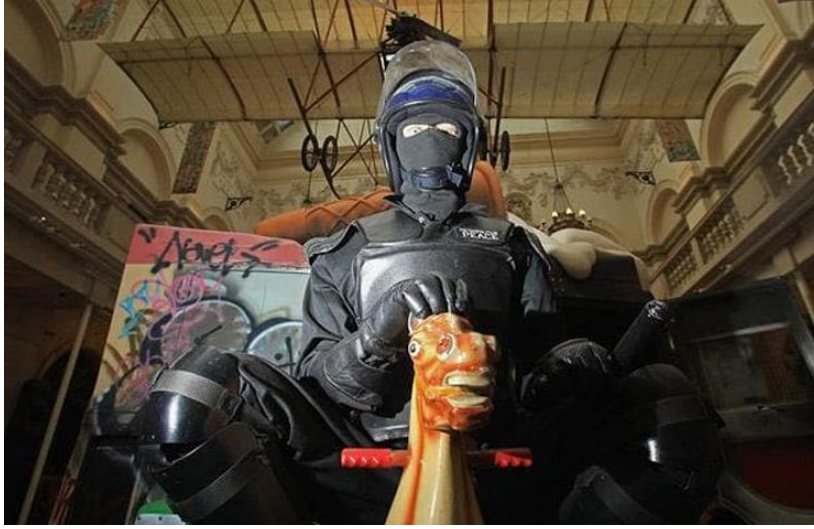
Şekil 6. Banksy'nin "Banksy British Museum'a Karşı" sergisindeki 100 kadar eserden biri; Eylem bastırmak üzere hazırlanmış bir polis memuru, mekanik oyuncak ata binmektedir. (2004)

İsrail güvenlik güçlerinin tehdit ve hatta uyarı ateşine rağmen İsrail ve Filistin arasında yer alan beton duvar, Batı Şeria'daki bariyer üzerine yaptığı çalışmasıyla İsrail politikasıyla ilgili fikirlerini açıklaması ise yine, yeni medya üzerinden yayılarak tüm dünyaya ulaşan bir başka önemli çalışması olmuştur. İnsan yapımı bu fiziksel ve zihinsel duvar üzerine yaptığı küçük kız silüeti, çöp kaplı sokaklardan elinde tuttuğu balonların yardımıyla yükselmektedir. Duvardaki çatlaklar arasından Banksy'nin mavi gökyüzü, oyun oynayan çocuk figürleri ve palmiyeleri görünmektedir. Oturma odası ve açık penceresi izleyicisine, duvarın varlığında ezilmiş ve unutulmuş ev imgesini hatırlatmaktadır (Jones; 2013).