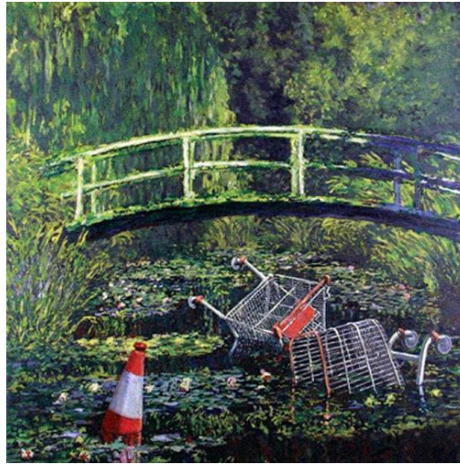
Şekil 3. Banksy'nin Monet'in Nilüferler tablosu yorumu, Show me the Monet (2005)

adaptasyonudur. Banksy'nin Monet yorumunda suda nilüferler yerine çöp ve alışveriş arabası yüzmektedir (Şekil 3).