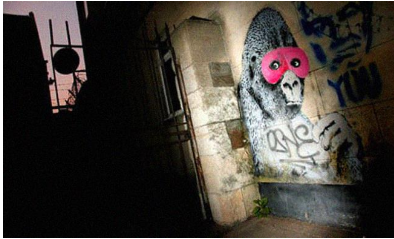
Şekil 1. Pembe Maskeli Goril (WhitewashedBanksy; 2011)

Eserlerinin çoğalmasıyla birlikte artan bilinirliği ve popülerliği sanat galerilerinin, aracı ve koleksiyoncuların dikkatini çekmiş, eserleri maddi değer kazanmaya başlamıştır. Erken dönem işlerinden, Bristol'deki bir sosyal kulübün duvarında on yılı aşkın süre yerini koruyan Pembe Maskeli Goril'in (Şekil 1), binanın el değiştirip Müslüman Kültür Merkezi haline gelmesiyle birlikte "değersiz" olduğu düşünülerek üstü boyanmıştır. İnternet kullanıcıları durumu twitter üzerinden dünyaya duyurmuş, Banksy'nin sanatını içselleştirmiş bölge halkı Banksy'nin haberdar olup yenisini yapmasını istemişlerdir (WhitewashedBanksy; 2011).