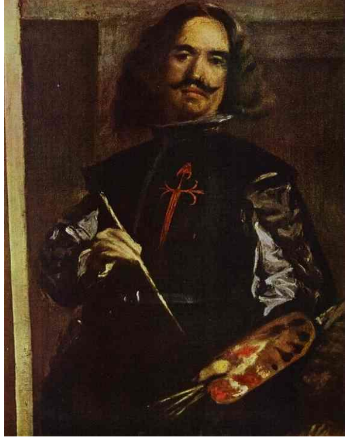
Foto.17: Nedimeler, Nedimeler, Velazquez'in Kendi Portresinden Detay (Seçkin Selvi'den).