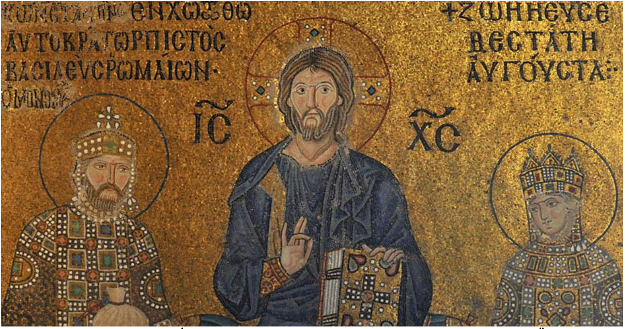
Foto.7: Bizans Dönemi, İsa ve Azizlerin Bulunduğu Monogramın Yer Aldığı Resim Örneği. (Ayasofya'nın Güney Galerisinde İsa, İmparatoriçe Zoi ve İmparator Konstantin VIII Mozaïği).