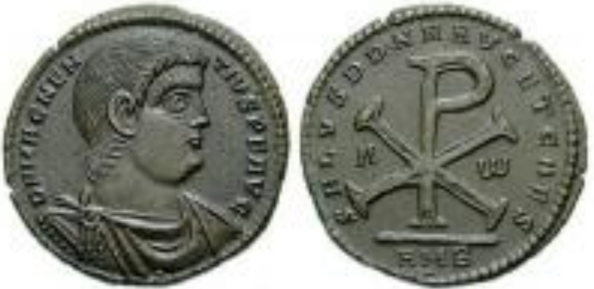
Foto.6: Roma Dönemi Sikkesi, Göğse Kadar İnen Portre Örneği. (Serkan Kılıç'tan).