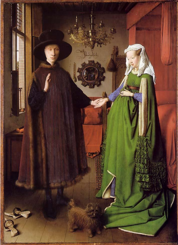
Foto.10: Jan Van Eyck Arnolfini'nin Evlenmesi Tablosu.