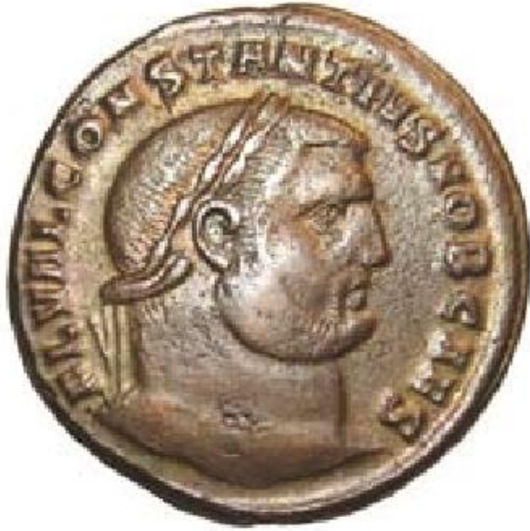
Foto.5: Roma Dönemi Sikkesi, Profilden Portre Örneği. (John A. Cotsonis'den).