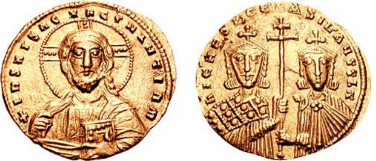
Foto.8: Bizans Dönemi İsa ve İmparator Tasvirli Sikke