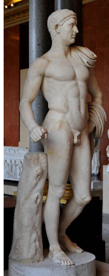
Foto. 4: Roma Dönemi Tam Boy Portre (Heykel) Roma İmparatoru Otho,

https://tr.wikipedia.org/wiki/Vespasian [Eriřim: 20.04.2017].