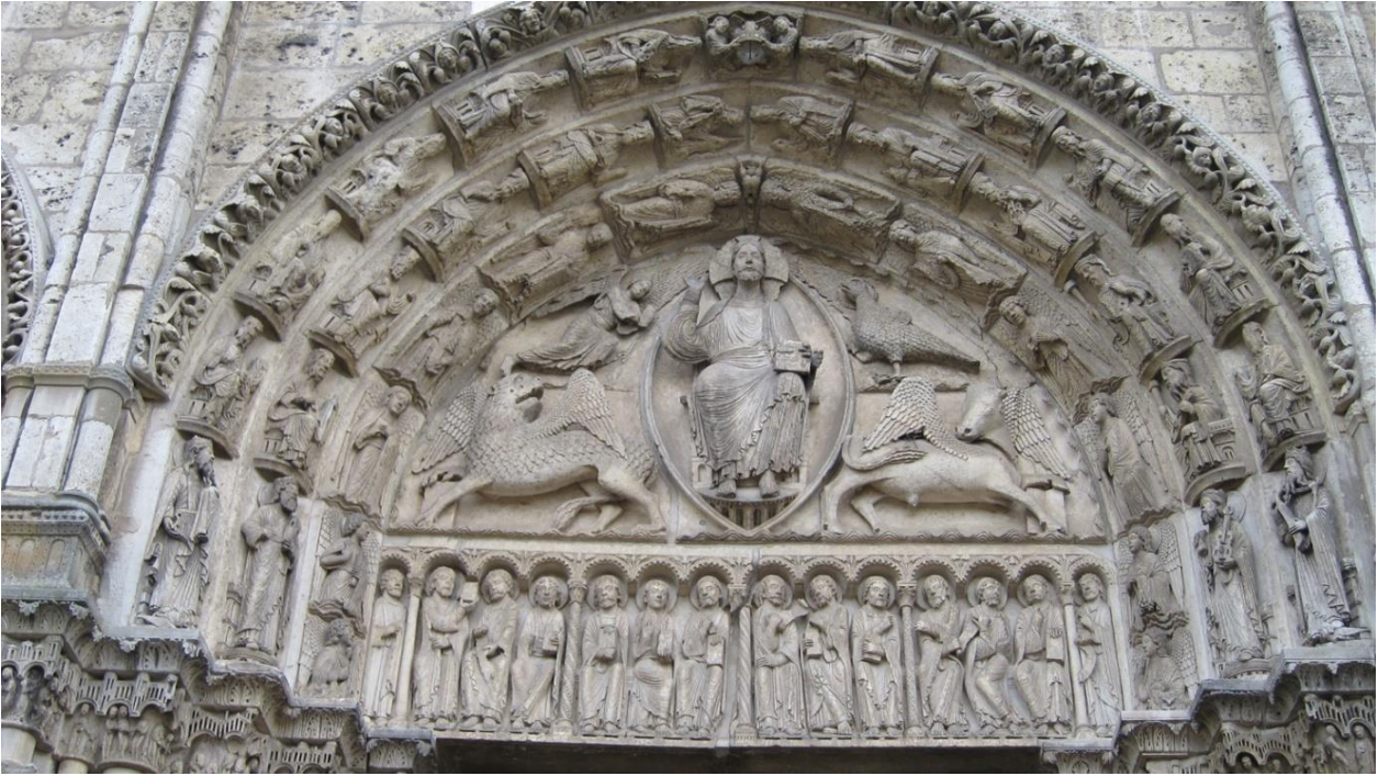
Foto.9: Ortaçağ Dönemi Kilise Cephesinde Bulunan Kilise Kurucusunun Rölyef Portresi ( Chartres Katedrali Batı Giriş Kapısı) https://tr.pinterest.com/pin/210754457534038359/ [Erişim: 20.04.2017].