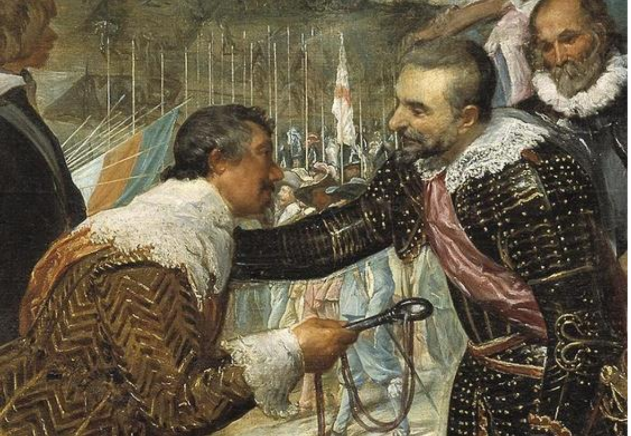
Foto.13: Breda'nın Teslimi Hollandalı Komutan ve İspanyol Generalden ayrıntı.

https://tr.khanacademy.org/humanities/monarchy-enlightenment/baroque-art1/spain/a/velzquez-the-surrender-of-breda [Erişim: 20.04.2017].