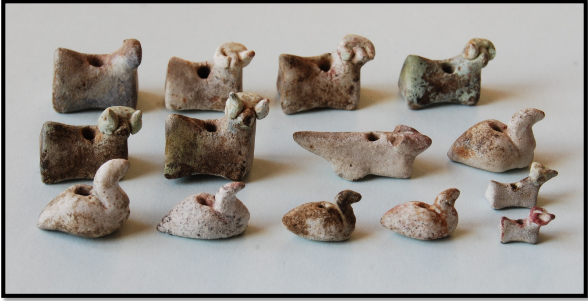
Fig. 2: Figürlü boncukların toplu fotoğrafı

Söz konusu yönetici yapısının ana odasında bulunan bir çanağın içinden 14 adet fayans 5 hayvan figürlü boncuk ele geçirilmiştir. Boncukların 8 adedi koç, 5 adedi ördek ve 1 adedi de tanımlanamayan bir hayvan biçiminde stilize tasvir edilmiştir (Fig. 2).