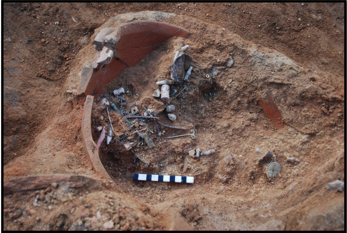
Fig. 1. Boncukların buluntu durumu

Çalışmanın konusunu oluşturan figürlü boncuklar, Seyitömer Höyük V/B evresi'nde höyüğün güneybatısında saray kompleksi olarak adlandırılan yönetici yapısının ana odasında çanak içinde ele geçirilmiştir (Fig. 1). Bu yapı, bir ana oda, bunun önünde bir ön oda ve etrafındaki çok sayıdaki depo odasından oluşmaktadır 2 . Saray kompleksinde toplam 13 oda yer almaktadır. Bu odalarda, 1'i ana oda ve 4'ü küçük odada olmak üzere toplam 5 adet boğa başlı ocak bulunmaktadır. Oda içlerinde yer alan boğa başlı ocaklara dayanarak bu odaların yaşam alanı diğer odaların ise depo odası olduğu düşünülmektedir 3 . Saray olduğu düşünülen yapının oldukça büyük bir alanı kapsadığı, dolayısıyla sadece buluntuları bağlamında değil aynı zamanda mimari anıtsallığı ile de önemli bir yapıyı işaret ettiği anlaşılmaktadır. Ayırt edici yapısal niteliklerinin yanı sıra diğer mekanlarda karşılaşılmayan, değerli ve sıra dışı buluntuları nedeniyle bu yapı kompleksinin diğer yapılardan ayrıcalıklı bir kullanım gördüğü önerilebilir. Kompleksin ana odasında çanak çömlek buluntularının yanı sıra altın, gümüş ve bronzdan yapılmış saç iğneleri, kolye, rozet gibi takılar, boncuklar ve Mezopotamya kökenli 10 adet Akad silindir mührü gibi oldukça önemli buluntular tespit edilmiştir 4 .