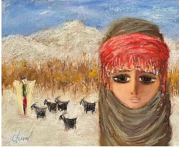
Görsel 1. Fikret Otyam, Çoban ve Sürüler, 24x29 cm, Karton Üzerine Pastel Boya, 1993.

Gazeteci, yazar, şair ve ressam olan Fikret Otyam, ortaya koyduğu eserler ve emekli olduktan sonraki döneminde kırsalda sürdürdüğü hayat ile Çağdaş Türk resminde farklı bir yer edinen sanatçılar arasındadır. 1926 yılında Aksaray'da doğan sanatçının yaşamında sanat ve gazetecilik bir arada ilerlemiş, siyaset, sosyoloji, kültür ve sanat alanlarında birbirinden farklı eserler vermiştir.