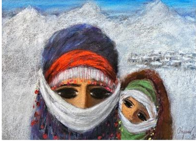
Görsel 2. Fikret Otyam, Anne ve Kızı, 30x40 cm, karton üzerine pastel, 1996.

Kadın portrelerinde gözlerin büyüklüğünün yanında burun ve ağız küçük olarak betimlenmiştir. Bu biçim algısı, figürlere daha saf bir duygu ve sakin bir izlenim yansıtırken imgeye çocukçu ve sevimli bir karakter vermektedir. Zaman zaman Türk halk resminde de göndermelerde bulunan bakış açısıyla, resim kompozisyonunda yer alan kadın ve keçi gibi imgeler, folklorik motifler gibi sade ve yalın bir biçimle yapılırlar ve tüm öğeler uyumlu olarak özgün bir armoniyle bütünleşir. Otyam'ın sadeliğe ve duyguya yoğunlaştığı ve biçim dilinin içten ve samimi olduğu söylenebilir.