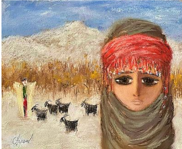
Görsel 1. Fikret Otyam, Çoban ve Sürüler, 24x29 cm, karton üzerine pastel boya, 1993.

Gazeteci, yazar, şair ve ressam olan Fikret Otyam, ortaya koyduğu eserler ve emekli olduktan sonraki döneminde kırsalda sürdürdüğü hayat ile Çağdaş Türk resminde farklı bir yer edinen sanatçılar arasındadır. 1926 yılında Aksaray'da doğan sanatçının yaşamında sanat ve gazetecilik bir arada ilerlemiş, siyaset, sosyoloji, kültür ve sanat alanlarında birbirinden farklı eserler vermiştir.