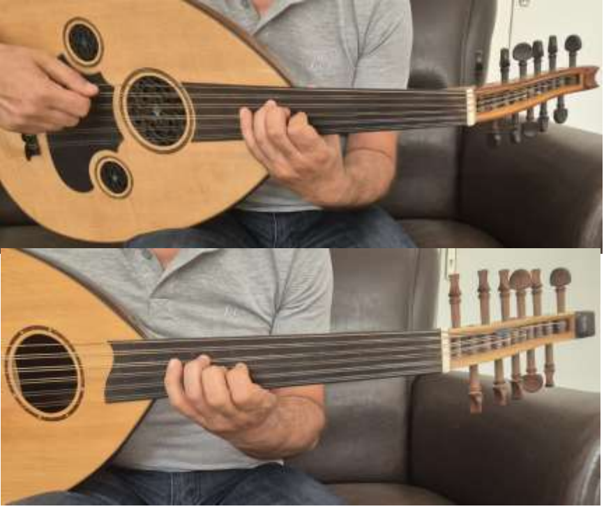
Fotoğraf 2: Standart ud ve Targan ud pozisyon karşılaştırma görüntüleri.