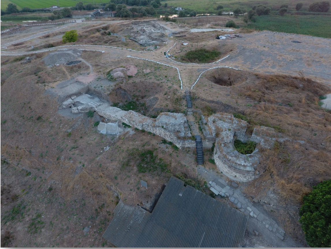
Resim 12. Orta Çağ kalesi.