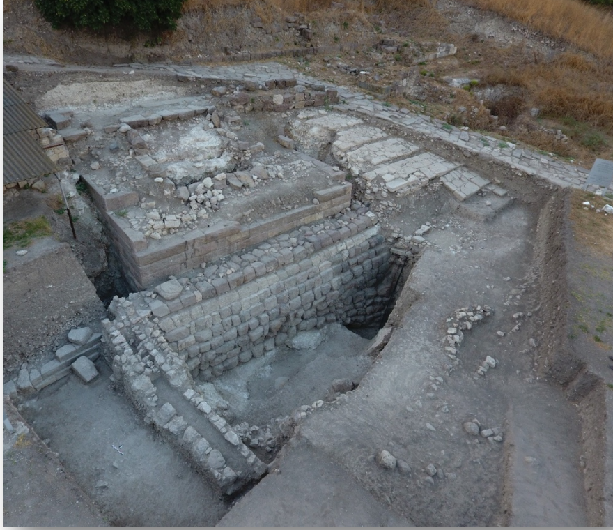
Resim 6. Glacis .