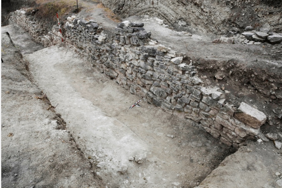
Resim 3. Phryg Dönemi'ne ait sur.