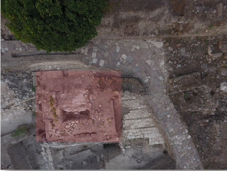
Resim 10. Kare planlı yapı.