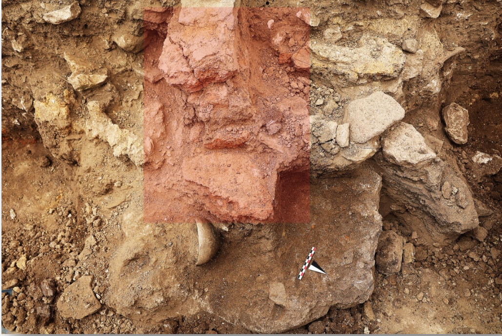
Resim 4. Lydia mutfağında ele geçen ocaklardan biri