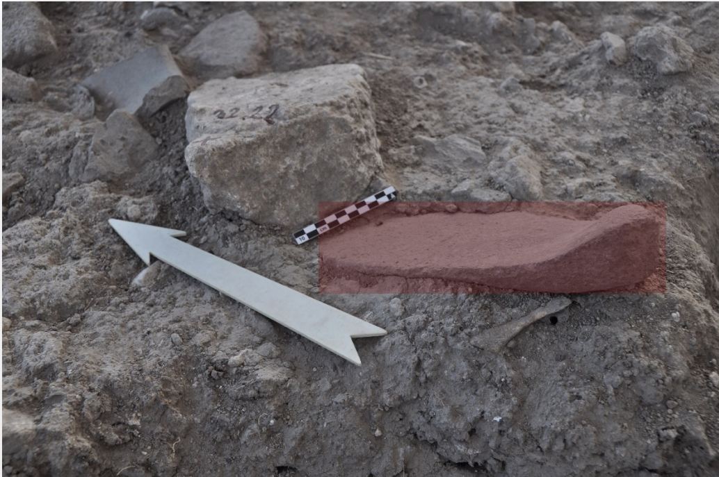
Resim 5. Ezme taşı