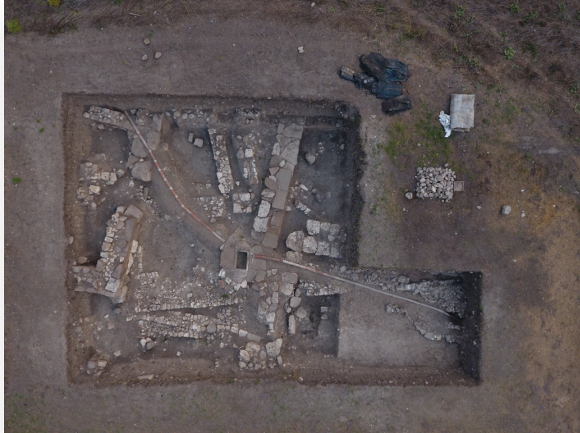
Resim 9. Aşağı şehirde açığa çıkarılan künk hattı ve yapılar.