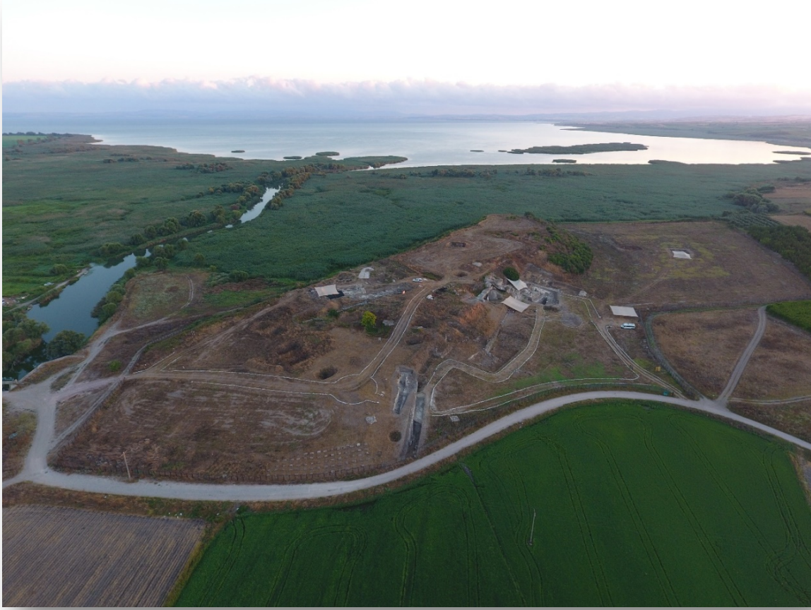
Resim 1. Güneydoğu'dan Daskyleion ve Manyas Gölü'ne bakış.