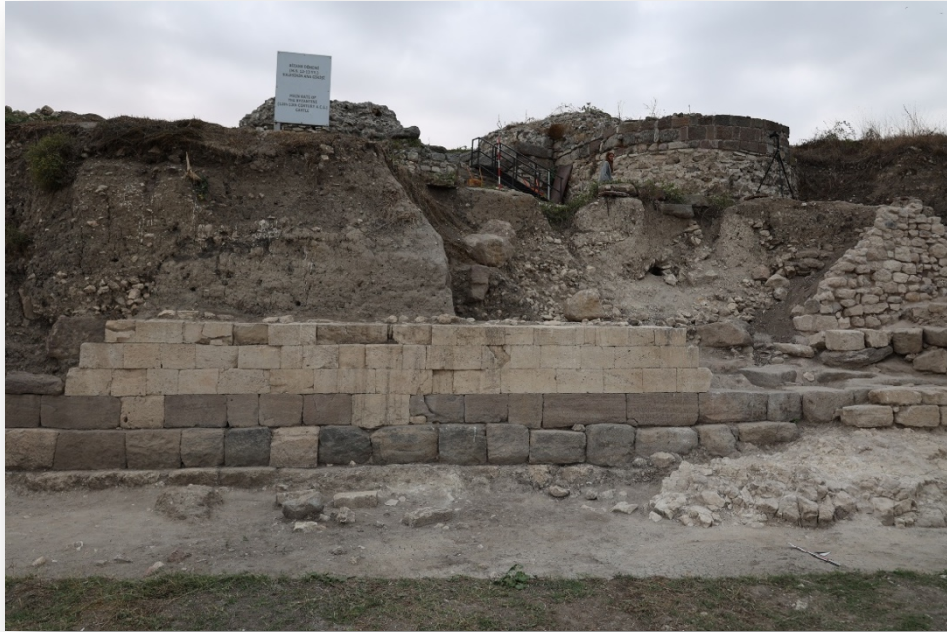
Resim 7. Pers Dönemi sur duvarı.