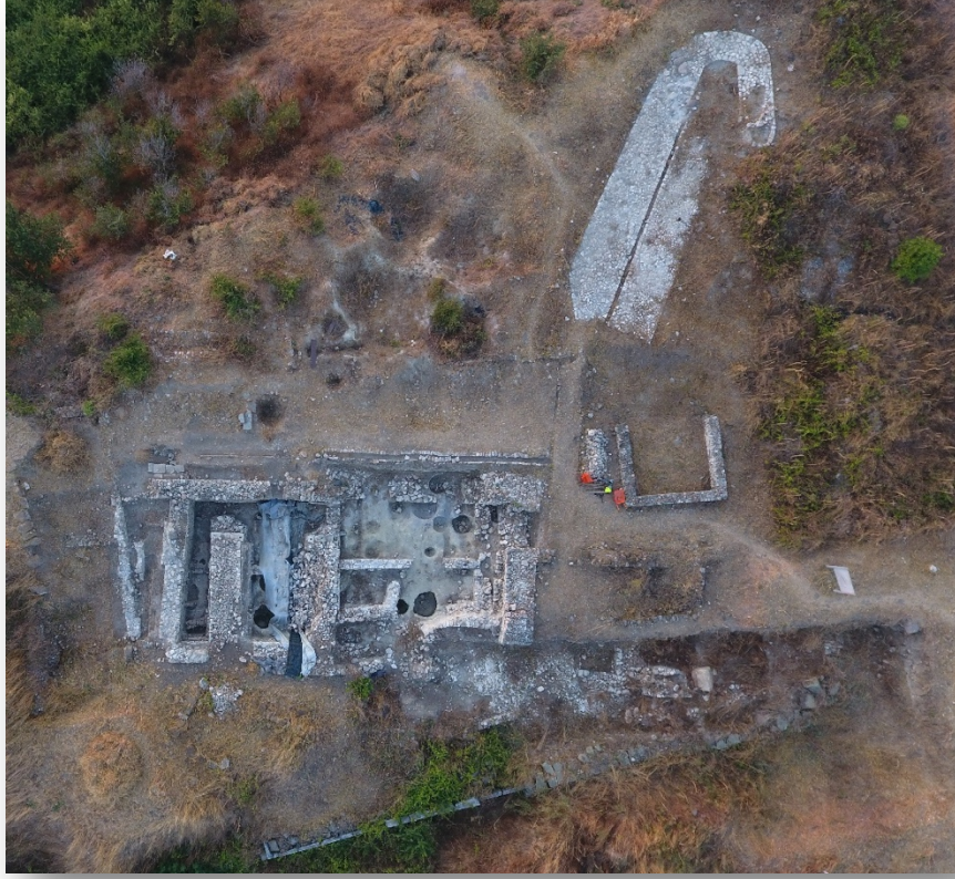
Resim 8. Kült yolu, üç odalı yapı ve döşemeler.