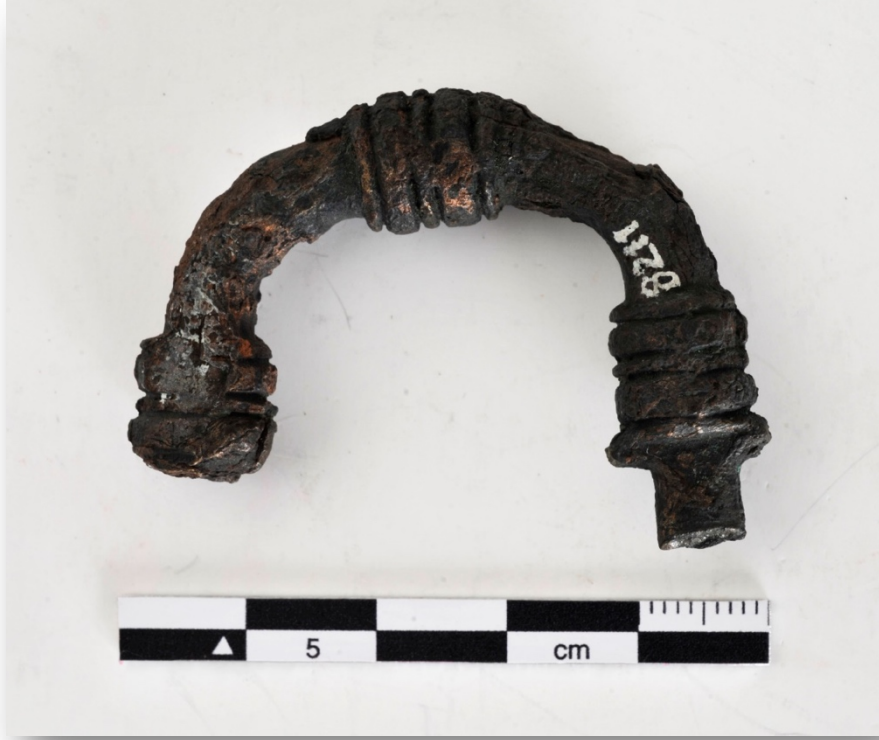
Resim 2. Phryg tipi fibula.