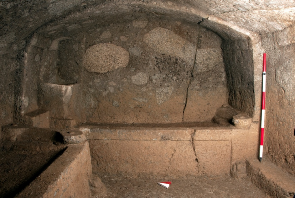
Resim 11. Kaya Mezarı II.