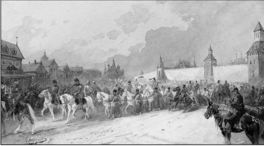
Ek 1: Rus Ressam N. N. Karazin'in "Küçüm Han'ın Esir Edilen Ailesinin Moskova'ya Girişi 1599" adlı tablosu.