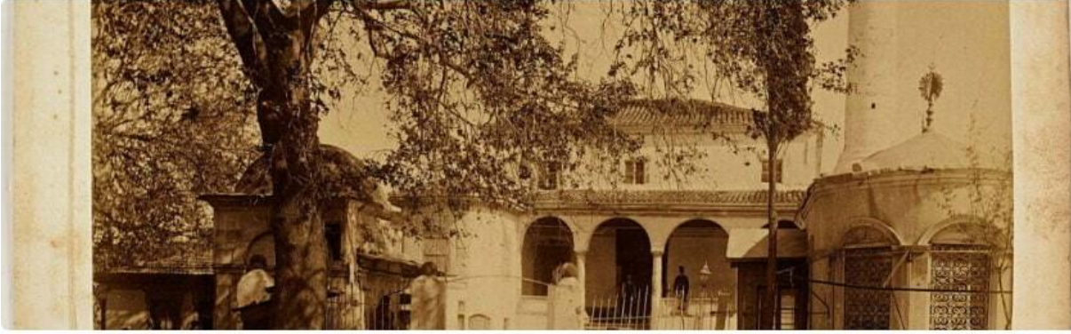
Resim 1. Sakız Adası'nda Bulunan Mecidiye Camisi'nden Bir Görünüm.

üzerine inşa edilmişti 5 . Mecidiye Cami-i Şerifi Vakfı tarafından camiye sadaka olması amacıyla inşa olunan budükkânlar,iskele yakınında ve Sakız Kalesi'ne zarar vermeyecek şekilde inşa edildikten sonra taliplilerine kiralanmıştı. Bu dükkânların muaccesi 1847 yılında 74,665 kuruşu bulmaktaydı 6 . Bu dükkan ve mağazalar icare-i vahideli 7 olarak vakıf tarafından işletilmekteydi 8 .