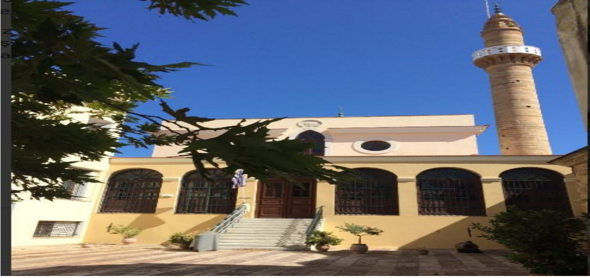
Resim 5. Mecidiye Camisi'nin Günümüzdeki Görünümünden Bir Kesit.

aşamatamamlanmaya çalışılmışve budoğrultuda muvakkithane için 2.800 kuruşa bir saat, devirhanların camide Kur'an okuması için ise bir sahaf esnafı olan Sivrihisarlı Hüseyin Efendi'den bir Mushaf-ı Şerif satın alınmıştır. (Deniz, 2015:57.). 1881 yılına gelindiğinde ise caminin 12 müezzin görevi bulunmakta olup vakıf tarafından müezzinlere aylık 100 kuruş ücret ile günlük bir çift fodula ismi verilen ekme verilirdi. Müezzin sayısının çok olması camide müezzinlik dışındaki diğer işlerin de müezzinler tarafından görülmekte olması ihtimalini akla getirmektedir.1891 yılında camide bulunan başlıca makamlar, vaizlik, hitabet, imamet, imam-ı sani, iki adeddevirhanlık, dersiamlık, müezzinlik, müezzin-i sânilik, naathanlık, tarifhanlık 22 , kayyımlik, ferraşlık, muvakkitlik idi 23 . Bu durum camideki görevli sayısının, açılıştan sonra zaman içerisinde çeşitli nedenlerle arttığını göstermektedir 24 .