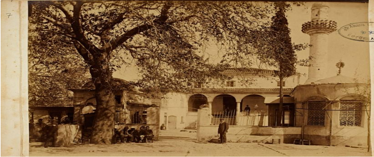
Resim 2. Osmanlı Dönemi Mecidiye Camisi'nden Başka Bir Görünüm.

Mecidiye Camisi'nin üç tarafı avlu duvarı ile çevrilmişti ki bu duvar toplam 22.5 zira (17 metre) uzunluğundaydı. Binek taşları kullanılarak avluya bir kapı inşa edilmişti. Buna ilave olarak avlunun içinde, abdest almak isteyecek cemaat için 12 musluklu beyaz mermerden bir çeşme yaptırılmıştı. Avlunun kenarında ise ibadet vakitlerini tayin etmek için bir tane muvakkithane bina edilmişti. 27 Mart 1860 tarihinde caminin muvakkitlik görevi aylık 30 kuruş ücret ile ada sakinlerinden Hikmet Efendi'nin üzerindeydi 10 . Bütün bu inşa faaliyetinin toplam masrafı 92.288 kuruşu bulmuştu 11 . İnşaatin büyük bölümü, 12 Kasım 1848 tarihine kadar tamamlanmıştır. Bu süre zarfında kereste, çivi, taş, kum ve diğer malzemeler için 47.999 kuruş, inşaat ameleleri ücreti olarak 47.985 kuruş, minare içinse 9.829 kuruş olmak üzere 105.854 kuruş harcanmıştır. İnşaatin başlangıcından 12 Kasım 1848 tarihine kadarki harcamalar 206.127 kuruşa ulaşmıştır (Deniz, 2015:51).