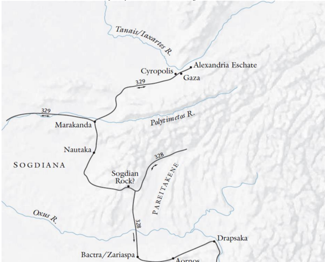
Harita 3. İskender'in Asya Seferi Sırasında Ulaştığı Son Nokta (Romm, 2012:152)

İskender bu şehire vardıktan sonra kentin hemen kuzeyinde akan Sırderya Nehri boylarına Makedon ordusunu karşılamak için gelen Sakalar ile hesaplaşmak amacıyla ırmağın öte tarafına geçmiş ve okçu ve süvarilerin yardımı ile Sakaları yenilgiye uğratmıştı. Milattan