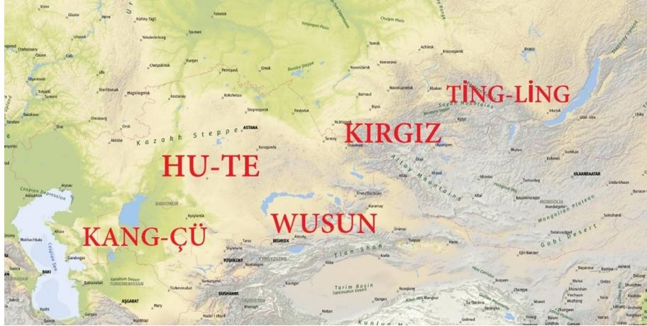
Harita 2. Weilüeh'e Göre Hu-te Topluluğunun Yurdu (Şengül 2023:118)