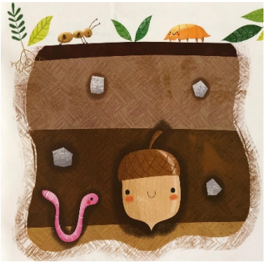
Resim 6: Sabır, Küçük Meşe Palamudu