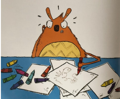
Resim 7: Sorumluluk, Her İsteddiği ...