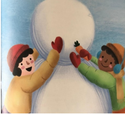
Resim 1: Dostluk, Küçük Kar Tanesi

Resimli çocuk kitaplarında yer alan değerlere ait görseller aşağıda verilmiştir.