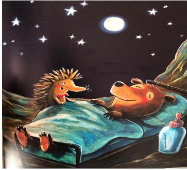
Resim 14: Dostluk, Hayvanat ...