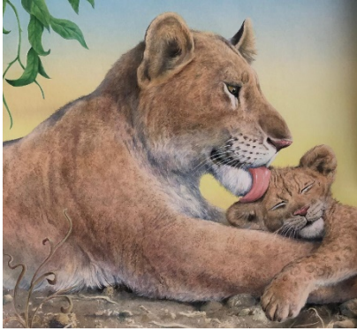
Resim 4: Sevgi, Seni Seviyorum Miniğim