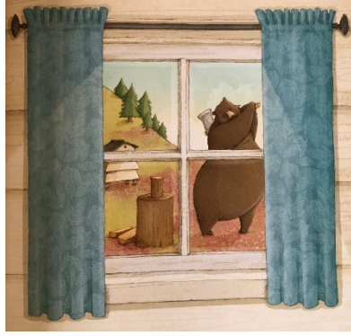
Resim 2: Sorumluluk, Şu Yaramaz ...