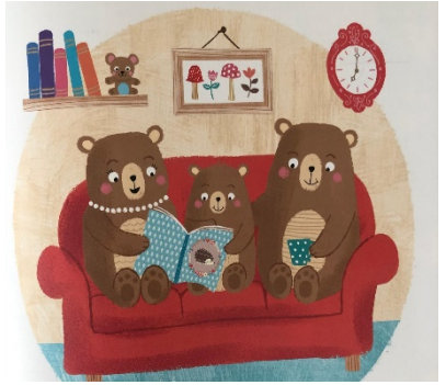
Resim 15: Sevgi, Sevginin Gücü

Resimli çocuk kitaplarındaki görseller incelendiği zaman on kök değerden dostluk değerine bakıldığında, kitaptaki karakterin arkadaşlarıyla birlikte yaptığı etkinlikler ve oyunlar görselleştirilerek dostluk değeri vurgulanmıştır. Resimlerdeki sorumluluk değeri incelendiğinde, kitaptaki karaktere öncesinde söylenen, verilen görevi yapması sonucunda kitaptaki karakterin sorumluluk bilincine sahip olduğu görsellerde yansıtılmıştır. Yardımseverlik değerine bakıldığında, karakterlerin hangi konuda olursa olsun birbirlerine yardım etmeleri görsellerde vurgulanmıştır. Sevgi değeri incelendiğinde karakterin arkadaşlarının ve ailesinin sevgisinin yansıtıldığı görülmektedir. Sabır değeri ise sadece bir resimli çocuk kitabının görsellerinde yansıtılmış olup karakterin sabretmesi sonucunda güzel şeylerin olacağı yansıtılmıştır.