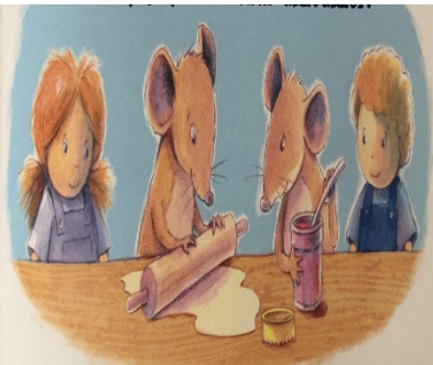
Resim 8: Yardımsverlik, Dedektif ...