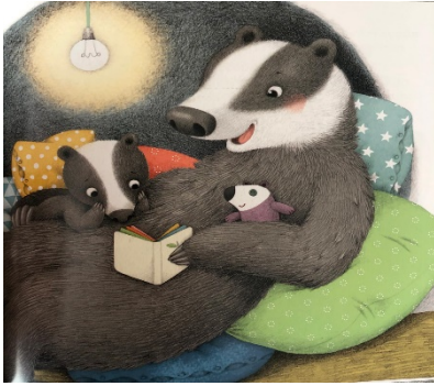
Resim 13: Sevgi, Uykusu Gelmeyen ...