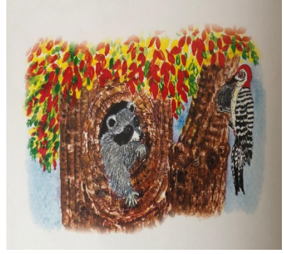
Resim 12: Dostluk, Avucundaki Öpücük