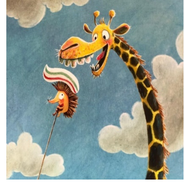
Resim 3: Yardımsverlik, Hayvanat ...