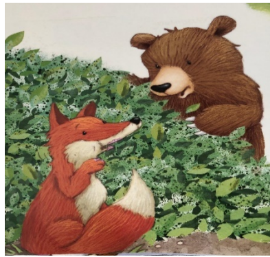
Resim 5: Yardımsverlik, Paylaşmak ...