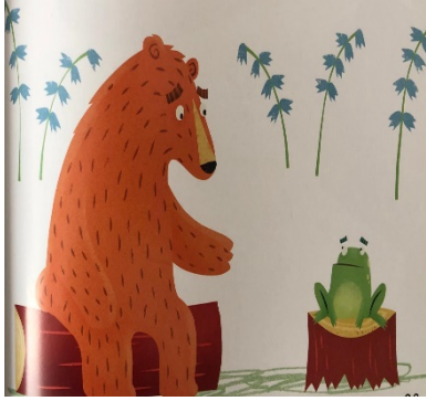
Resim 11: Yardımseverlik, Utangaç ...