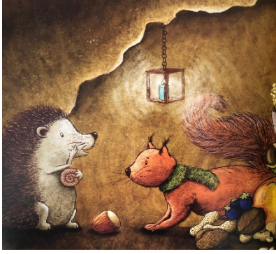
Resim 10: Yardımseverlik, Yemek Seçen...