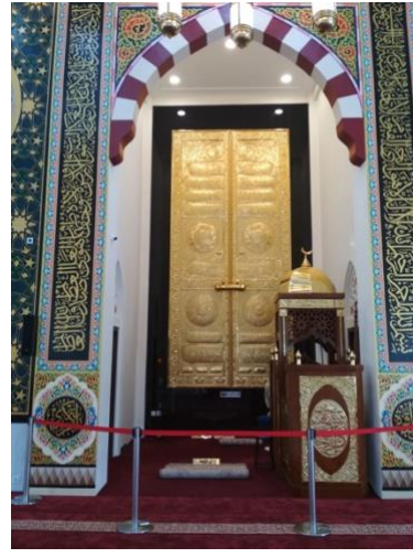
Şekil 17: Keuchik Leumik Camii mihrabı. 35