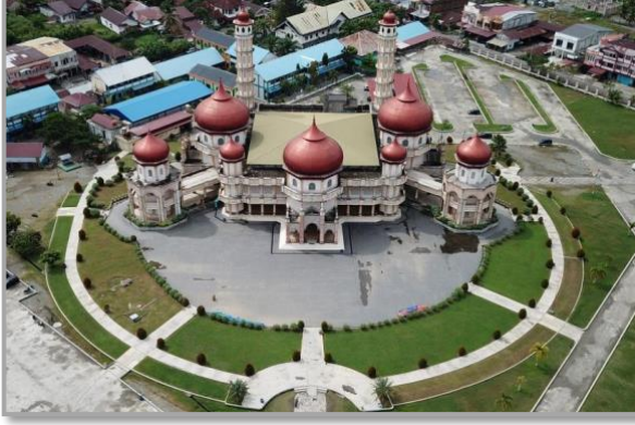
Şekil 9: Baitul Makmur Camii yukarıdan görünüşü 25

1980'li yıllarda inşa edilen bu cami, Arap, Hint ve Açe mimari tarzlarının sentezini yansıtmaktadır. Oldukça farklı bir planı olan bu yapıda, üst örtüde üç adet büyük kubbe ve dört adet küçük kubbe kullanılmıştır. Bu kubbelerin hepsi soğan kubbe şeklindedir. Kare planlı orta mekânın üzeri ise hafifçe yükseltilmiş düz örtü ile kapatılmıştır. Camiye giriş, silindir şeklinde ve dışa taşkın olup üzeri soğan kubbeye örtülü bölümden sağlanır. Mihrap duvarının iki köşesinde ise iki minare bulunmaktadır. Mimari açıdan Beytürrahman Camii'ne benzediği görülmektedir.