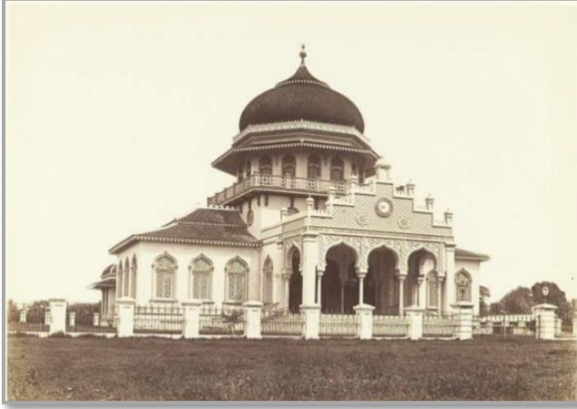
Şekil 2: 1882-1908 yılına ait fotoğrafı 17

Mimarî açıdan Moğol, Hint, İslâm ve Avrupa sentezi olan bu cami, farklı dönemlerde savaşlar sebebiyle yakılıp yıkılmış, tekrar yenilenmiş ve restore edilmiştir. 2004 tsunami felâketi sırasında Banda Açe'de birçok bina yerle bir olurken, dalgalar tarafından sürüklenirken, ayakta kalan az sayıdaki yapıdan biri olmuştur.