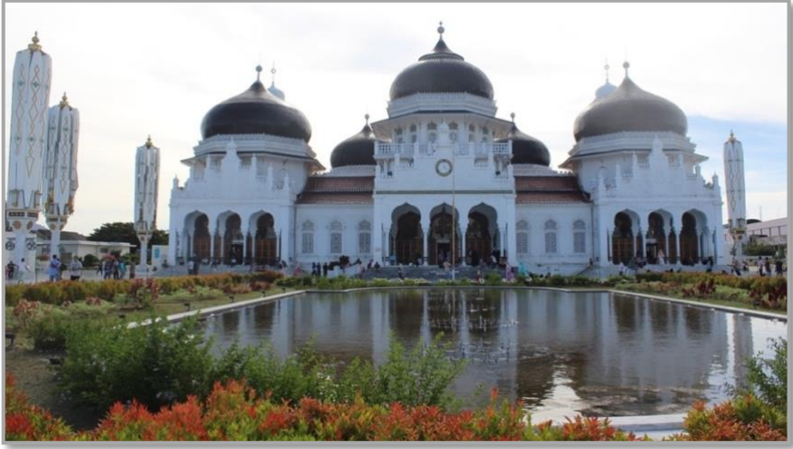
Şekil 5: Beytürrahman Camii avlusu 20