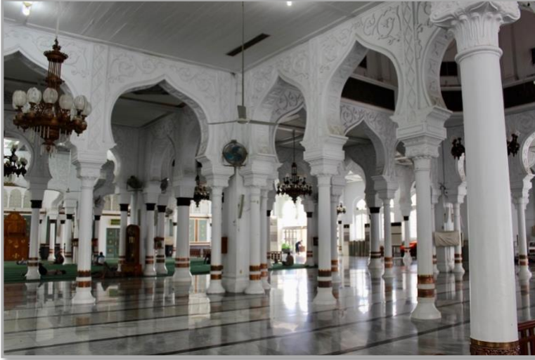
Şekil 3: Beytürrahman Camii iç mekân. 18

Mimarî açıdan Moğol, Hint, İslâm ve Avrupa sentezi olan bu cami, farklı dönemlerde savaşlar sebebiyle yakılıp yıkılmış, tekrar yenilenmiş ve restore edilmiştir. 2004 tsunami felâketi sırasında Banda Açe'de birçok bina yerle bir olurken, dalgalar tarafından sürüklenirken, ayakta kalan az sayıdaki yapıdan biri olmuştur.