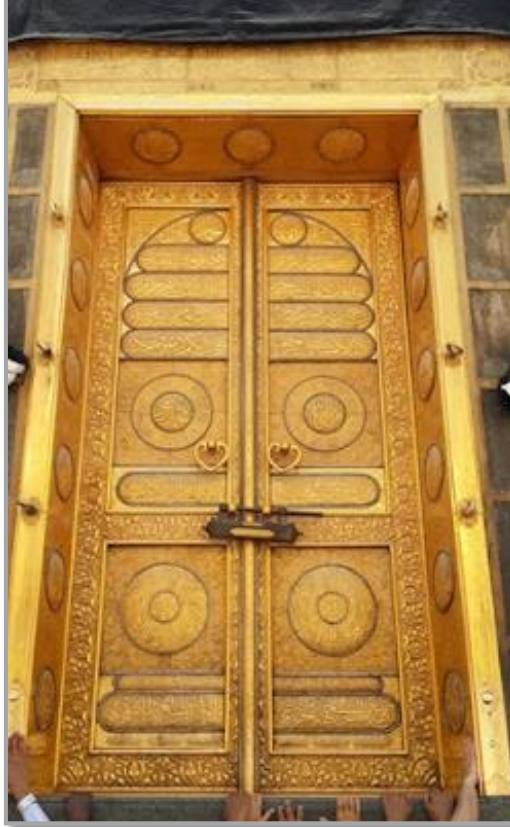
Şekil 15: Kâbe-i Muazzam'a kapısı. 33

Kâbe Kapısı şeklindeki mihrab yapımı, Açe'nin bölgedeki konumu ve "Mekke Kapısı" adıyla ilişkilendirilmektedir.