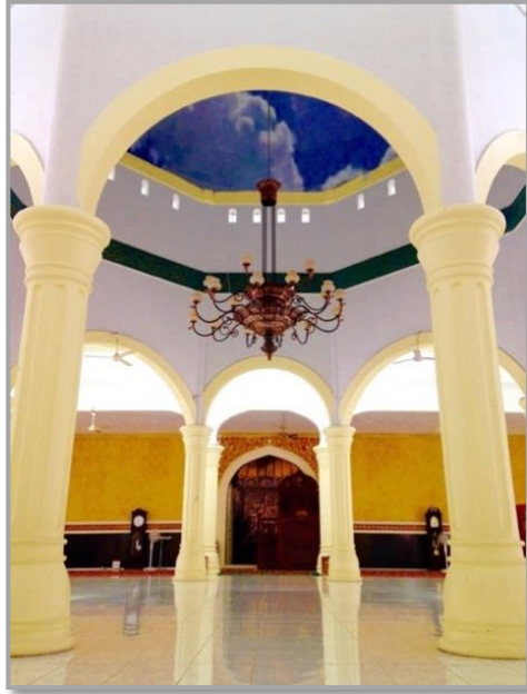
Şekil 8: Agung Babussalam Camii kubbeli bölüm 24