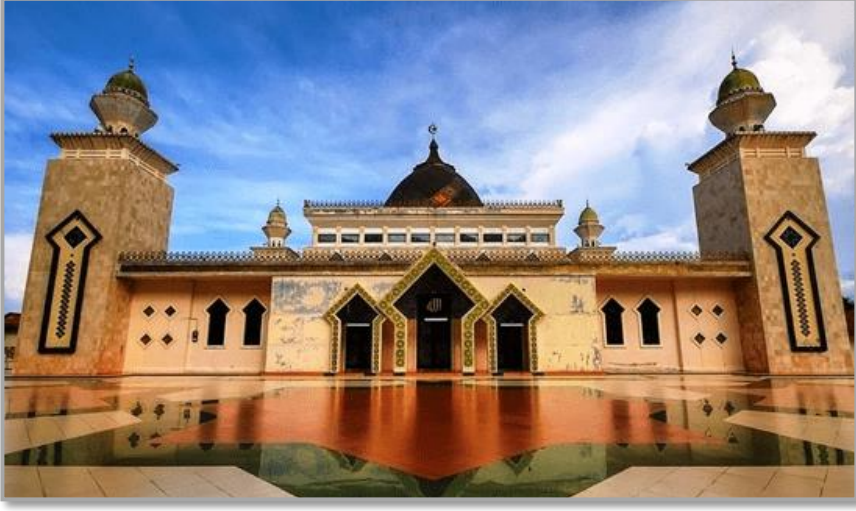
Şekil 7: Agung Babussalam Camii dışarıdan görünüm 23