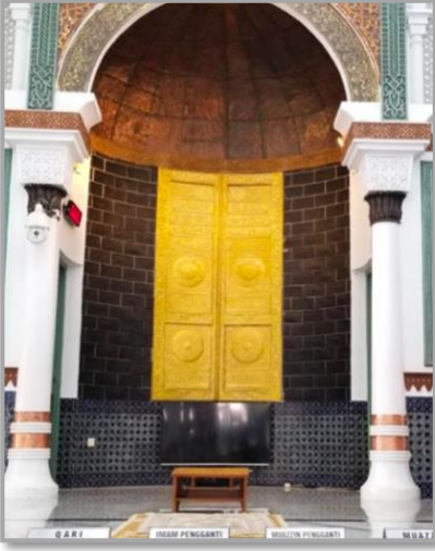
Şekil 16: Beytürrahman Camii'nin mihrabı ve minber. 34