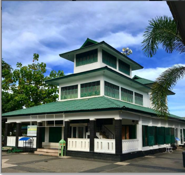
Şekil 6: Tengku Di Anjong Camii 22