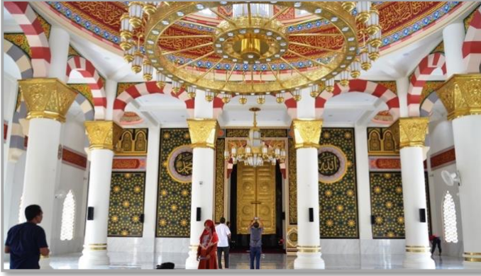
Şekil 13: Keuchik Leumik Camii iç mekân 29

Mimari bakımdan Beytürrahman Camii ile farklı olsalar da mihrap düzenlemesi benzetmektedir. Mihrabı tıpkı Beytürrahman Camii'ndeki gibi Kâbe Kapısı şeklinde yapılmıştır. Üç tarafı ayet kuşağıyla kaplı olan sivri kemerli hücre, dikdörtgen bir niş içinde yer almaktadır. Ayet kuşağında Ayete'l-kürsi celî sülüs hatla yazılmıştır. Beytürrahman Camii'ndeki tuğla örgü bezeme burada görülmemektedir. Mihrabın sağında ve solunda İsm-i Celâl ile İsm-i Nebi yazıları bulunmaktadır. Bunların çevresi yeşil zemin üzerine altın sarısı yıldızlarla bezenmiştir.