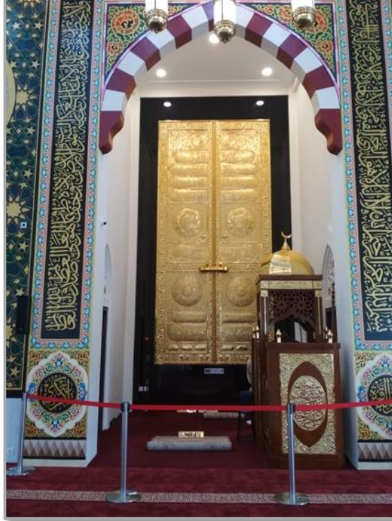
Şekil 14: Keuchik Leumik Camii mihrabı 30

Dikdörtgen bir hücre şeklinde olan mihrabın içinde sağ ve solda kapıların yer aldığı görülmektedir. Buralardan yanlardaki odalara girilmektedir. Sağ ve sol duvarlar beyaz renkte olup kible yönündeki cephe, Kabe Kapısı şeklinde tasarlanmıştır.