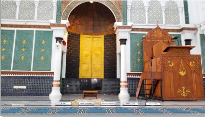
Şekil 4: Beytürrrahman Camii'nin mihrab ve minberi. 19

Cami, çok destekli ve üzeri dışta kubbeli olup içte düz örtülüdür. Üçü ön, ikisi sol, ikisi de sağ cephede olmak üzere toplamda yedi kubbesi ve beş minaresi bulunmaktadır. Yedi adet de giriş kapısına sahiptir. Üst örtü, sütunları birbirine bağlayan at nalı kemerlerle taşınmaktadır. Kemerlerde alçı süslemeler, bitkisel kompozisyonlar halinde görülmektedir. Mihrap, iki sütunun taşıdığı bir kemer düzenlemesi içinde niş şeklinde yer almaktadır. Nişin içerisinde dizilmiş tuğlalar ve orta kısımda yer alan altın sarısı kapısıyla mihrap tasarımının Kâbe kapısı şeklinde olduğu görülmektedir. Bunun yanında minber ve vaaz kürsüsü birbirine bitişik bir düzenlemeye sahiptir. Minber, üç basamaklı olarak vaaz kürsüsüne eklenmiştir.