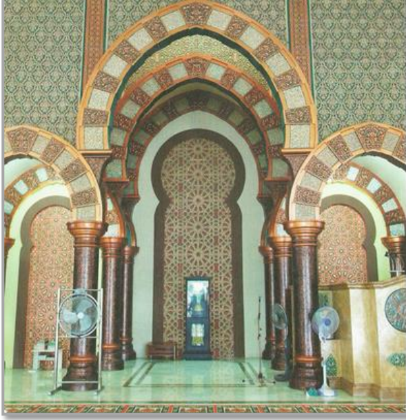
Şekil 11: Baitul Makmur Camii Mihrabı. 27

Cami, mimari bakımdan Beytürrahman Camii'ne oldukça benzemekle beraber mihrab düzenlemesinde farklılık görülmektedir. Baitul Makmur Camii'nin mihrabının at nalı kemerli ve derin bir nişe sahip olmasıyla Endülüs mimarisi etkisi görülmektedir.