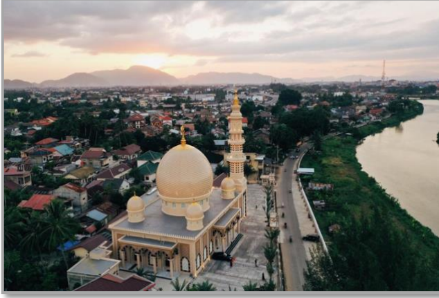
Şekil 12: Keuchik Leumik Camii yukarıdan görünüşü 28

Mimari bakımdan Beytürrahman Camii ile farklı olsalar da mihrap düzenlemesi benzetmektedir. Mihrabı tıpkı Beytürrahman Camii'ndeki gibi Kâbe Kapısı şeklinde yapılmıştır. Üç tarafı ayet kuşağıyla kaplı olan sivri kemerli hücre, dikdörtgen bir niş içinde yer almaktadır. Ayet kuşağında Ayete'l-kürsi celî sülüs hatla yazılmıştır. Beytürrahman Camii'ndeki tuğla örgü bezeme burada görülmemektedir. Mihrabın sağında ve solunda İsm-i Celâl ile İsm-i Nebi yazıları bulunmaktadır. Bunların çevresi yeşil zemin üzerine altın sarısı yıldızlarla bezenmiştir.