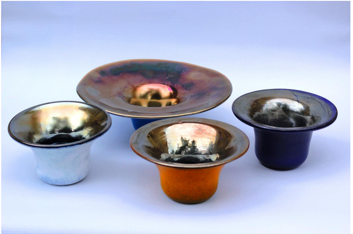
Şekil 8. Lüster uygulamalarına ait toplu fotoğraf.