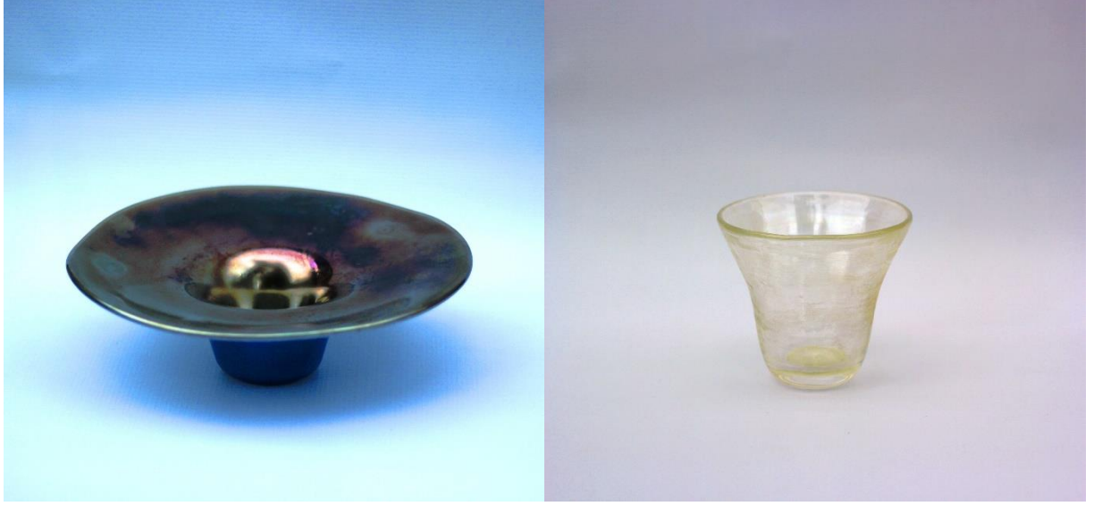
Şekil 7. Lüster uygulaması yapılan renkli ve şeffaf tabanlı cam kaseler.