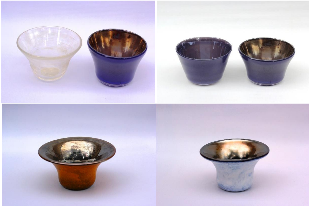
Şekil 6. Şeffaf ve renkli camlar üzerine yapılan lüster uygulamalarına ait görseller.

Şekil 6-8'de çalışmada üretilen şeffaf ve renkli camlarla üretilen lüsterli cam objeler sunulmuştur.