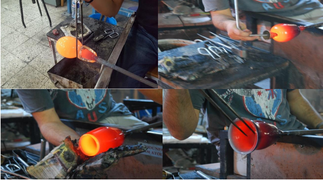
Şekil 3. Cam ürünlerin şekillendirme aşamaları.