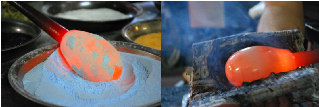
Şekil 2. Renkli sıcak cam üretim prosesi.

Renkli cam elde etmek için bir kaba konulan toz halinde cam pigmentleri cam fırından alınan fıska üzerine sarılmıştır. Böylelikle zemine cam pigmentlerle renklendirme yapılmıştır. Pigment tozlarının sıcak cam yüzeyi ile bütünleşebilmesi ve daha rahat şekillendirme yapılabilmesi için cam form tromelde ısıtılarak yumuşatılmıştır. Sonraki aşamada ise ıslak gazete yardımı ile cama verilen şekil toparlanmış ve üfleme yolu ile form istenilen boyuta getirilmiştir (Şekil 2).