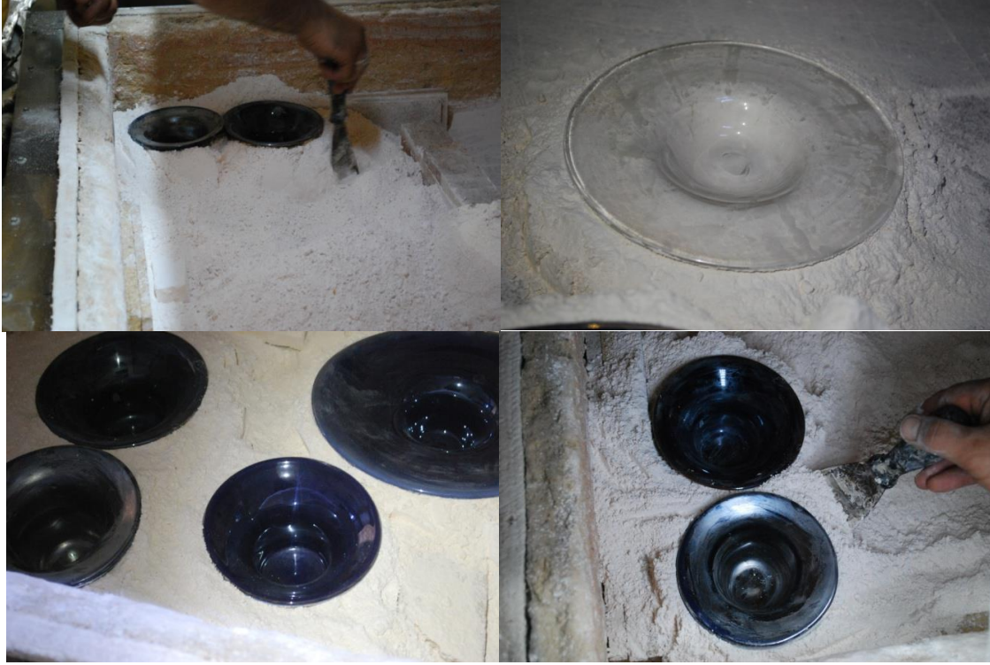
Şekil 5. Lüsterli camların fırınlama aşaması.

Cam yüzeylere uygulama yapılırken dikkat edilecek husus uygulama sıcaklığıdır. Cam yüzeylerde uygulama 500-650°C’de yapılır. Bu aşama çok önemlidir çünkü lüster, uygulama zeminine tam yapışmazsa kısa süre sonra aşınarak sistemden uzaklaşacaktır. Lüster uygulanan cam formlar fırın içerisine pişmiş alçı yardımıyla desteklenerek yerleştirilmiştir.