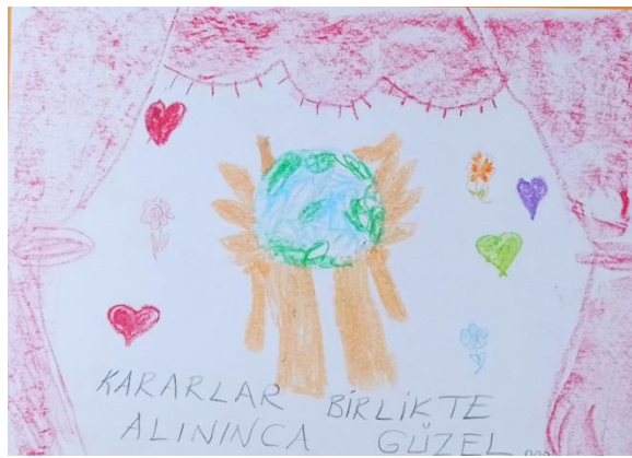
Görsel 5. Katılımcı Deniz'in aile tutumları atölyesi değerlendirme aşamasında demokratik aileyi tanımladığı resmi

“Bu eğitimden sonra demokratik bir ebeveyn olmaya gayret edeceğim. Herkes istediğini sevgi ve saygı içinde söylesin. Çocuğumu da böyle yetiştirmeye özen göstereceğim.” (Deniz, Katılımcı günlüğü) (Görsel 5.)