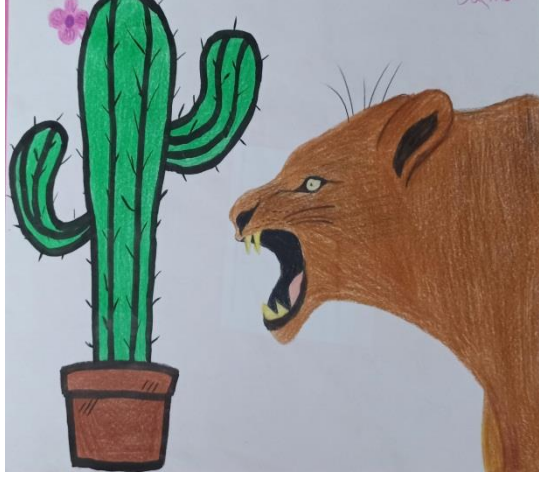
Görsel 2. Katılımcı Sümbül'ün iletişim atölyesi değerlendirme aşamasında empati üzerine yaptığı resim

“Hepimiz dikenlerimizi çıkarırsak yaralanmadan çatışmadan çıkmak mümkün olmuyor. Çocuklara nasıl yaklaşırsak öyle yaklaşıyorlar. Drama bana dikenin içindeki gülü görebilmenin önemli olduğunu gösterdi.” (Sümbül, Katılımcı günlüğü) (Görsel 2.)