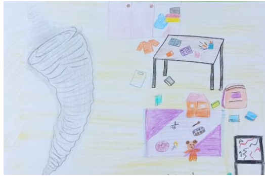
Görsel 4. Katılımcı Mutlu'nun öfke kontrolü atölyesi değerlendirme aşamasında öfkesini tanımladığı resmi

“Öfkemi bir fırtınaya benzettim bugün atölyede. Yaptığım canlandırmada öfkenin ne kadar yıkıcı olabileceğini gördüm. Bu kadar yıkıcı olmaya gerek var mı diye düşündüm. Öfkemi kontrol edebilirsem düzen de geliyor aslında.” (Mutlu, Katılımcı günlüğü) (Görsel 4.)