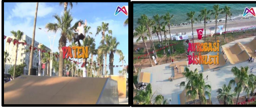
Resim 1 ve 2: Kültür Park Spor Alanları

Günümüzde parklar, sadece yürüyüş ya da koşu değil futbol, basketbol, tenis, pilates, yoga, kayak, paten ya da bisiklet gibi pek çok farklı spor yapma imkânı sunmaktadır (Resim 1 ve 2). Bunun yanı sıra parklarda bulunan ve çeşitli hizmetlerin sunulduğu kafeler (Resim 3) ile nikâh merasimlerinin yapılabildiği çeşitli açık ve kapalı alanlarda (Resim 4) özel gün etkinlikleri gerçekleştirilebilmektedir.