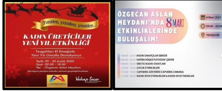
Resim 5 ve 6: K lt r Park Kadınlar İin Yılbaşı Etkinliđi ve D nya Kadınlar G n  Etkinliđi