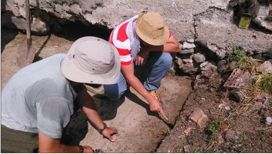
Resim 5: Mozaik kurtarma kazısı