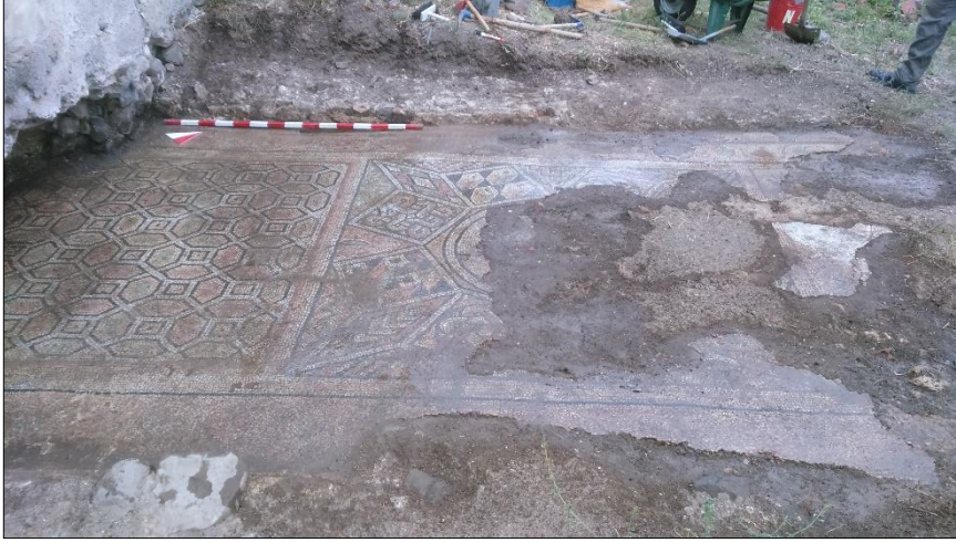
Resim 8: Mozaik kurtarma kazısı çalışmaları.