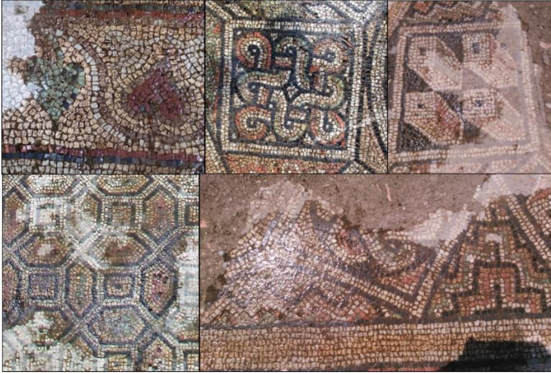
Resim 11: Mozaik panolarından ayrıntılar.