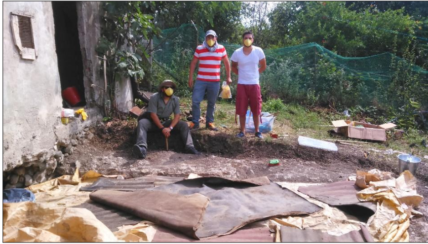
Resim 2: Mozaik kurtarma kazısı çalışmaları.