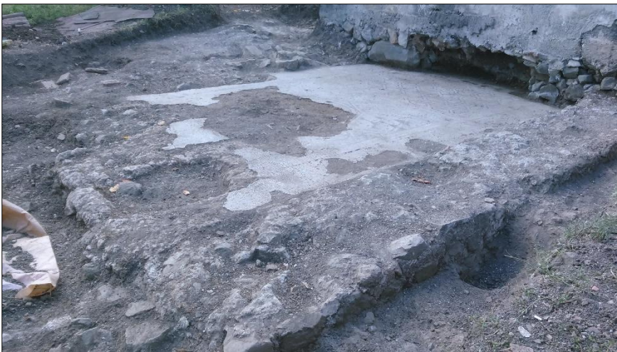
Resim 6: Mozaik kurtarma kazısı