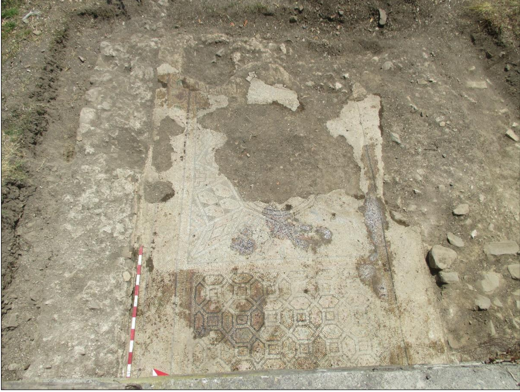
Resim 10: Mozaik kurtarma kazısı çalışmaları.