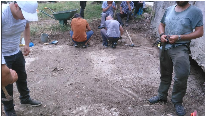
Resim 3: Mozaik kurtarma kazısı çalışmaları.