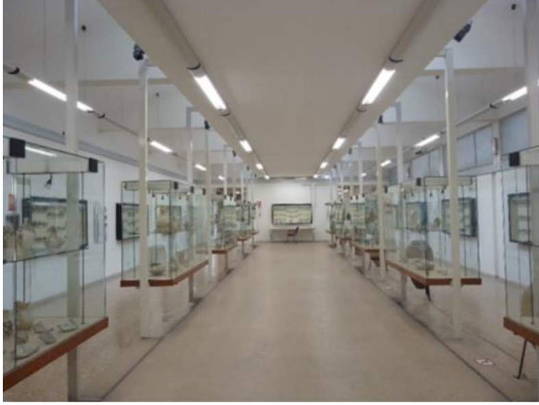
Görsel 8. Salon D