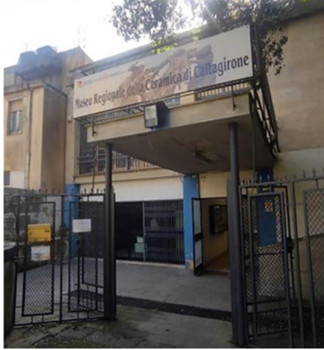
Görsel 4. Caltagirone Bölge Seramik Müzesi'nde korunan plan