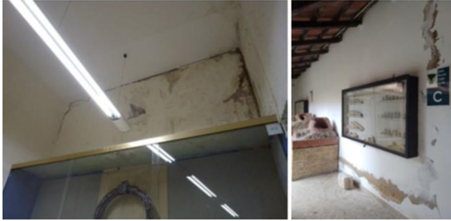
Görsel 13. Salon F ve C'de oluşan bozulmalar