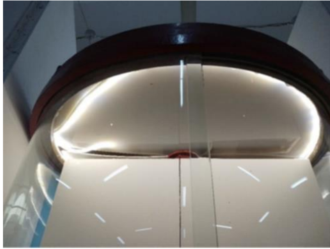
Görsel 12. Cam vitrin içindeki sarı led aydınlatma ve oluşan olumsuz etki

Müzenin iç ortamının dış koşullardan ne kadar etkilendiğini anlamak amacıyla, eserlerin yakından izlenmesi gerekmektedir. Sergileme ve depolama koşullarındaki sıcaklık ve bağıl nem seviyelerindeki değişiklikler, eserlerin hızlıca bozulmasına ve telafi edilemeyecek hasarlara neden olmaktadır (Kuzucuoğlu, 2011, s. 17). Müzedeki sıcaklık ve bağıl nem ölçümlerinin düzenli ve sık aralıklarla takip edilmesi gerekmektedir. Sıcak ve nem değerlerinin günlük, haftalık ve yıllık olarak