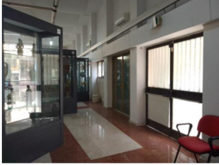
Görsel 11. Salon A, detay

Caltagirone Bölge Seramik Müzesi'ndeki bazı vitrinlerinde, aydınlatmada özensizlik görülmektedir. Genel aydınlatma, yalnızca tavanda dikey ya da yatay floresan lambalarla sağlanmıştır ve camda ışık kaynaklarının yansımaları görülmektedir (Görsel 12).